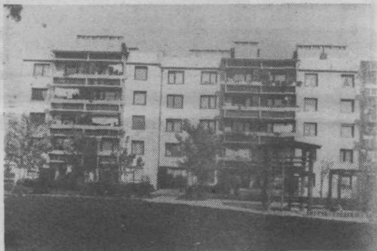
Jarška razglednica