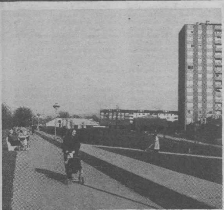
Popoldanski sprehod ob Ljubljani