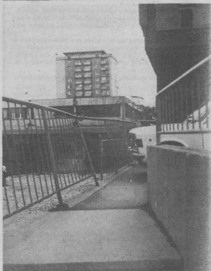
Krepko »načeta« železna ograja pri Jugotehniku v sicer lepi arhitektonski celoti sredi Most (Hvastija)