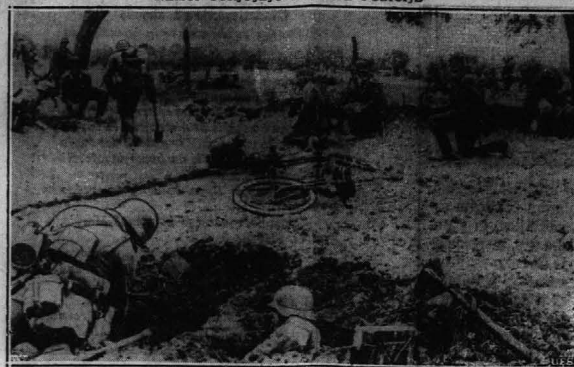
Nekje v Rusiji azijski vojaki kopljejo strelne jarkne in delajo druge utrube v zavzeti poziciji.

Funt jabolka tenko olup, pri muhi izdolbi peševje in praznino napolni z rozinami in sekljanim citronatom. Zloži jabolka drugega k drugemu v primerno velik z maslom ali mastjo namazan model. Vrh vsakega jabolka položi krpico presnega masla in postavi v pečico. Nato pripravi kremo iz treh rumenjakov, štiri unče sladkorja, (lahko malce več), tri in pol unče olupljenih in zmlitih mandeljnov, (almonds), dveh žlic ruma in temu primešaj še sneg treh beljakov. Na pol pečena jabolka oblij s to kremo, nakar jih zopet deni v peč in jih v zmerno topli pečici peči dokler niso pečena. Peče-