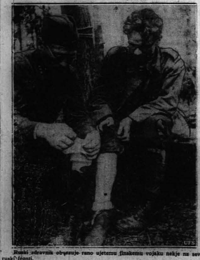
Ruski zdravnik obveščuje rano ujetemu finskemu vojaku nekje na severni ruski fronti.

Banka, ki vam nudi vse ugodnosti. 2201 West Cermak Road, Chicago, Illinois Telefon: CANAL 1955