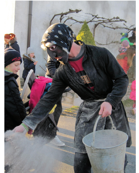
Posipanje s pepelom

Zemonke in Zemonci, ki so vole in ploh množično pričakali pred spomenikom, so bili nad obuditvijo običaja navdušeni. Vladimir Šuštar - Froncjotov je svoj borjač odstopil za pogo-