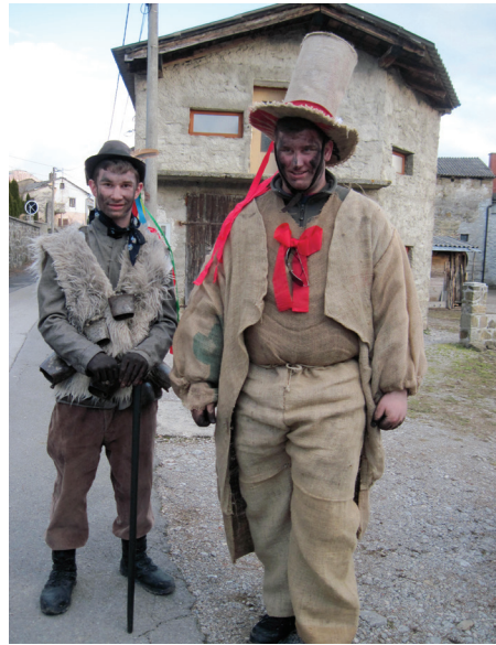
Žakljevinar (celoten kostum je imel narejen iz starih 'žaklju') in zvončar