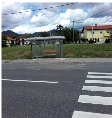
Urejeno avtobusno postajališče Zemonska vaga