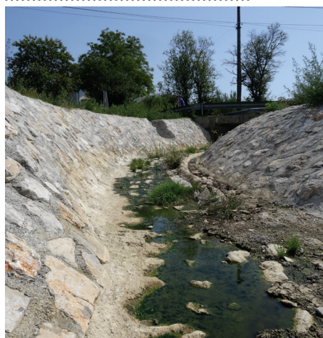
Urejena struga hudourniškega potoka (pri Bricotu)