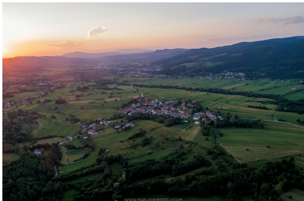
Panoramski posnetek Dolnjega Zemona