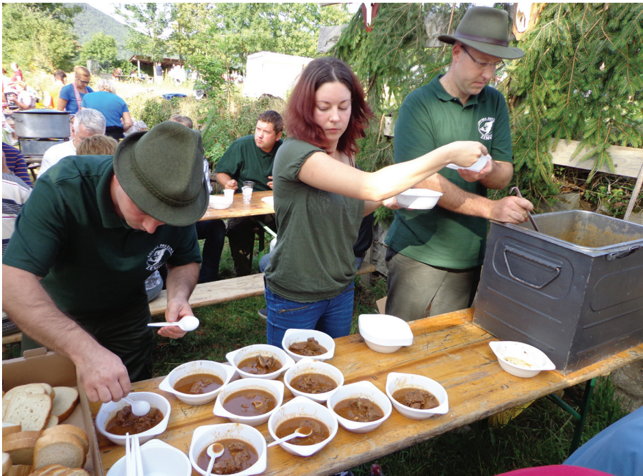
Lovska družina Zemon je pripravila slasten divjačinski golaž.