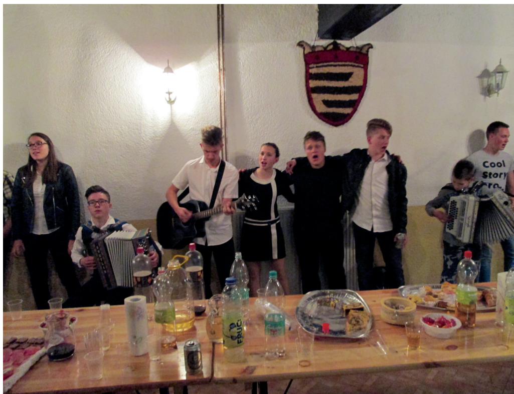
Veselje ob uspešnem zaključku koncerta