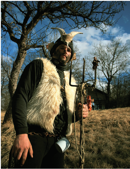
Hudič je nosil prave kozje rogove, stare kovane vile in kožnat telovnik.