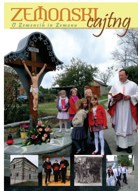
Prva številka Zemonskega cajtnga

domačina Potepana, nastale po zapisih izpred 140 let; Zemonci so lahko brali o pustu, o večeru ljudskih napevov, o Mali južni ... Poleg kulturnih so v časopisu našle prostor tudi zgodovinske in etnografske teme: od starih fotografij do zgodovinskih dogodkov ali pa tekst na temo deželne meje med Kranjsko in Istro. KD Grad, ki skrbi za bogato bero kulturnih, etnoloških in ostalih dogodkov v domačem kraju, je z izdajo zemonskega časnika dodalo še en kamenček v svoj ustvarjalni mozaik. Kot je lani