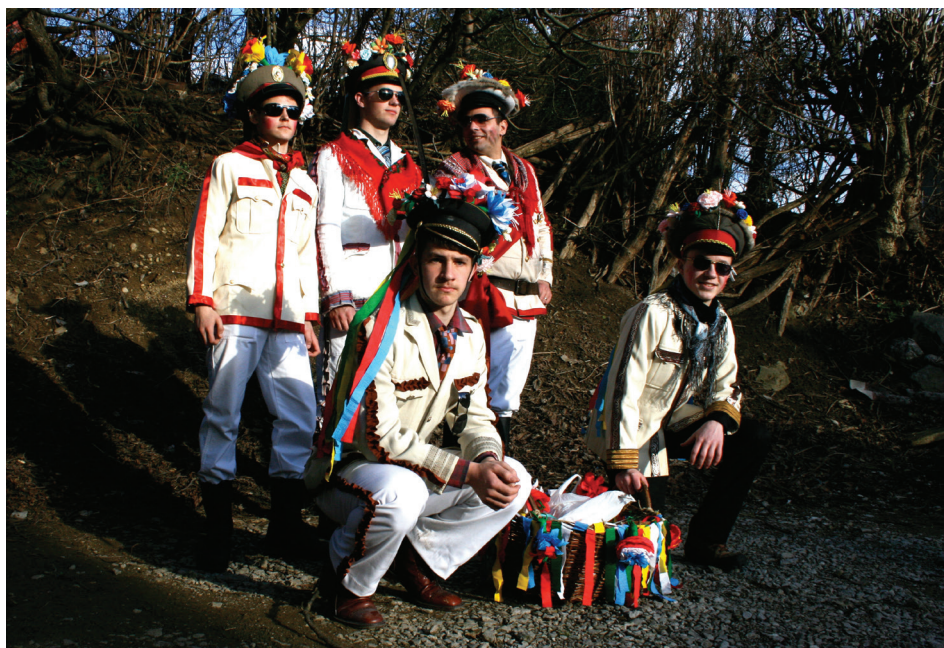
Ta lepi so bili vedno poberini. Bele obleke s piso na hlačah, škornji, s pisanimi trakci ali krep papirjem obrobljena 'jəkjata' in bogata pokrivala, okrašena z rožami iz krep papirja in 'panklci'. Fantje so si od nekdaj radi dodali sončna očala in si z rdečilom namazali lica.