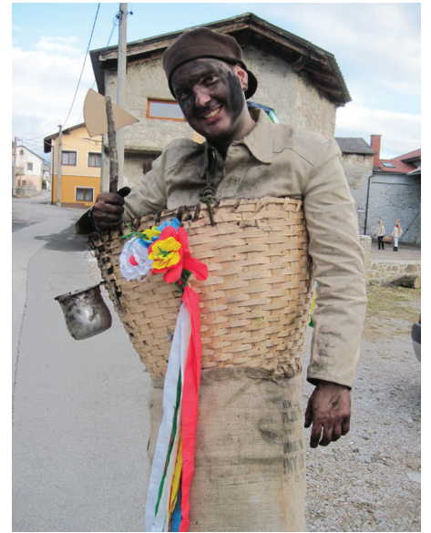
Lik 'kvošarja' smo odkrili na fotografiji iz leta 1969.