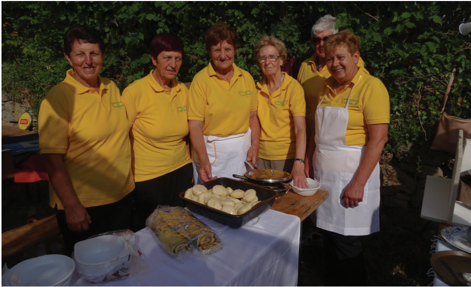
Podraželske žene so kuhale krompir na 'župi' z 'jatrno'co', minutarje in štruklje.