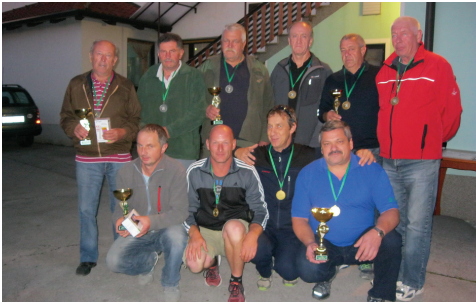
Zmagovalne ekipe in posamezniki