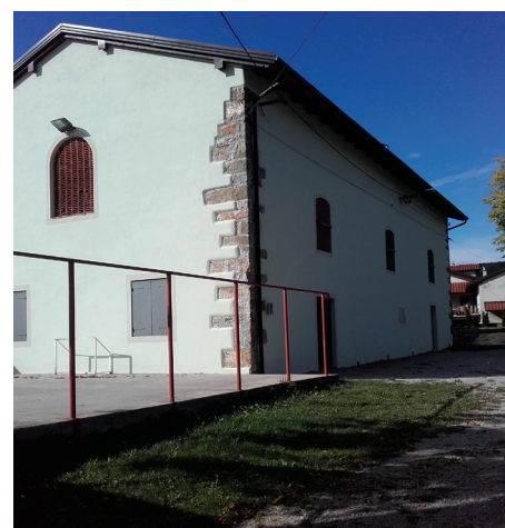
Dvorana na Dolnjem Zemonu je dobila novo streho in fasado.