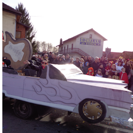
Pravi ameriški cadillac