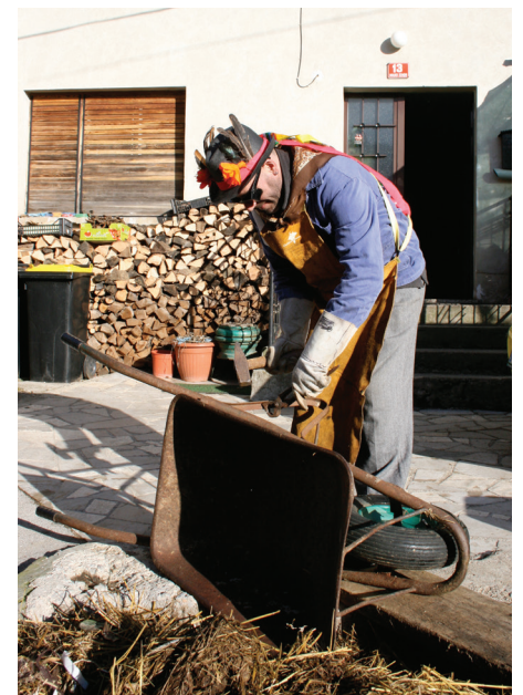
Kovač se je med poberijo rad lotil dela.