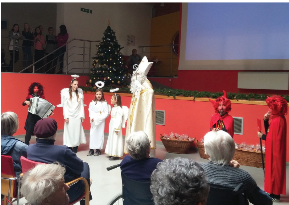
Obisk sv. Miklavža v Domu starejših občanov Ilirska Bistrica

Tudi v preteklem letu smo v KD Grad pripravili tradicionalno miklavževanje. Začelo se je na domačem odru, kjer smo 3. decembra 2016 premierno uprizorili gledališko predstavo Žogica Nogica. Polna dvorana radovednih oči, ki so sijale z otroških obrazov, in bučen aplavz, namenjen mladi gledališki ekipi, je poplačal vse ure vaj in bil dobra popotnica hudemu decembrskemu tempu nastopov. Domača dvorana je skoraj pokala po šivih, saj je kar 80 otrok s svojimi starši in ostalimi gledalci težko pričakovalo prihod Miklavža. Z glasnimi kli-