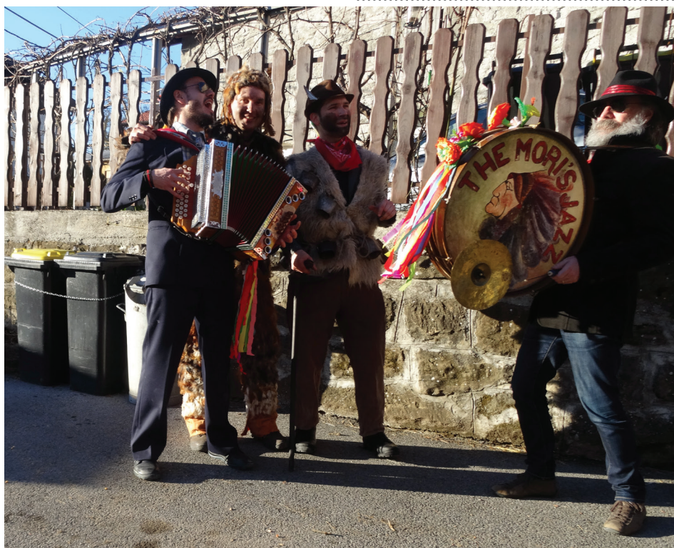
Pristno pustno vzdušje