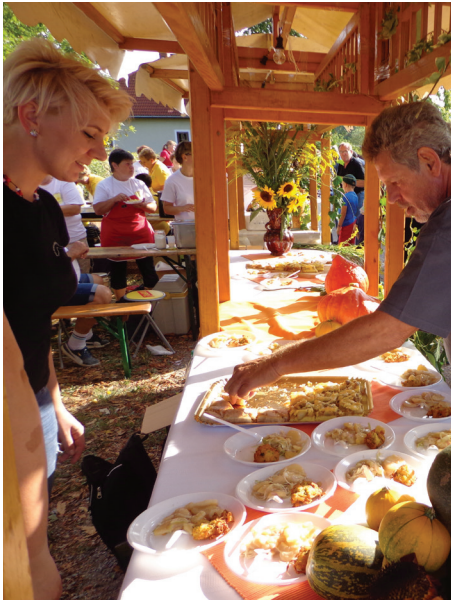
Na stojnici z Bača je dišalo po bučkinih polpetih in krompirju na solati.

čine izdelani nosilci za brisače, vendar pa se jih je ohranilo zelo malo. Na stenah niso manjkale podobe, kot so Srce Jezusovo, Srce Marijino in kakšne družinske fotografije. "Vsaka hiša je imela tudi uro na navijanje, ki je ostala v hiši več generacij. Ob smrti v hiši so kazalec ustavili in uro spet zagnali šele po pogrebu. V kuhinji je bil pogost tudi križ, reklo se mu je bugac ," je spomnil Rojc.