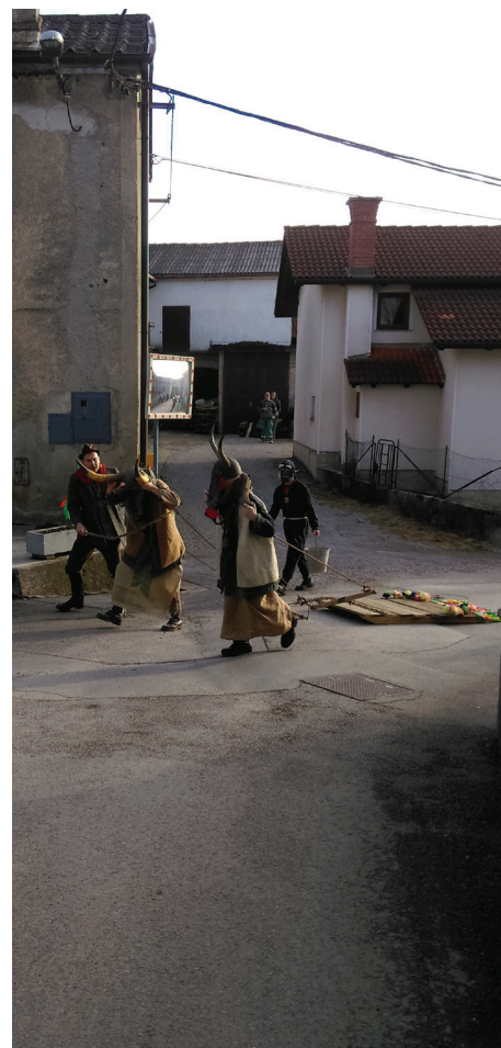
Ploh so vlekli po celi vasi.