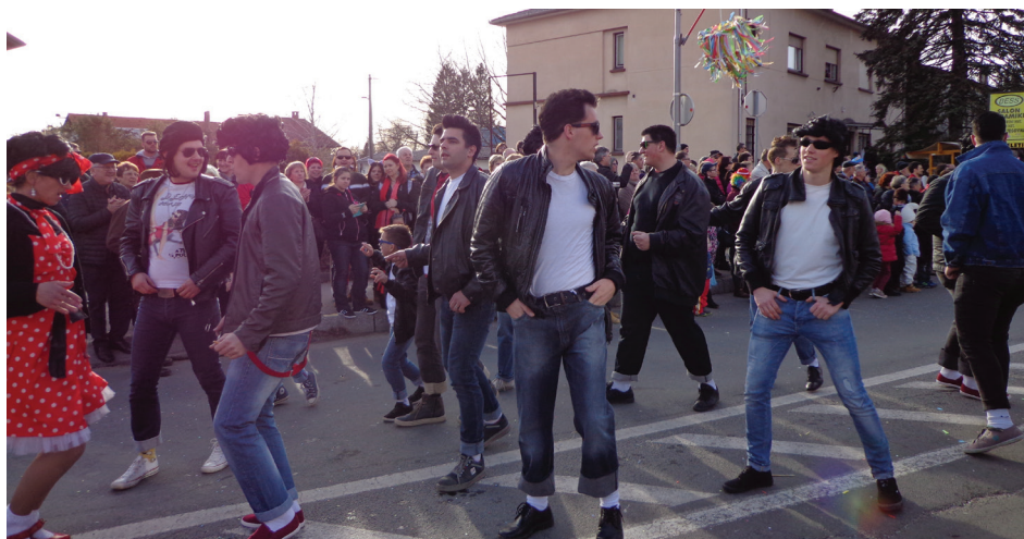
Fantje so dekletom jemali dih.