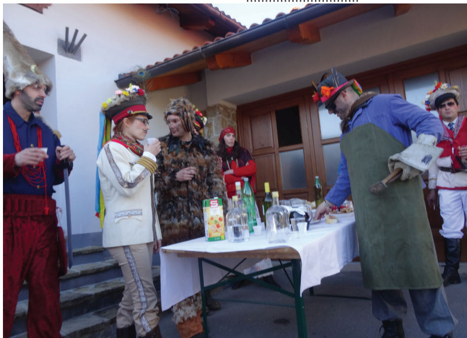
Domačini so pred vaškim domom pripravili pogostitev za maske.