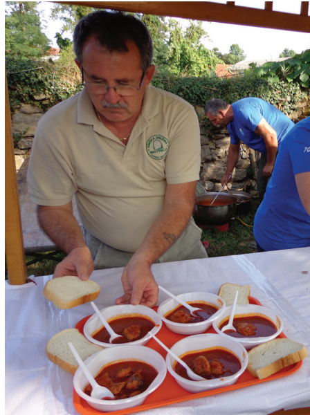
Ribiška družina Bistrica je postregla z ribjim paprikašem.

Da je bila razstavljena kuhinja še pristnejša, sta avtorja poskrbela tudi s stensko kuliso, ki je prikazovala posebno tehniko pleskanja. Na razstavi je bil prikazan način, ki je bil pogost kar nekaj desetletij. "Do višine približno enega metra so stene pobarvali v zeleno ali rjavo in povaljčkali, saj se je ta predel najbolj umazal. Zgornji del zidu so pustili v belem ali pa so ga s tehniko šabloniranja (šablonam so pravili kolomirji) okrasili z različnimi motivi. Kasneje so z valjčki