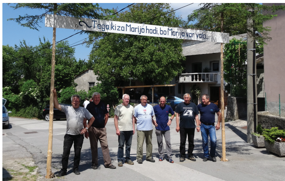
»Tega, ki za Marijo hodi, bo Marija var'vala,« je bilo letos napisano na slavoloku.