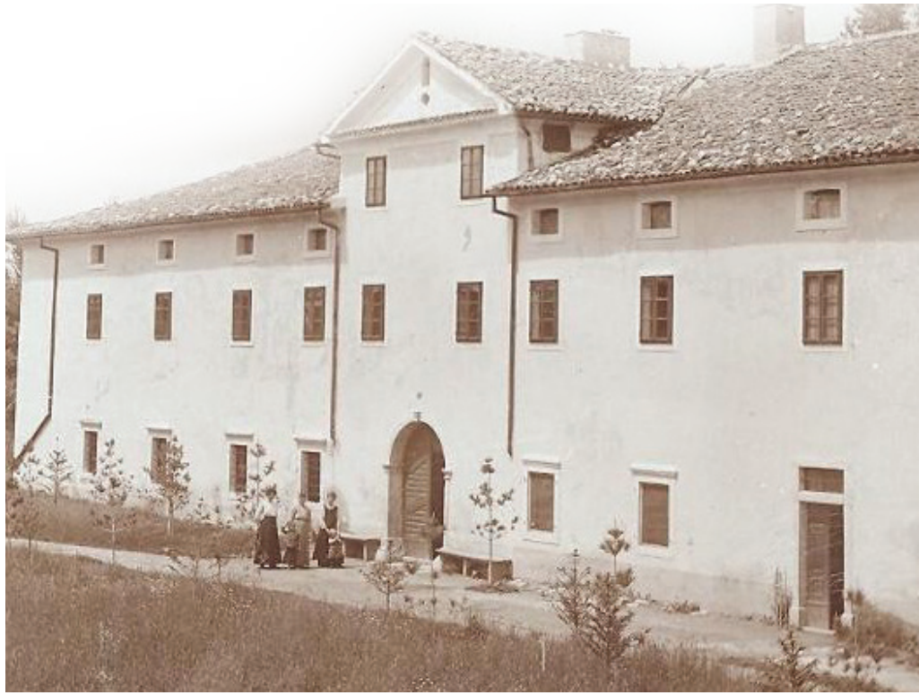
Poslopje gradu v Jablanici, kjer je bil sedež občine (hrani Knjižnica M. Samsa).

V povojnem obdobju (zasledi- mo v dokumentih iz leta 1946) je Okrajni narodni osvobodil- ni odbor – Odsek za izgradnjo narodne oblasti Ilirska Bistrica na Dolnjem Zemonu ustanovil Krajevni narodno-osvobodilni odbor Dolnji Zemon. Leta 1948 je začela veljati uredba o matič- nih okoliših oziroma enotah, ki so združevale krajevne ljudske odbore (KLO), povezane v okraj. Tako je Dolnji Zemon z ostalimi naselji, predhodno združenimi v občino Jablanica, prešel pod sedež Ilirska Bistrica, a že čez dve leti, torej leta 1950, so prišle spremembe z namenom približe- vati ljudstvu upravno-teritorial- no podobo KLO. Dolnji Zemon je bil tako združen s Kosezami v KLO Koseze. Že leta 1950 je spet prišlo do sprememb. KLO-ji so bili ukinjeni, ukinjeni so bili kra- ji kot temeljne upravne enote in vedene občine. Dolnji Zemon je bil skupaj z naselji Brce, Dobro- polje, Harije, Soze, Ilirska Bistri- ca, Jasen, Koseze, Mala Bukovica, Mereče, Podstenjšek, Podstenje, Tominje, Topolc, Velika Bukovi- ca, Zajelšje, Zarečica in Zarečje dodeljen v Mestno občino Ilirska Bistrica, medtem ko so naselja Gornji Zemon, Jablanica, Vrbi- ca, Kuteževo, Podgraje, Trpčane, Vrbovo in Vrbica pripadle no- voustanovljeni Občini Jablanica pod Snežnikom. Takrat so bile ustanovljene še občine Jelšane, Knežak in Prem. Leta 1955 so bile vse zadnje naštete občine