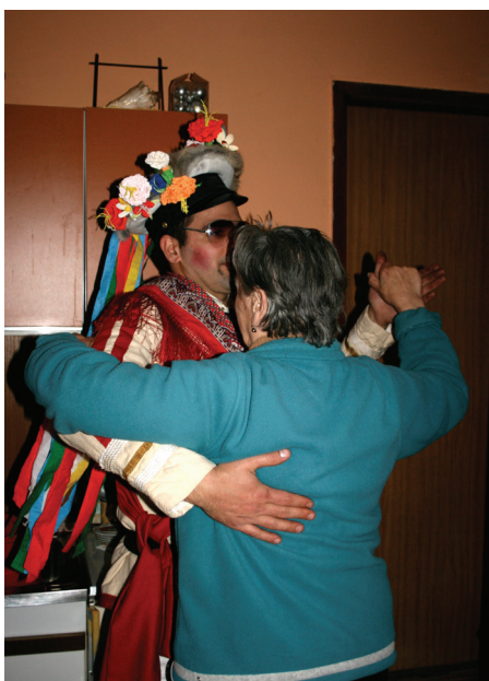
V vsaki hiši se je moralo zaplesati z gospodinjo za debelo repo.