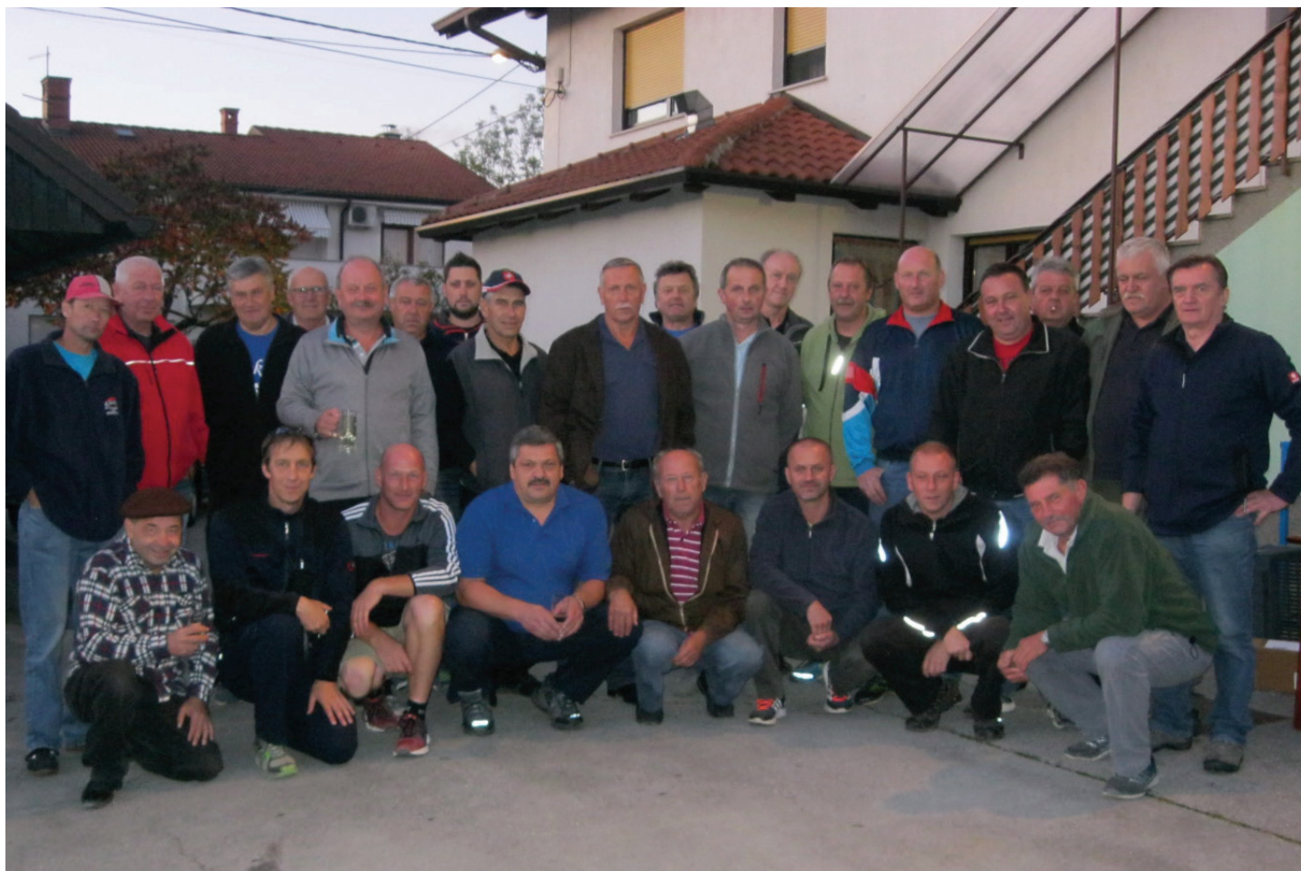
Tekmovalci devetega turnirja