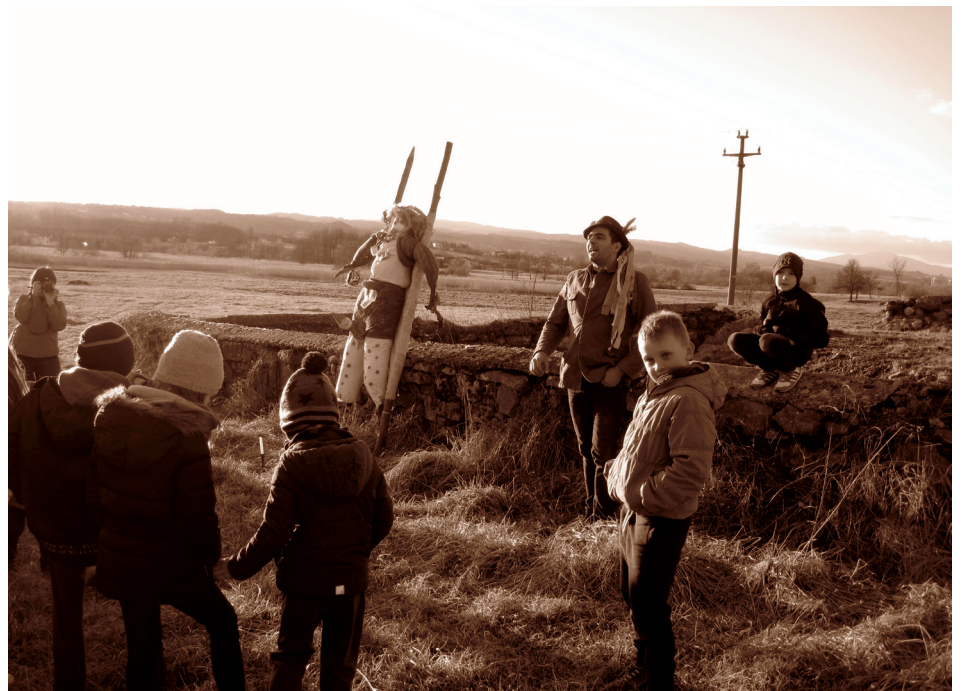
Pusta smo obtožili za vse 'narobije' v preteklem letu.