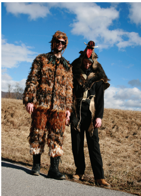
Kokoš, izpričana še iz časov Italije, in merjasec, odkrit na fotografijah s konca šestdesetih let.