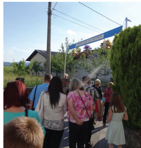
Tudi pri Srpanovah vsako leto postavijo slavolok