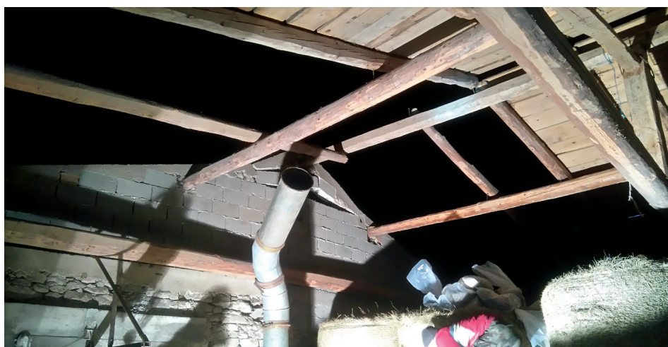
Strehi Kovačove hiše v Brezju in Pwštarjovaga gospodarskega poslopja