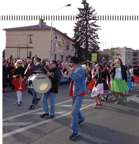
Brez harmonike in bobna ne gre.