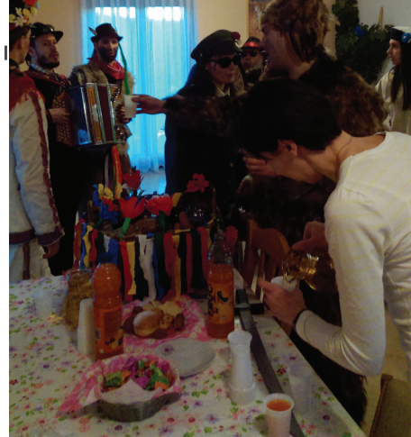
Domačini so maskam z veseljem postregli.