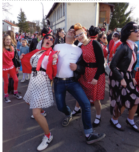
Skoraj kot v filmu