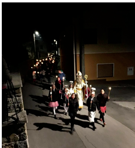
Sprehod z baklami