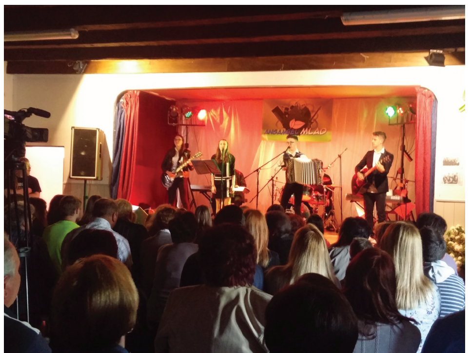
Koncert mladih glasbenikov je napolnil dvorano v Gradu.

dejavnosti (JSKD) iz Zveza kulturnih društev Slovenije (ZKDS). Tudi člani ansambla MLAD pravijo, da v sodobnem času, ko imamo medije in ekrane s tisočermi dogodki na doseg dlani - klik daleč, vsak človek še vedno