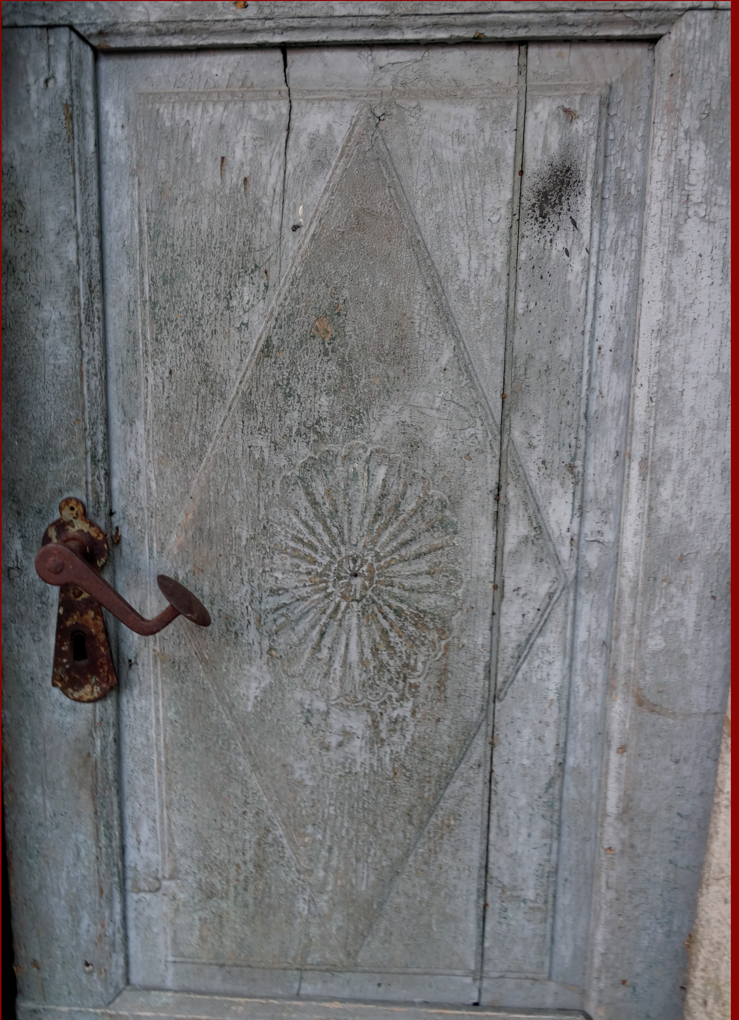
Oštarjova vrata na Dolnjem Zemonu