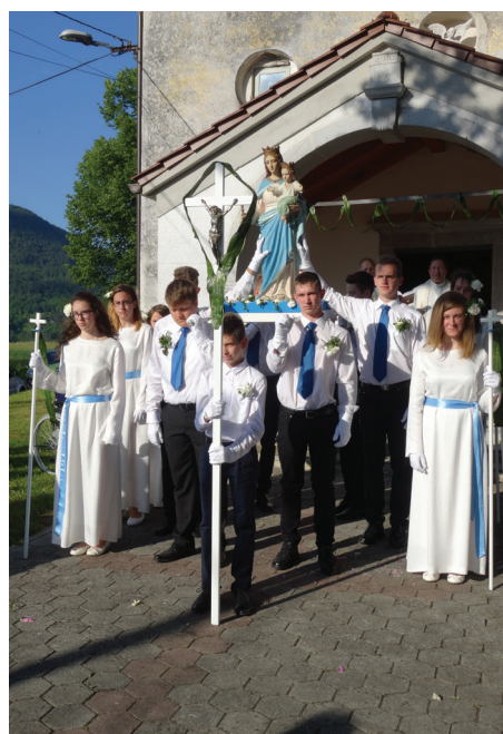
Marijin kip in nosilci ob prihodu s procesije