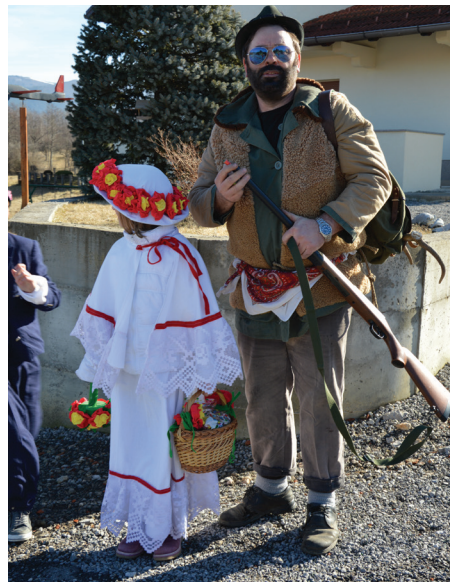
Deklica in lovec