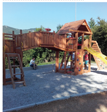
Novo otroško igrišče na Gornjem Zemonu