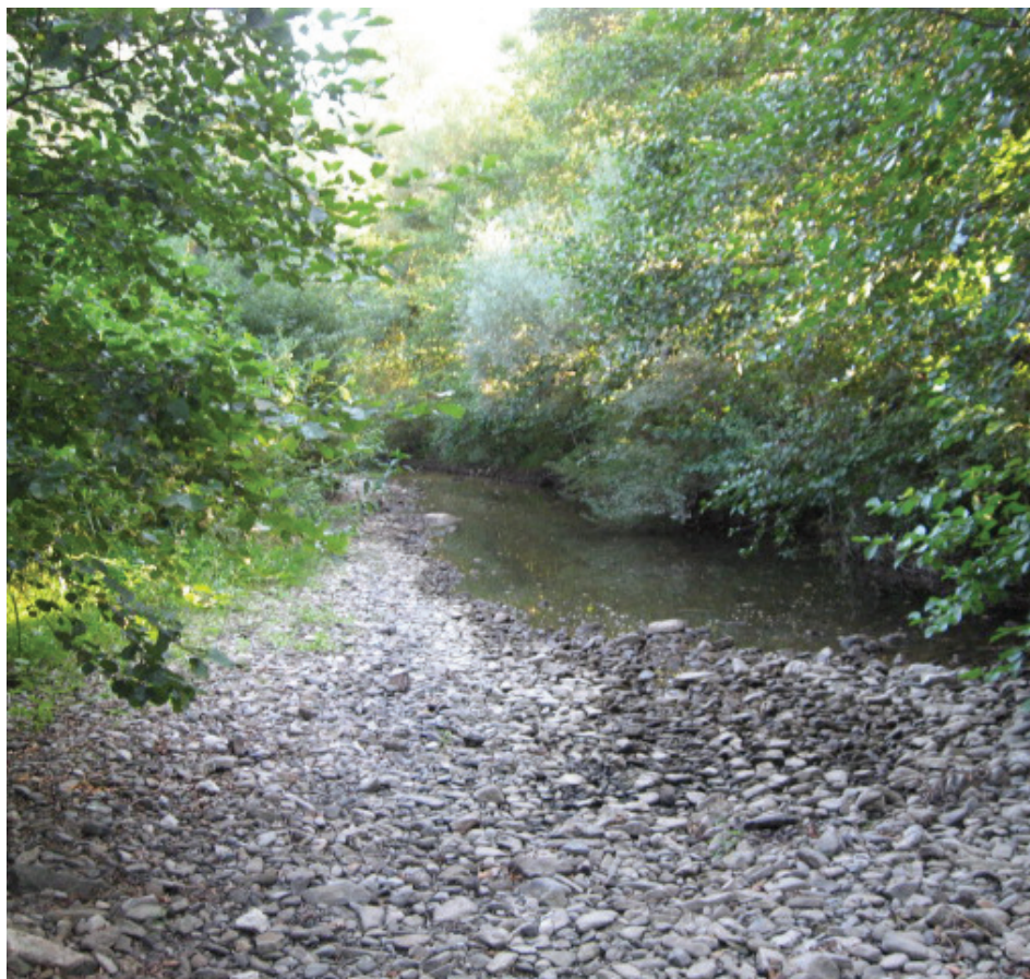
Letošnje sušno poletje ne bi nudilo kopalnega užitka, tudi če bi bila reka čista.