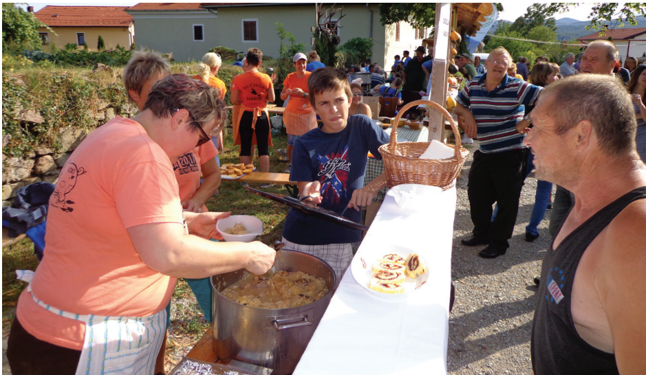
Društvo ŠTEK Katarina iz Novokračin je razveselilo s krompirjevo 'palento' in zeljem.

lovanje in pomoč zahvalila vsem neumornim članom KD Grad, ki se trudijo, da Mala južna ostaja med najbolj obiskanimi poletnimi prireditvami na Bistriškem.