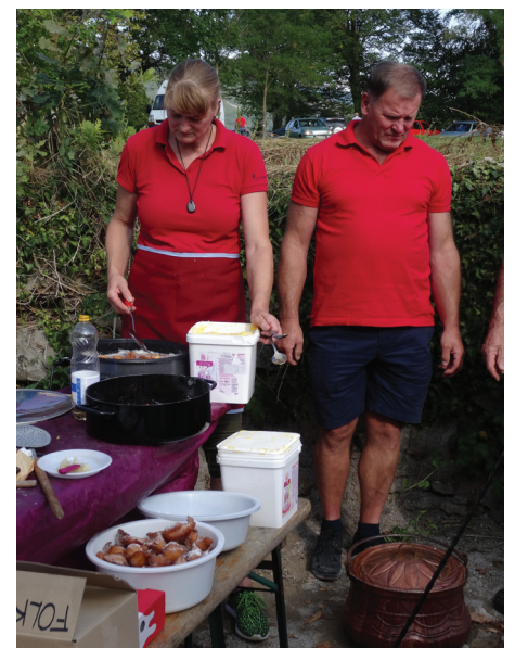
FS Gradina je kuhala krompir na zevnici.