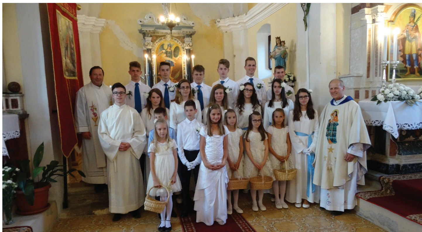
Nosilci in spremljevalci Marijinega kipa

Dan pred nedeljsko sv. mašo, 28. maja, so moške združili moči še v postavljanju slavalokov, dekleta in žene pa v spletanju vencev in zelenih trakov. Še čebele so tisto soboto posebej nagajivo obletavale košare s pisanim cvetjem,