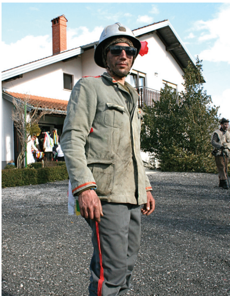
Gasilec je vihnel sireno in 'sič'.