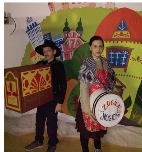
Dedek in babica