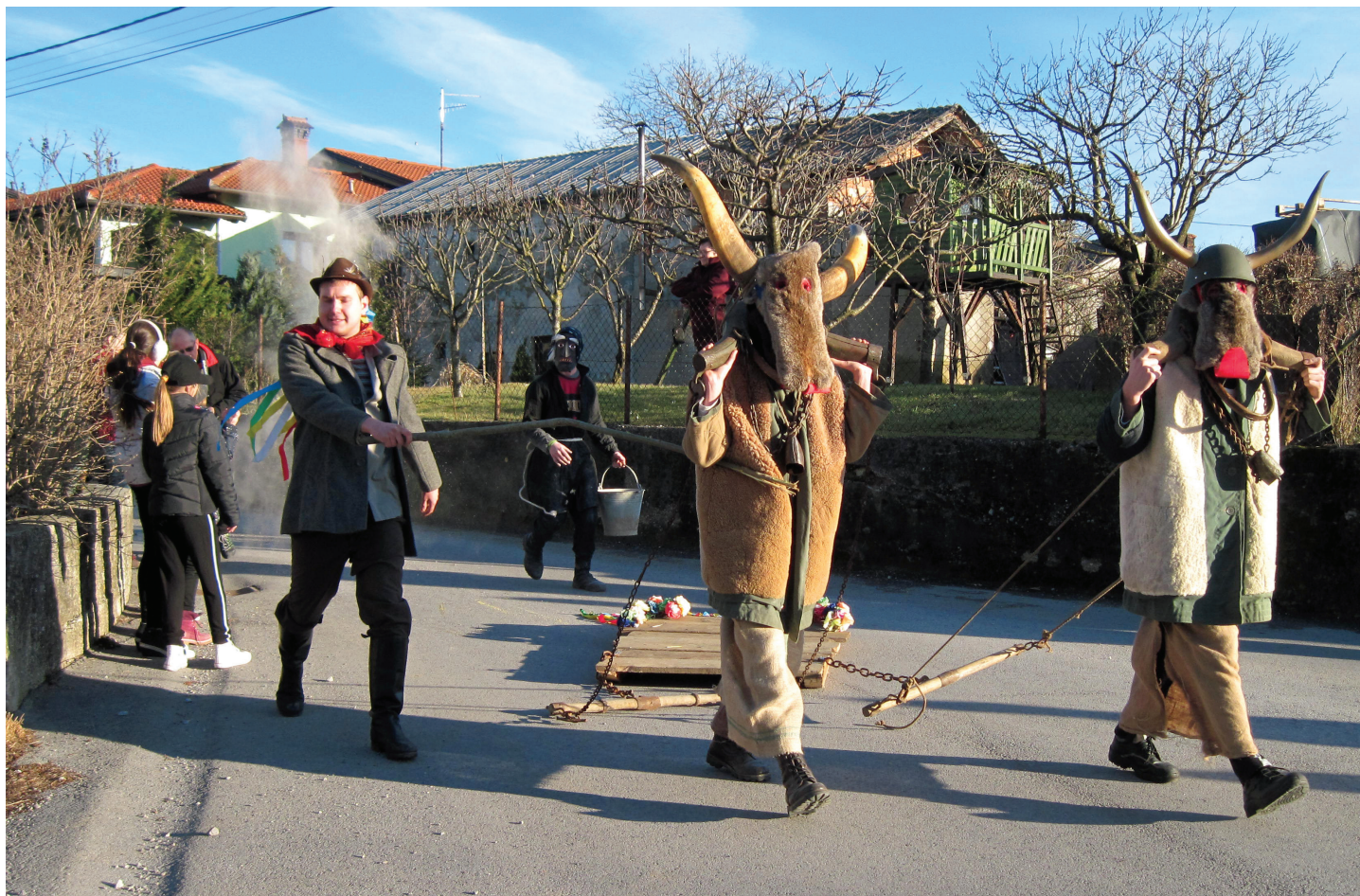
Ploh je pri spomeniku pričakalo veliko gledalcev.