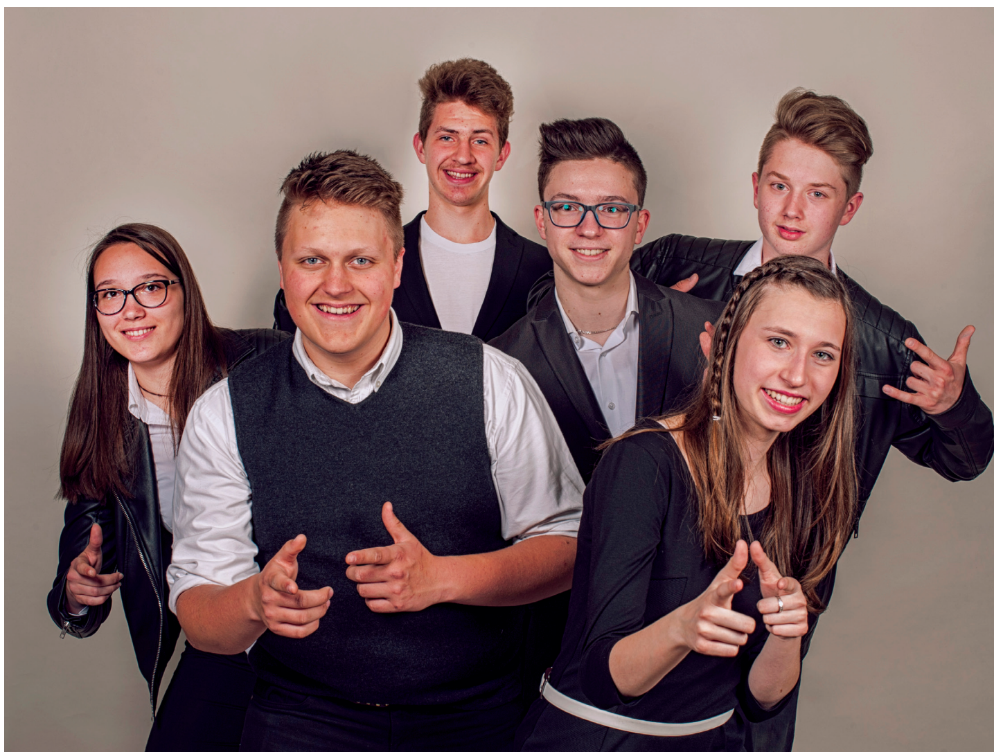
Člani ansambla Mlad