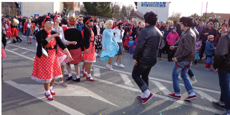
Koreografija je navdušila gledalce.