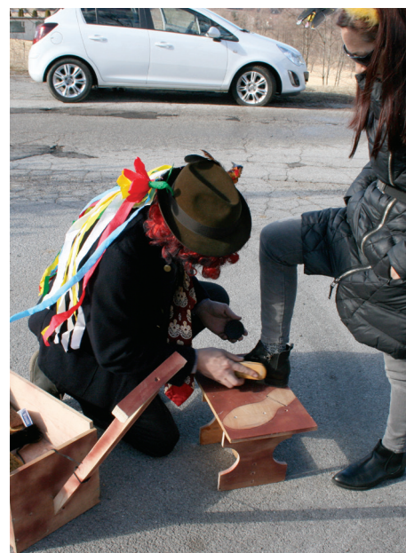
Ščetkar je celi vasi 'opucou šulne'.