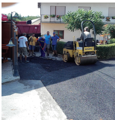
Dela na vaški cesti za gostilno Zemonska vaga