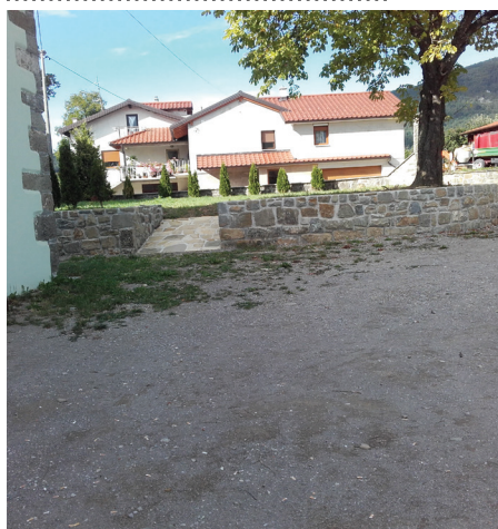
Grad je v zadnjih nekaj letih dobil lepo zunanjo podobo.