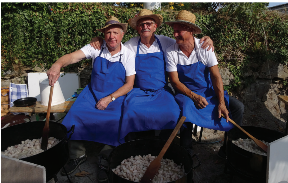
Jasenci so pripravili tradicionalni krompir z ocvirki in palačinke.