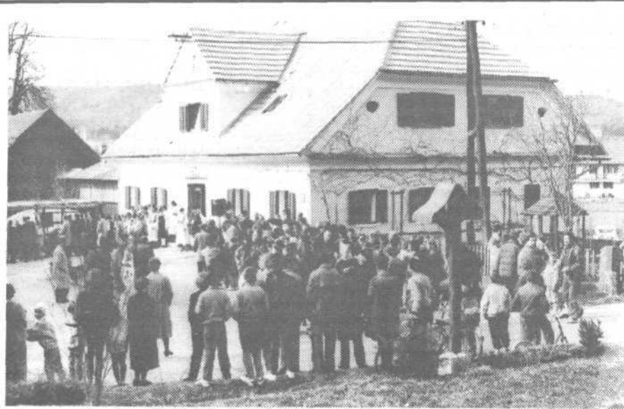
S 4. VAŠKEGA PRAZNIKA V VNANJH GORICAH