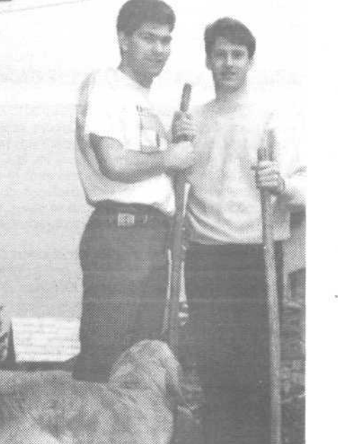
Tokrat sta očistila stopnice. Slikal sem ju pri delu skupaj z našim psom Majem, ki je njun prijatelj. STANE TRČEK

Predsednik gradbenega odbora pri KS Rudnik