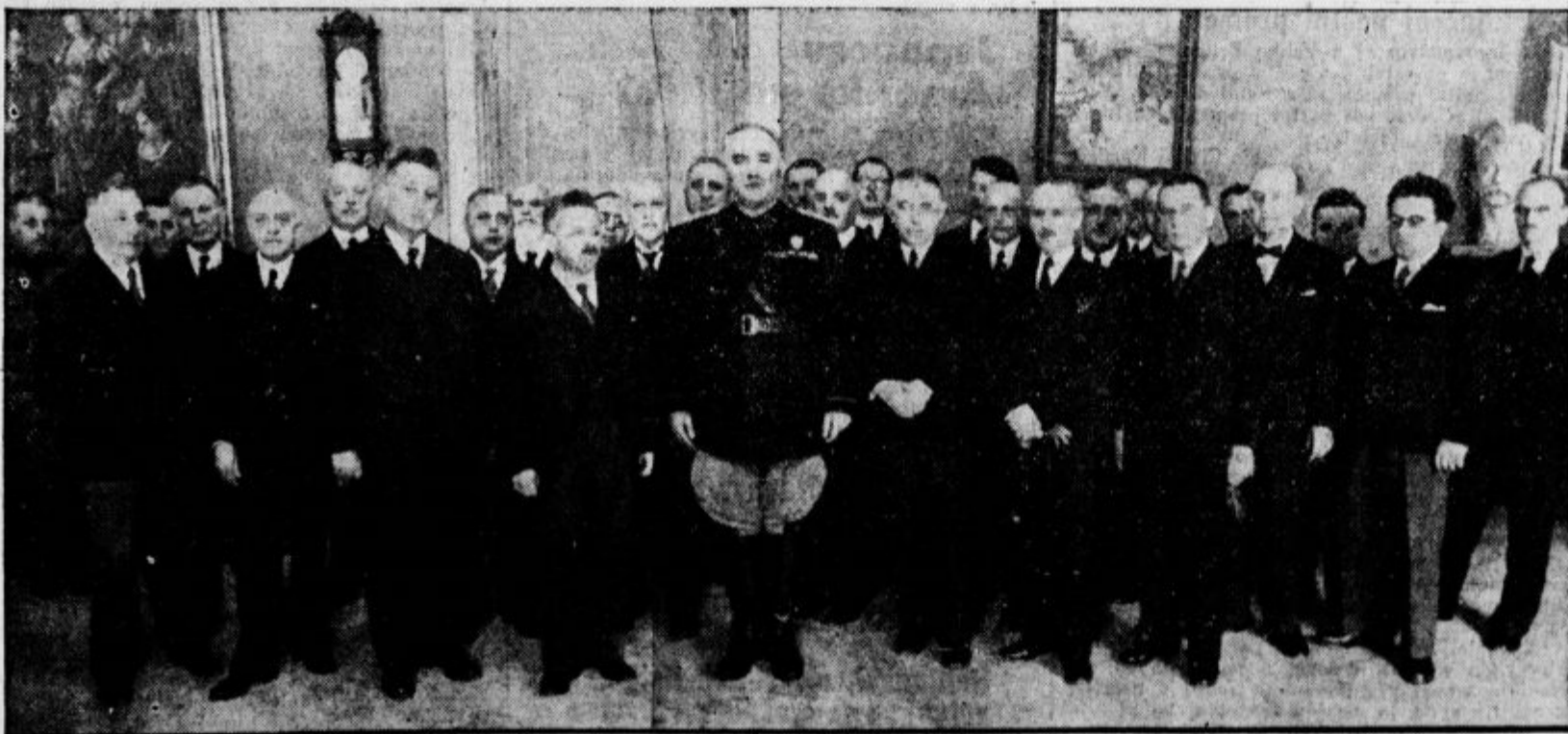
La rappresentanza della popolazione slovena alla quale S. E. l'Alto Commissario Emilio Grazioli, il 3 maggio, ha letto solennemente il Decreto Reale sull'annessione dei territori sloveni occupati dalle Forze Armate Italiane al Regno d'Italia — Predstavnštvo slovenske prebivalstva, kateremu je 3. maja Eksk. Visoki Komisar gospod Emilio Grazioli slovesno prečital akt o priključitvi po Italijanski Oboroženi Sili zasedenega slovenskega ozemlja h Kraljevini Italiji.

Praga, 10. maja. Bratislavská policija je izdala odredbo, da je prepovedano vsem Judom pojaviti se bodisi na ulicah slovaške prestolnice Bratislave, bodisi na katerem koli javnem prostoru v času od 20 zvečer do 5 zjutraj. Judje se tudi ne smejo zbirati v večjih skupinah v javnih ali zasebnih krajih.