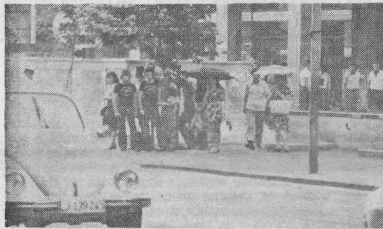
»Dežnik je za dež!« boste rekli. Tistih nekaž kapljic, ki pade v poletnem obdobju res ni vredno omembe. Zato pa je dežnik kar se le da pripraven kot sončnik.