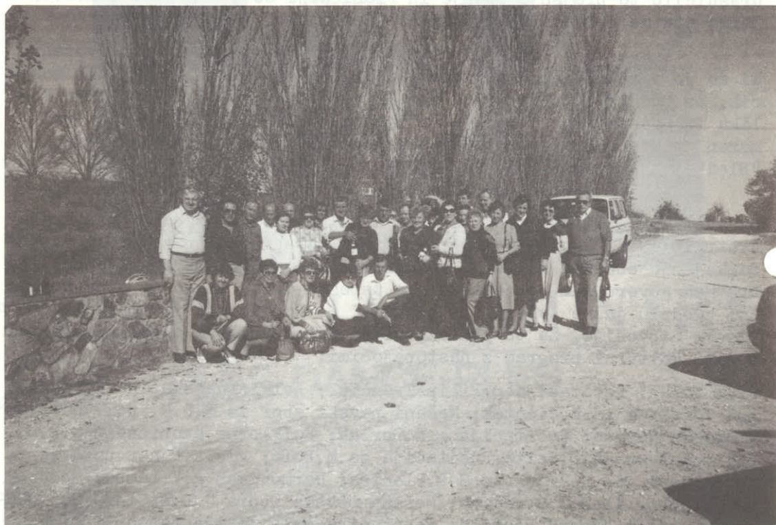
Planičarji v Barossa Valley.