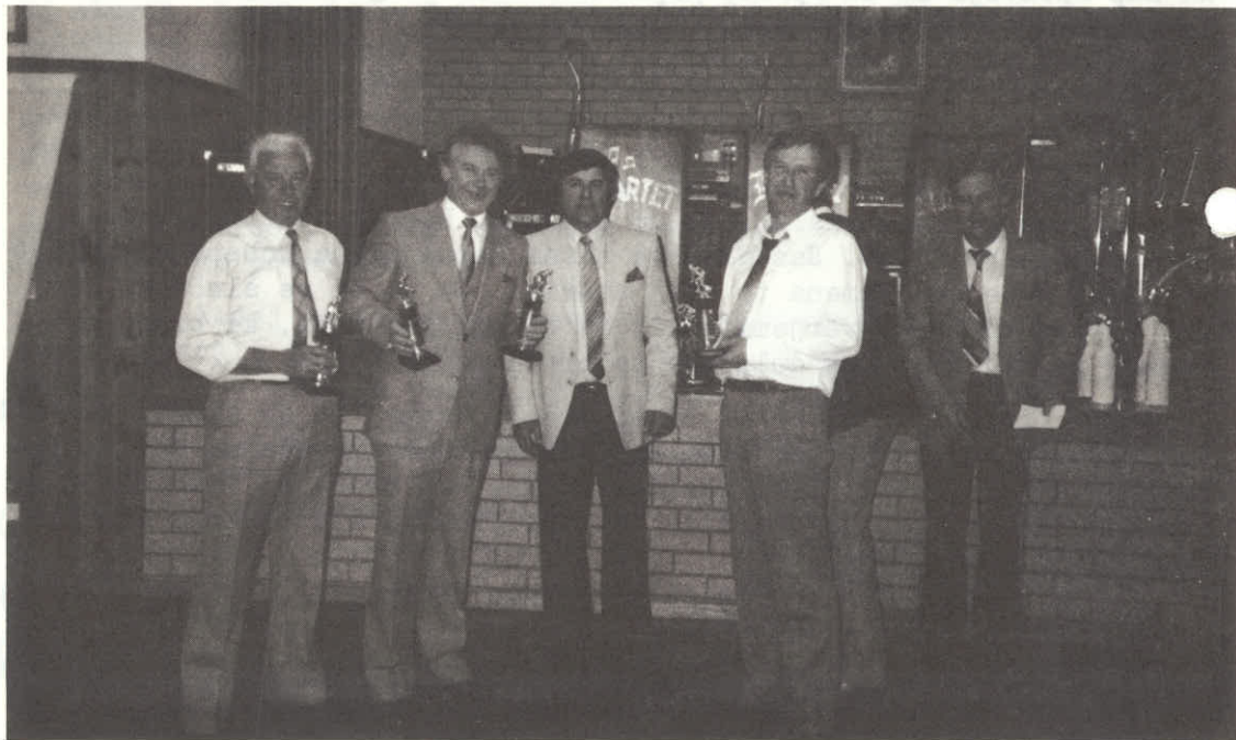
V Geelongu trojka Planice