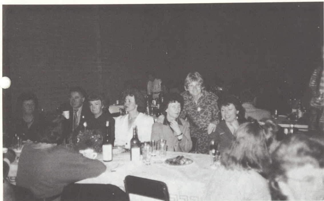
Nekaj veselih obrazov v klubu Adelaide