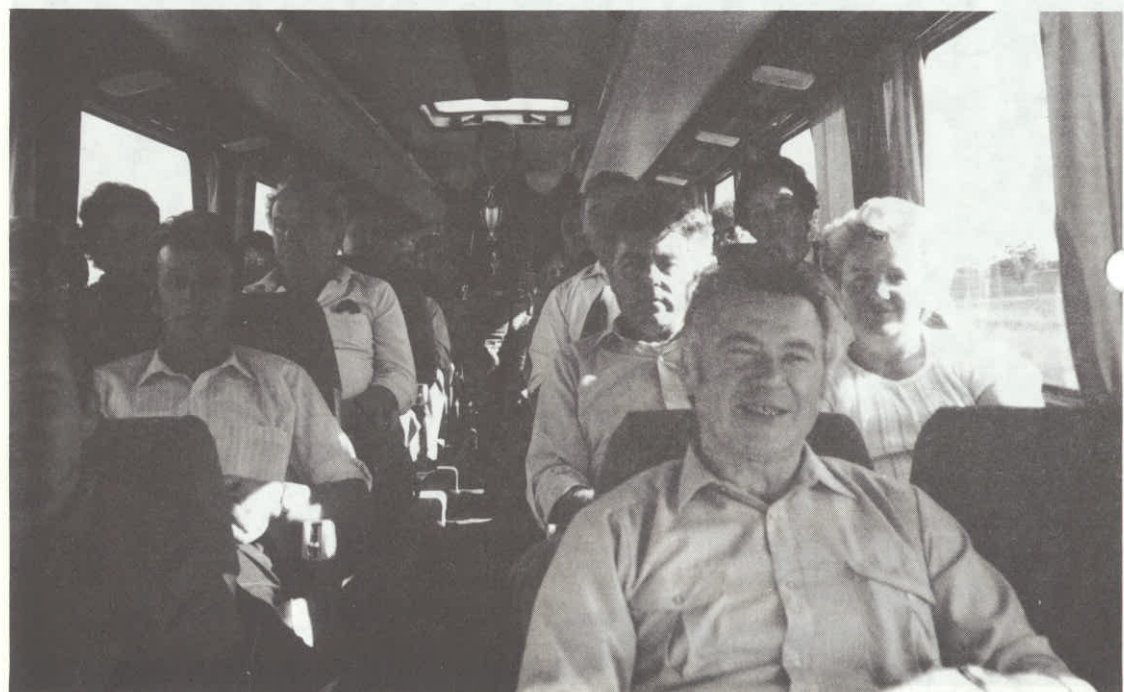
Povratek iz Adelaide na autobusu.