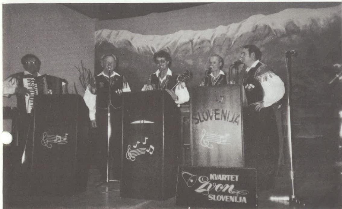
Kvartet „Zvon“ in Ansamble „Kristal“ v Adelaidu.