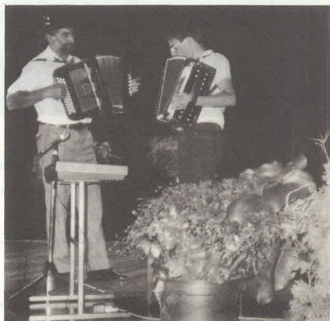
Nekaj lepih posnetkov iz materinske proslave.