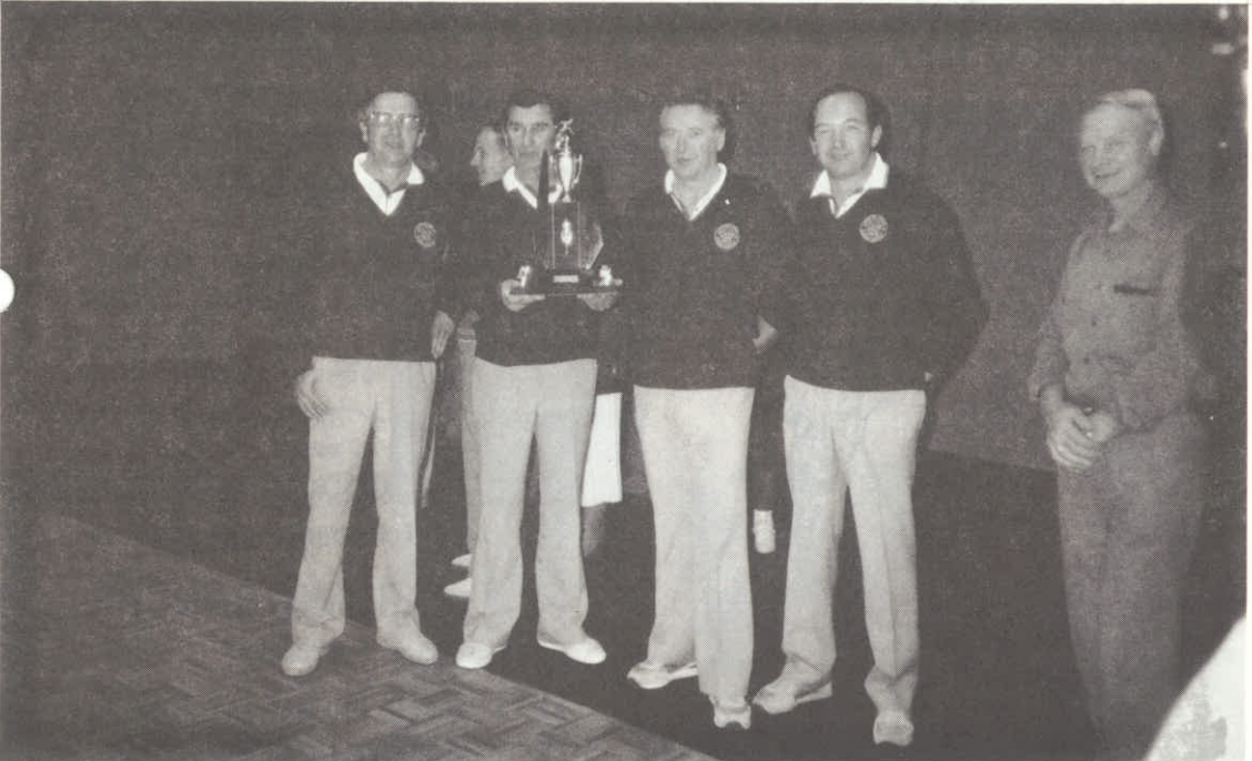
Veseli Planičarji z lepo trofejo.