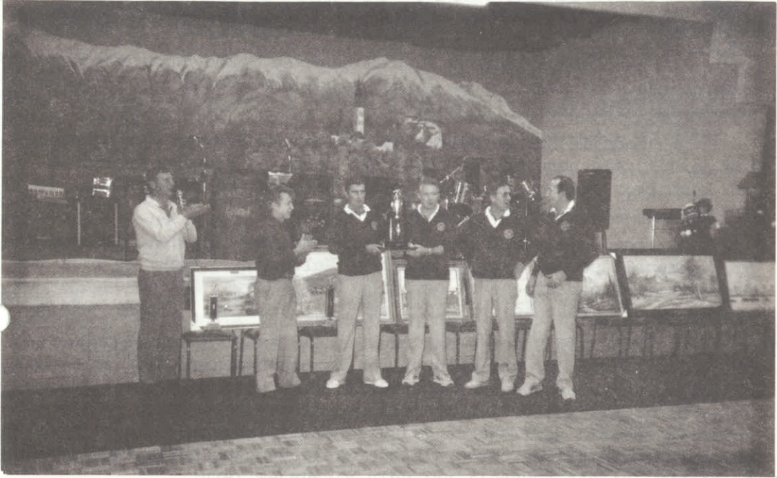
Balinarji Planice so v Adelaidi osvojili 1 mesto.