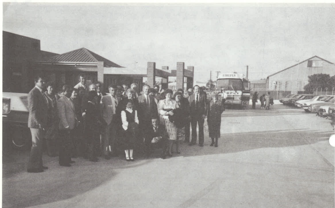
Planičarji izpred kluba Adelaide.