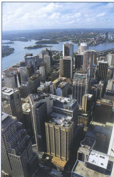
Slika 4: Pogled iz ptičje perspektive na množico nebotičnikov v poslovnem središču. V ozadju vidimo razčlenjeno obalo zaliva Port Jackson, kjer je nastal severni del Sydneya.

nih in svetovljanskih mest na svetu. V njem je registriranih 180 narodov, ki govorijo 140 različnih jezikov. Tako kot druga avstralska mesta je namreč v zadnjih desetletjih sprejel številne priseljence iz južne Evrope in jugovzhodne Azije. Med tistimi iz južne Evrope so bili najpogostejši Italijani in Grki, seveda pa so prihajali tudi iz drugih evropskih držav. Med njimi so relativno dobro zastopani tudi narodi nekdanje Jugoslavije, vključno s Slovenci. Razmeroma močni sta hrvaška in makedonska skupnost. Priseljevanje Azičev so začeli dovoljevati šele po letu 1960. Med azijskimi priseljenji so tudi begunci iz Libanona in Vietnama. Zelo pomembno in številčno skupnost tvorijo Kitajci, ki imajo sicer posebno četrto, vendar jih lahko srečamo v najrazličnejših delih mesta. Nekatera od notranjih predmestij imajo izrazitejšo italijansko ali