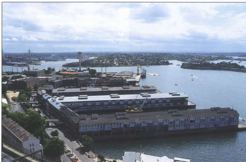
Slika 6: Del pristaniškega kompleksa na južni obali zaliva Port Jackson (foto: Jurij Senegačnik).

obiskovalca. Razprostira se na gričkih, ki obkrožajo zaliv Port Jackson. Čez zaliv se vzpenja znameniti pristaniški most, s katerega lahko uživamo verjetno najlepši pogled na samo mesto. V neposredni bližini je na polotoku na južnem bregu glavno poslovno središče z nebotičniki, le streljaj od mostu pa znamenita opera. Čudovit razgled na mesto je tudi s 305 m visokega razglednika (Centrepont Tower), ki dominira nad celotnim poslovnim središčem, in je najvišja zgradba na južni polobli (1, 4).