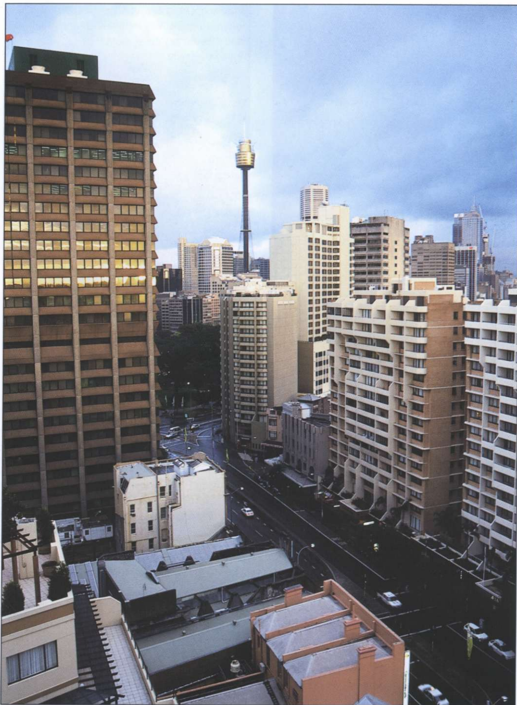
Slika 5: City of Sydney je ožje mestno središče, v katerem stalno živi okoli 26.000 prebivalcev, na delo pa jih sem hodi približno desetkrat toliko.