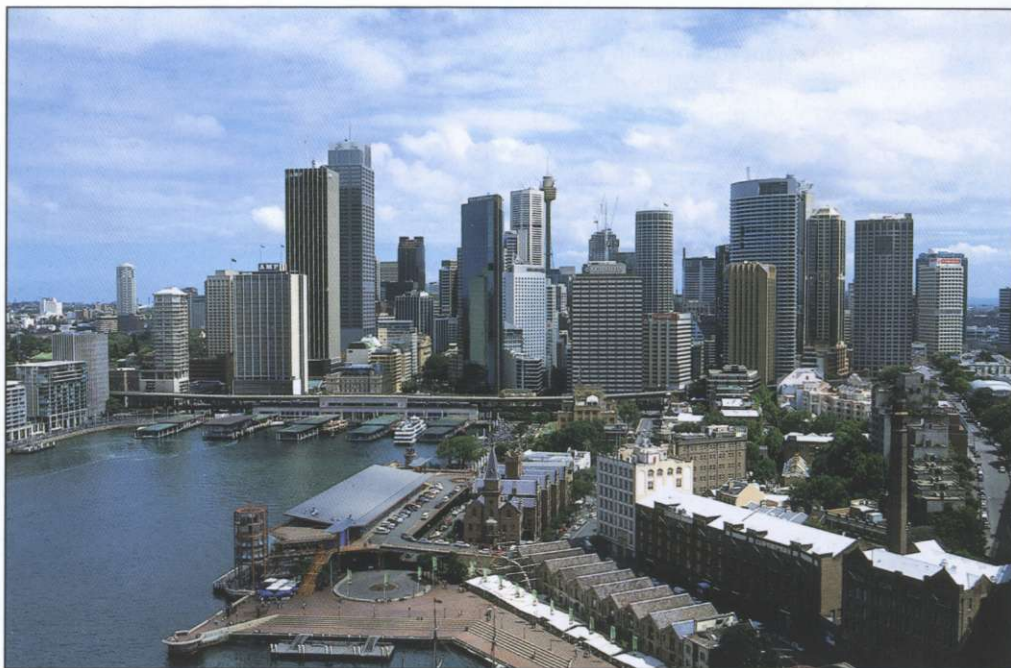
Slika 1: Pogled na poslovno središče s pristaniškega mosta.

Z značilno podobo mesta pa ponavadi ne povezujejo le znamenite opere in pristaniškega mostu, ampak tudi bolj ali manj stalno množico jadrnic in jaht najrazličnejših velikosti v zalivu sredi mesta. Sydney je zato v svetu zaslovel kot mesto jaht. Med značilne mestne športe sodijo tudi nekatere mondene zvrsti, kot sta npr. golf ali pa kriket (1, 4).