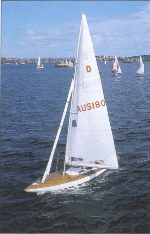
Slika 7: Ena od najbolj prepoznavnih mestnih znamenitosti so številne jadrnice v zalivu Port Jackson, tako rekoč sredi mesta.

pa se z bliščem nebotičnikov glavnega poslovnega središča še zdaleč ne more primerjati. Zato je prav, da glavnemu središču posvetimo nekaj več pozornosti (1, 4).