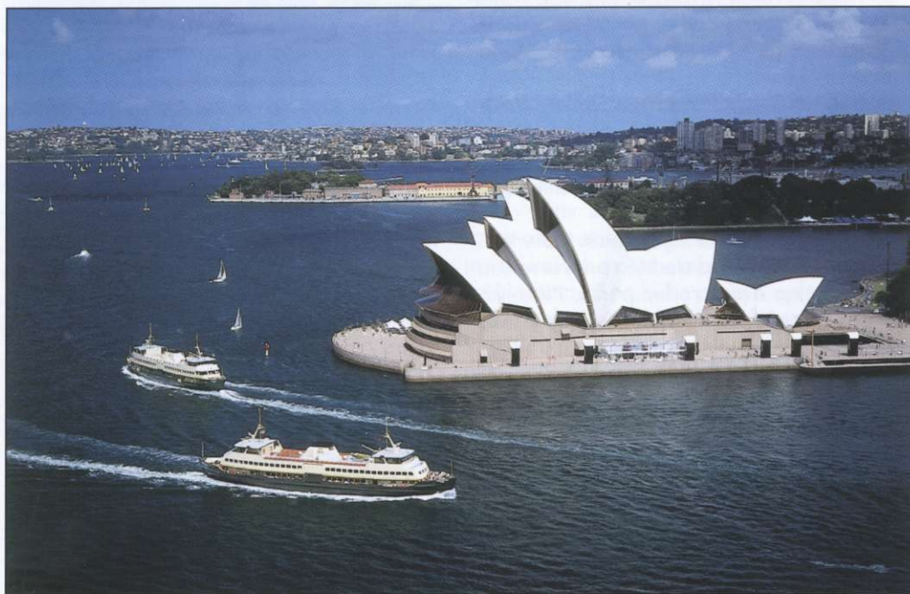
Slika 2: Znamenita opera je v svetu verjetno najbolj znana mestna znamenitost.

Mestno prebivalstvo. Ocenjujejo, da ima danes metropolitansko območje Sydneya danes okoli 4 milijone prebivalcev. V njem živi vsak peti Avstralec. Večina je sicer še vedno potomcev britanskih in irskih priseljencev, vendar je današnji Sydney eno najbolj multikulturno