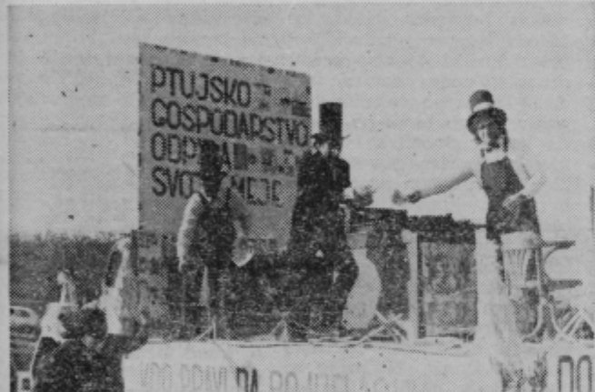
Vedno prisoten problem denarja v ptujski občini je rešila ptujška tiskarna, ki ga je natisnila na kilograme in ga delila na karnevalu.

je deseto organizirano kurentovanje minulo nedeljo v Ptujju uspelo.