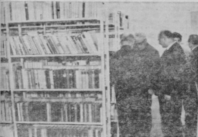
Profesorji ptujске gimnazije in nekateri ptujski kulturni delavci med bogato zbirko knjig