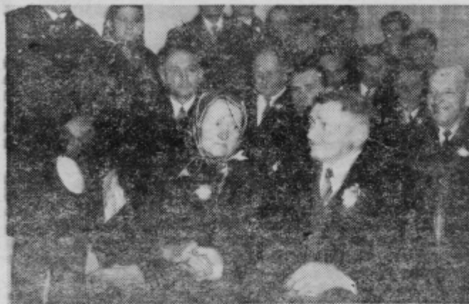
Po 50 letih sta si zopet čvrsto stisnila desnici

Nevesta Uršula pa mi je dejala, da bi bilo veliko boljše, ko bi ne bilo vojske vmes in kako ji ne bi pritrudil? Dolgo si nista mogla pomagati po požaru, ki jima je leta 1935 upepelil domačijo. Veliko ust je bilo prihiši, sosedje so takrat hoteli otroke k sebi, pa nihče ni hotel od ata in mame. Skupaj so delili veliko hudega, pa tudi vese-