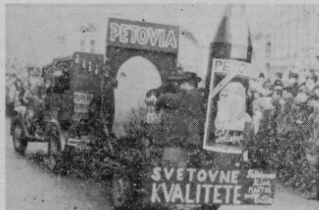
V spremstvu bradatih mož je Petovia vozila svoj pelinkovec, ki je prejel več zlatih odličij na vinskih razstavah

V karnevalski povorki so nastopila tudi ptujška podjetja (žal ne vsa), ki so temu primerno opremila tovornjake in druga vozila. Avto »Petovia« je peljal veliko steklenico pelinkovca. Dragoceno tekočino, ki že več let dobiva najvišja priznanja, so spremljali bradati spremljevalci. Jugoslovanske cene »na