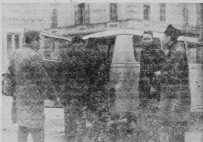
Udeleženci bistriškega Kemocida imajo svoj delokrog po vsej Sloveniji. To pot smo jih »ujeli« pred pričetkom akcije.

Imajo tudi stalne poslovne stike v tujini, kjer se seznanjajo z najnovejšimi dosežki, ve-