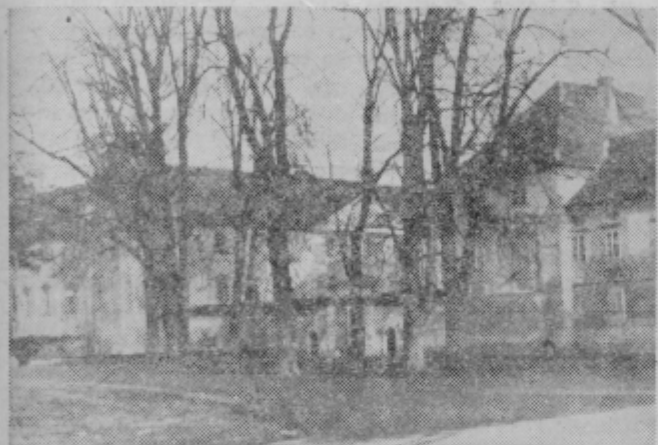
Grad v Slovenski Bistrici

ditev bom v nadaljevanju podkrepil z nekaterimi dokazi.