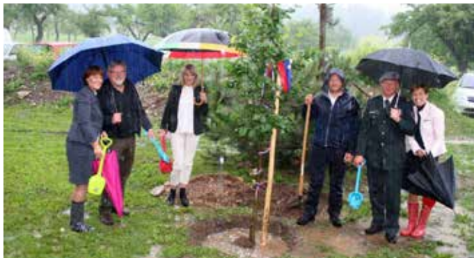
Zasaditev lipe prijateljstva