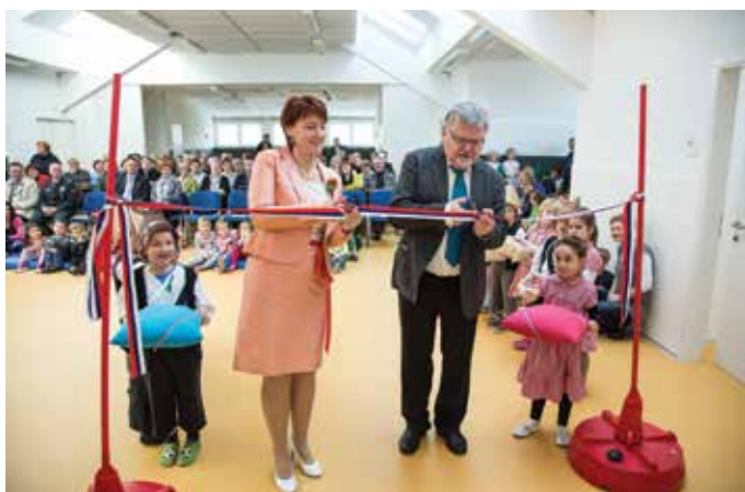
Otvoritev vrtca (himna, prerez traku)

Slavnostno, pred dnevom državnosti, smo na igrišču zasadili lipo: vrtec, občina, vojniki in šola. Naj lepo uspeva in raste, v spomin na odlično sodelovalno leto, na dobro opravljeno delo, na vse izzive, ki smo jih skupno reševali, in posledično neprecenljive izkušnje in spomine, ki smo jih doživeli in živeli. Naj raste vzravnano in ponosno v opomin, da so veliki dosežki možni, če si ljudje pomagamo, podamo roke in stopimo skupaj.