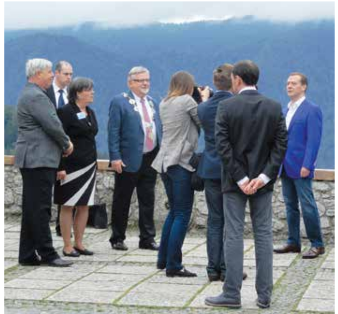
Predsednik ruske vlade (v modrem desno) na Blejskem gradu.