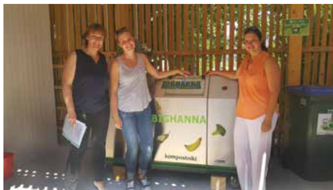
»Prvi obrok« Big Hanne in prevzem

Naša zadnja novost je kompostnik Big Hanna. V poletnem času se privajamo na uporabo in se že veselimo zmanjšanja odvoza (prihranek) in predelave ostankov hrane v koristen kompost, ki ga vrnemo naravi. To bo odlična dopolnitev, poleg obdelovanja gredic in učenja odgovornega načina življenja in odnosa do narave še nadgradnja učenja spoštovanja in odnosa do hrane.