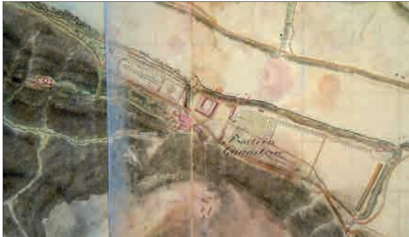
Slika 1: Detajl iz Žerovčevega načrta reke Save iz okoli leta 1807, kjer je dobro vidna baročna vrtna zasnova (ARS, SI AS 1068, 2/197–198).