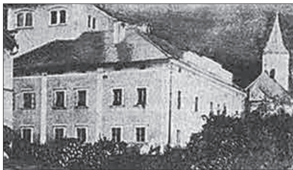
Slika 6: Fotografija grajskega kompleksa Boštanj (Simončič in Žibert, Bogastvo župnije Boštanj, str. 24).