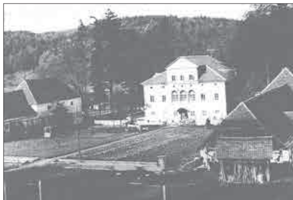
Slika 12: Fotografija dvorca Impoljca in pridelovalnega vrta iz leta 1960 (Piltaver, Cizelj Kozole in Kolar, Impoljca, str. 7).

jami (ki omogočajo bivanje približno 28 osebam), v objektu pa je tudi večnamenski skupni dnevni prostor. Pred izgradnjo novega doma je stavba dvorca vsebovala celotno infrastrukturo doma za ostarele. V pritličju dvorca so bili ambulanta oz. ordinacija, delovni prostor za sestre, prostor za zdravlila, prostor za sterilizacijo, soba za obiske, kuhinja, garderoba za zaposlene, kurilnica in tri velike bolniške sobe z osrednjim prostorom, ki je bil hkrati tudi jedilnica. V prvem in drugem nadstropju pa so imeli bolniške sobe z eno kopalnico in čajno kuhinjo. Vrt ob dvorcu je imel vse bolj pridelovalno rabo (slika 12), čeprav lahko opazimo še nekaj okrasnih prvin tik ob dvorcu, kot jih prikazuje razglednica, poslana leta 1924 (slika 11). V šestdesetih letih so obiskovalci kompleksa še prepoznali grajski vrt, obrasel z živo mejo ter mogočnimi bukvami in kostanji. Leta 1987 je bilo mogoče videti ohranjeno mrežo poti v parterju na južni strani, osmerokotni ribnik v osi pred graščino (čas nastanka slednjega ni jasen) in brez vidnega koncepta zasajeno drevnino na vmesni površini vrta (ki so jo zasadili po drugi svetovni vojni), medtem ko severni parter tedaj ni bil več ohranjen. 45