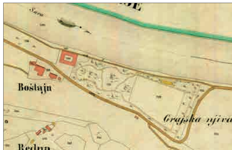
Slika 4: Detajl iz reambulančnega katastra iz leta 1867, k. o. Boštanj (ARS, SI AS 181/N/N247/g/C03).