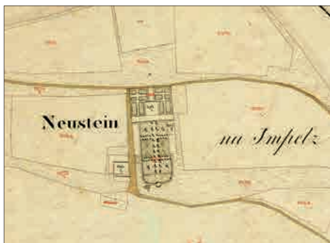
Slika 8: Detajl katastra iz leta 1825, kjer je obranjena zasnova okolice dvorca Impoljca (ARS, SI AS 181/N/N23/g/C01).