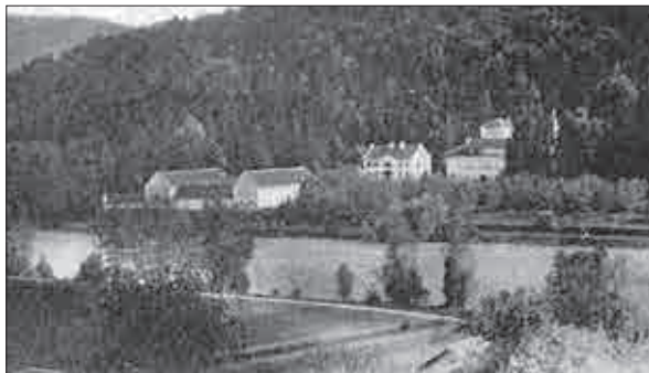
Slika 5: Razglednica Boštanja (Polšak in Železnik, Gradovi, str. 84).

Grajski kompleks Boštanj je obstal dolgo obdobje do druge svetovne vojne (sliki 5, 6). Med vojno je bil požgan in uničen, ostanki pa uporabljeni kot gradbeni material (ostanke dvorca so pred leti odkopali in naredili načrte odkopanega zidovja). Poškodovani