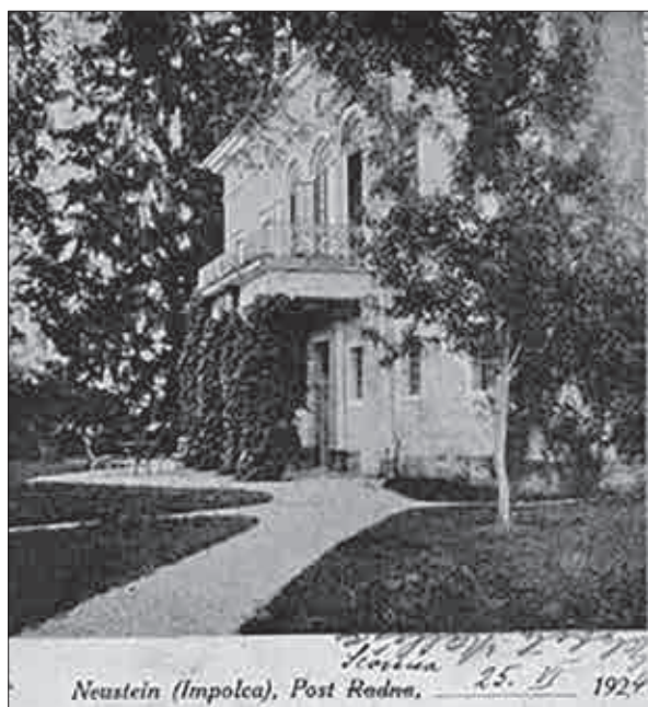
Slika 11: Fotografija oz. razglednica dvorca Impoljca, poslana 25. junija 1924 (hrani: Knjižnica Mirana Jarca, Novo mesto).

V 20. stoletju je dvorec ohranil svojo podobo, a je postal del večjega, novejšega kompleksa z novo funkcijo. V stavbi je dom za ostarele, ki so ga leta 1990 razširili oz. zgradili novega, v njem pa je prostor za 280 stanovalcev. Stari objekt dvorca je še ostal – danes so v njem urejena stanovanja apartmajskega tipa z bivalnim in s spalnim delom, kuhinjo in sanitari-