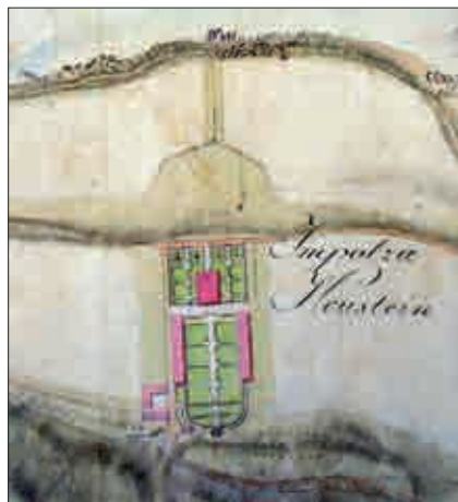
Slika 7: Detajl iz Žerovčevega načrta reke Save iz okoli leta 1807 s prikazom grajskega kompleksa Impoljca (ARS, SI AS 1068, 2/35).