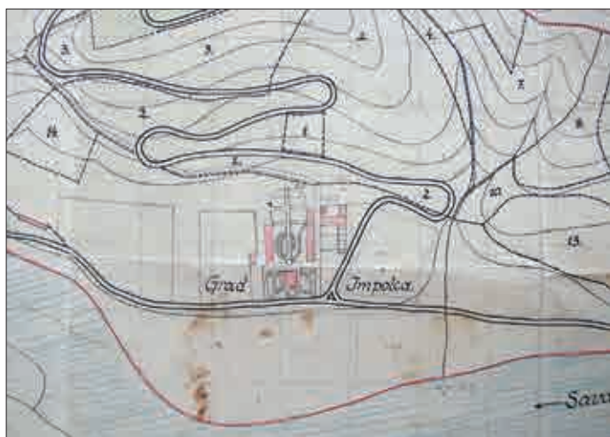
Slika 10: Detajl načrta iz leta 1900, kjer je vidna že nekoliko drugačna vrtna zasnova (in nekaj več gospodarskih objektov) dvorca Impoljca (NUK G Z 282.6/94).