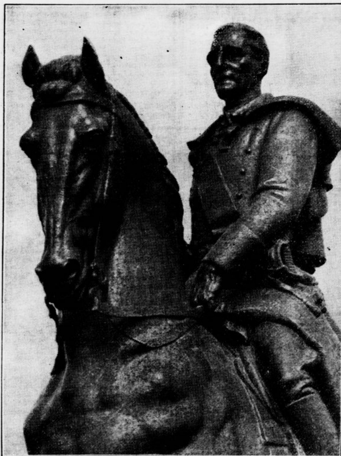
Ko je padla zavesa...

Zavesa je padla. V sijajo zlatega roj- stnega dne mladega kralja stoji pred nami za vse čase mogočni lik nesmrtnega Viteš- kega kralja.