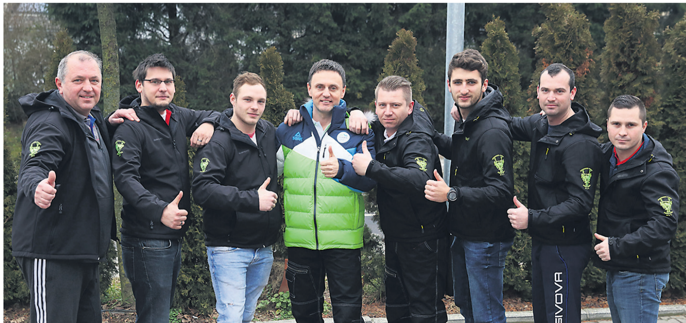
Člani ptujске skupine Kurenti 311, ki potuje v Pjongčang.