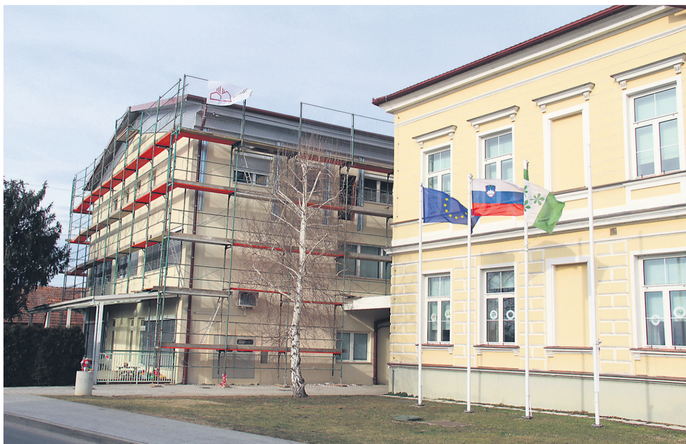
Na OŠ Cirkovce so že popravili streho, ki jo je decembra poškodoval orkanski veter.