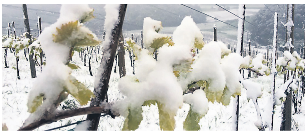
Kasnejše znižanje temperatur lahko rastline bistveno bolj prizadene, kot bi jih sicer.

nejše na spomladansko pozebo. V rastlinah se začnejo procesi pretvarjanja hranilnih snovi iz ogljikovih hidratov v sladkorje, ki pa so bistveno manj odporni na nizke temperature. Ti procesi tudi kasneje povzročijo hitrejšo odganjanje oces, kar lahko posledično privede do večje nevarnosti spomladanske pozebe. Tople in mile zime povzročajo večjo nevarnost glivičnih bolezni in škodljivcev. Sklenemo lahko, da imajo vremenske razmere, kot smo jim priča to zimo, več negativnih kot pozitivnih posledic in si jih vinogradniki ter sadjarji ne želijo. Je pa prihodnja letina v veliki meri