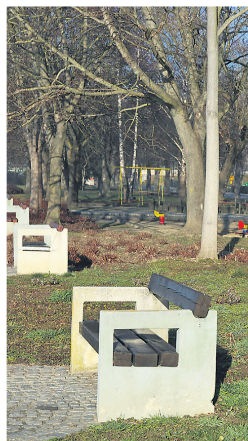
Ker Zavod za varstvo kulturne dediščine Slovenije igrišče, ki se ne uporablja, so podali vlogo za naslednjo

Da bodo kot družbeno odgovorno podjetje financer te investicije