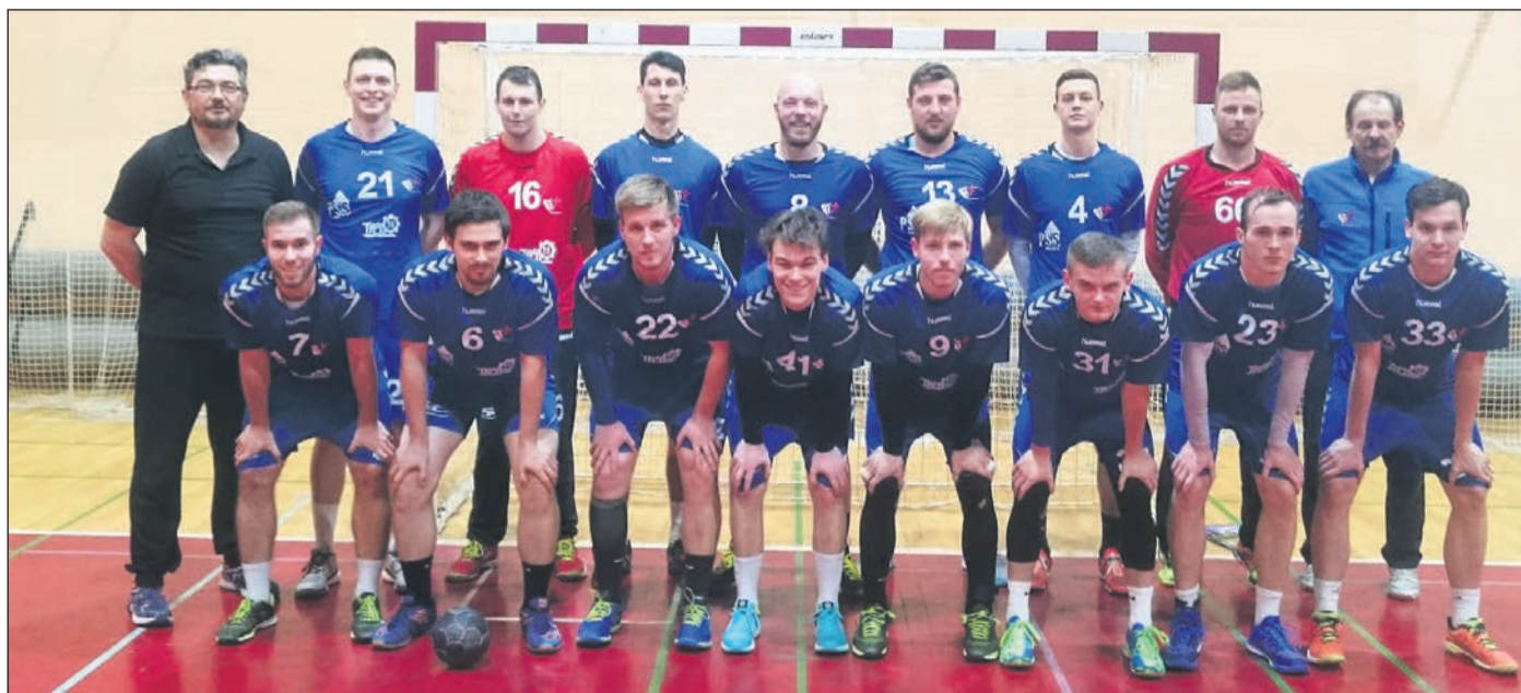
Skupinska slika rokometišev Drave pred srečanjem v Murski Soboti