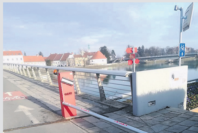
Veriga sicer preprečuje, da bi zapornice spet končale v Dravi, ne pa, da jih snamejo.

Ptuj • Fitnes na prostem bodo financirale Lekarne Ptuj