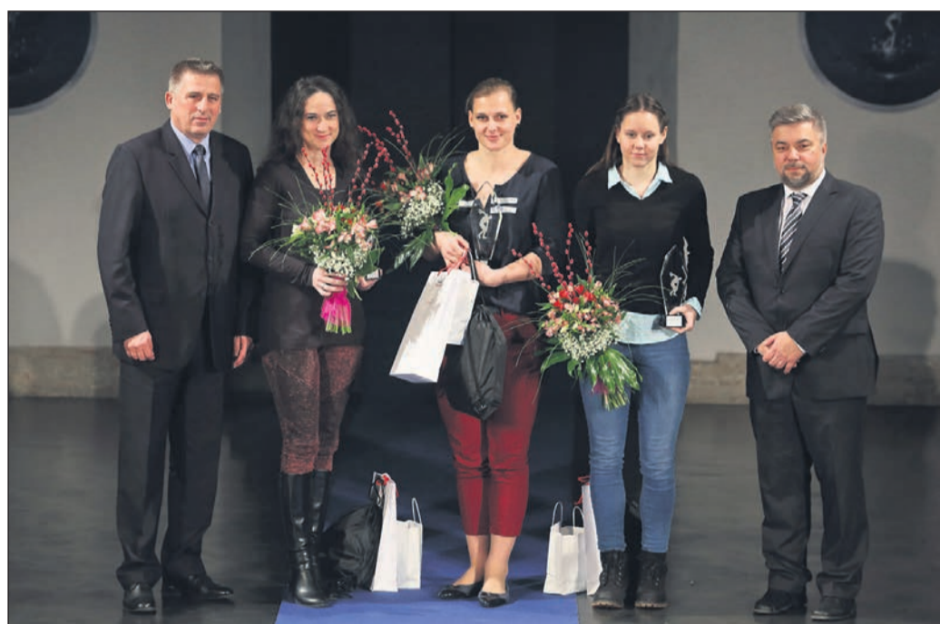
Prejemnice priznanj za najboljše športnice v MO Ptuj v letu 2017