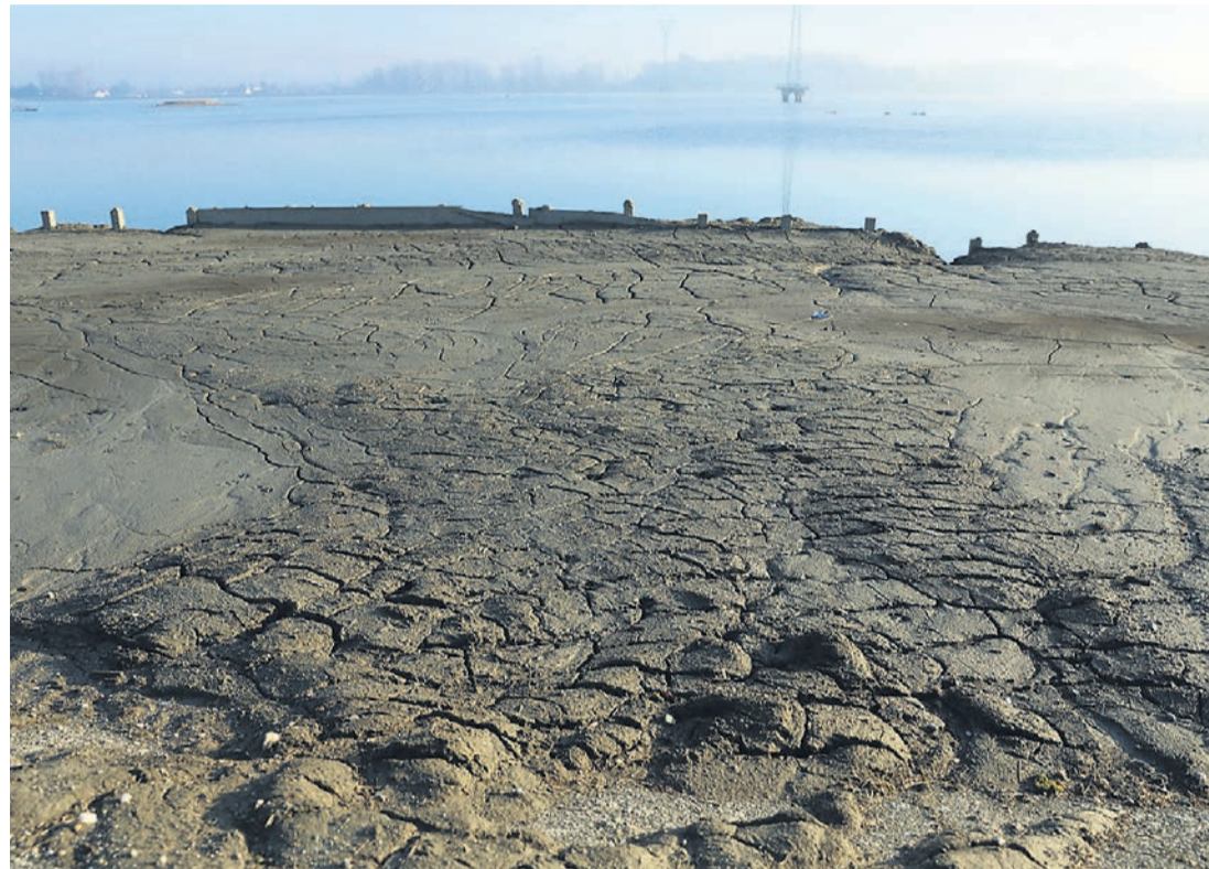
Dela v strugi reke Drave se lahko po navodilih Zavoda RS za varstvo narave izvajajo le od avgusta do novembra.

V DEM so odgovorili, da so v zadnjem desetletju za ekološko sanacijo Drave namenili dobrih 10 milijonov evrov: »V naslednjih letih načrtujemo povečanje sredstev za te namene na