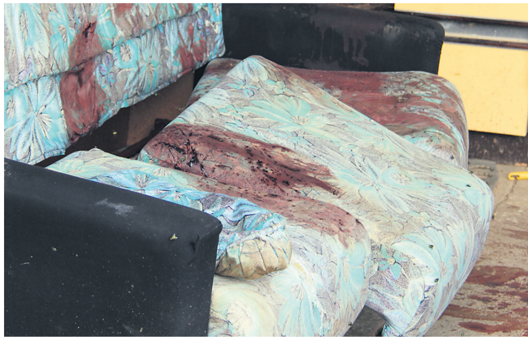
Fotografija je simbolična