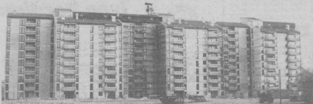
Prva stanovanja v novem bežigraskem naselju BS-2/2 Rapova Jama.