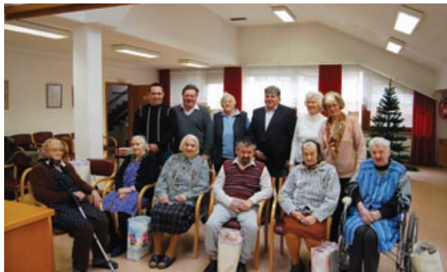
V domu starejših Rakičan