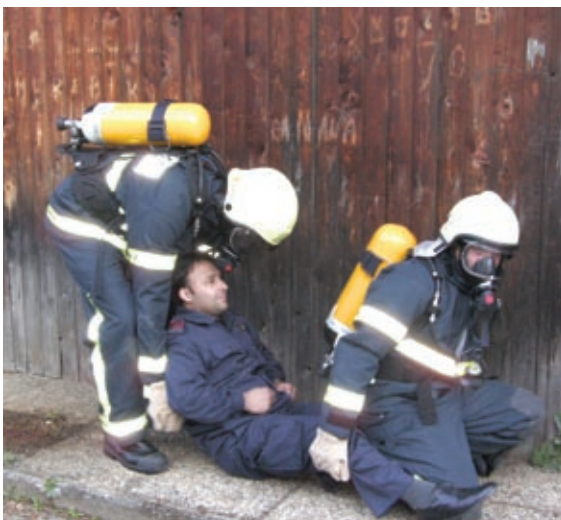
Vaja reševanja osebe