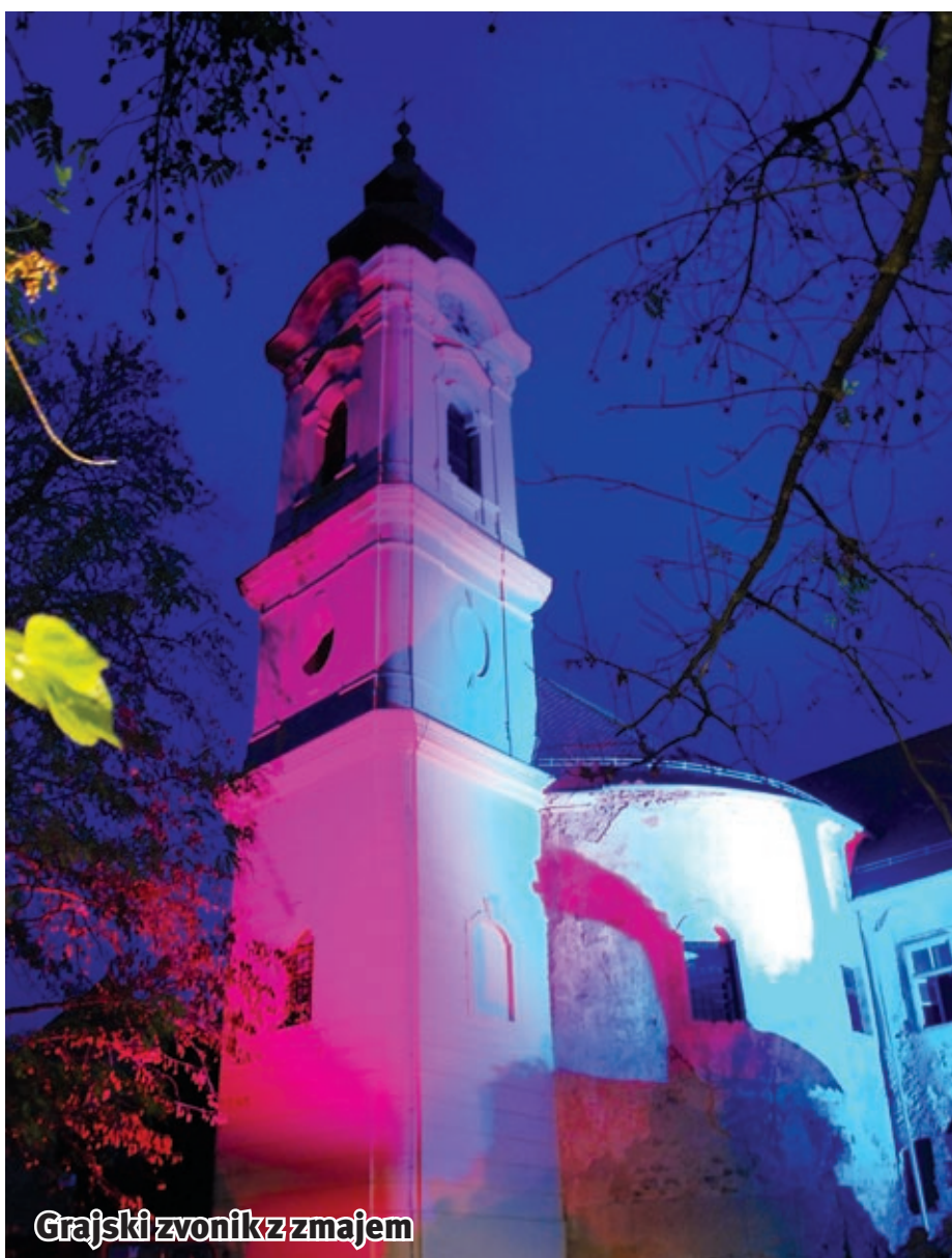
Grajski zvonik z majem