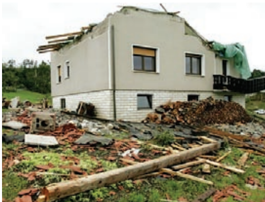
Uničeni domovi po neurju