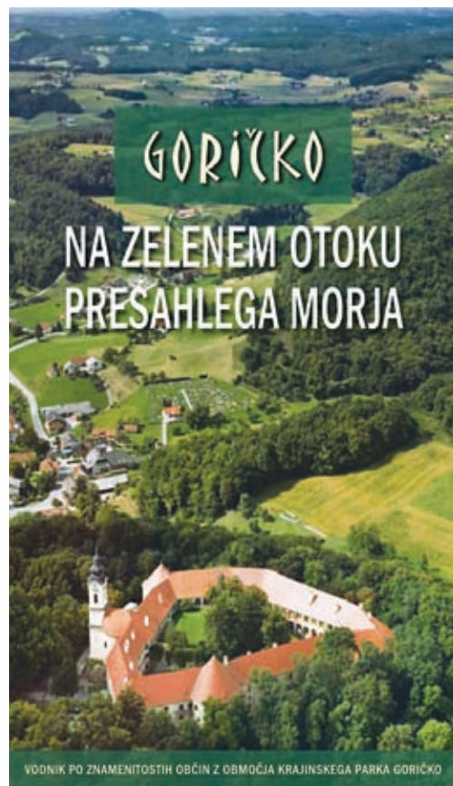
Vodnik po občinah na območju KPG