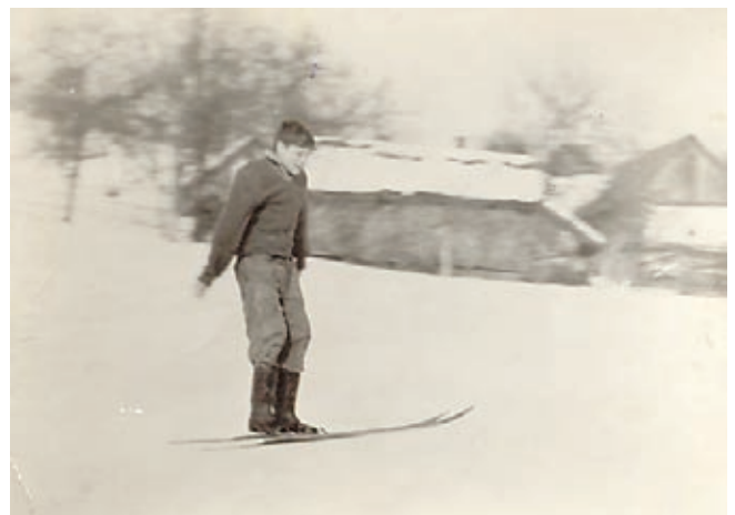
Veselje z doma izdelanimi smučmi (Grad, okrog 1965)

Štirje letni časi - pomlad, poletje, jesen, zima... V vsakem se dogaja kaj zanimivega. Sploh nekoč. Tudi pozimi, ko ni kaj dosti opravil. Nekoč so se pozimi lotili marsikaterih opravil, običajev ter ročnih spretnosti. Eno izmed del je bila tudi izdelava smučī. Včasih je bilo tudi veliko več snega kot danes, zato je bila potreba po smučeh večja in zagotovo tudi težja. Ni bilo izbire, niti možnosti, da bi se po smučī zapeljali v trgovino.