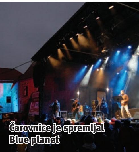
Čarovnice je spremljal Blue planet