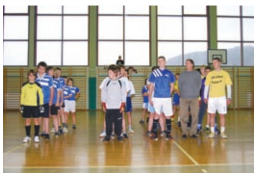
Ekipa nestrpno čakajo na začetek tekmovanja