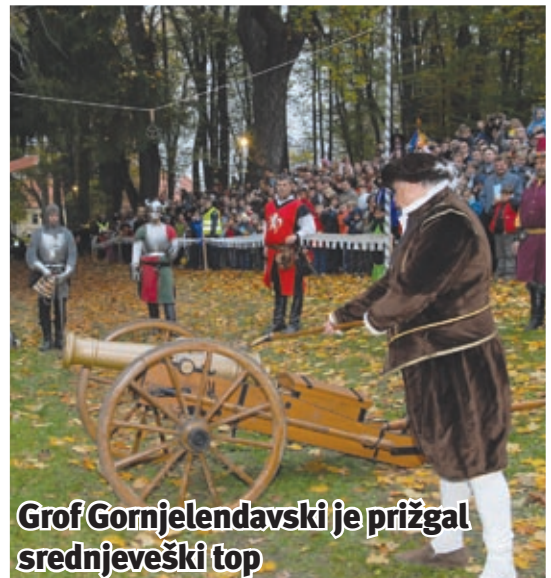
Grof Gornjelendavski je prižgal srednjeveški top