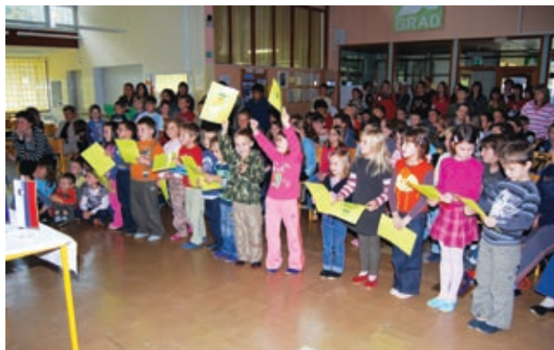
Juhuhu, postali smo člani šolske skupnosti!

Na OŠ Grad smo tudi letos na poseben način obeležili prvi teden v mesecu oktobru, t.i. Teden otroka. Letošnje geslo Nekoga moraš imeti rad nas je popeljalo v razmišljanje, da vsak izmed nas potrebuje nekoga ali nekaj, da lažje prebrodi različne preizkušnje. Na svetovni dan otroka smo priredili krajšo proslavo, kjer so učenci peli, razmišljali, deklamirali ter zaigrali, koga vse lahko imaš rad. Na tej proslavi smo medse sprejeli tudi naše najmlajše, prvošolčke. Da pa so pripravljeni vstopiti med prave šolarje, so morali dokazati s krajšim kvizom in častno prisego. Za nagrado so prejeli veliko torto v obliki knjige. Skozi ves teden se je odvijalo veliko dejavnosti. Učenci so se preizkušali v orientacijskem teku, mlajši učenci so si ogledali film Garfield 2 v Murski Soboti in lutkovno predstavo Prijatelju pomagaj v nesreči v izvedbi Lutkovne sekcije KUD Bubla iz Radencev. Teden otroka smo zaključili s kostanjevim piknikom in šaljivimi igrami na našem šolskem dvorišču.