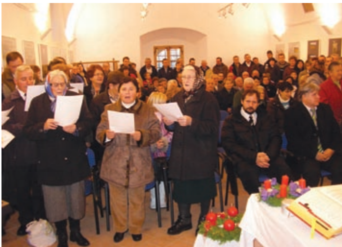
Pri maši na Andrejevo