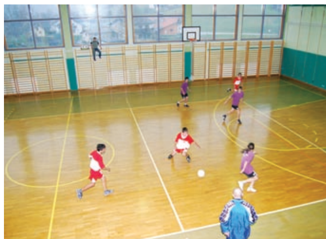
Tekma med OŠ Cankova in OŠ Sveti Jurij