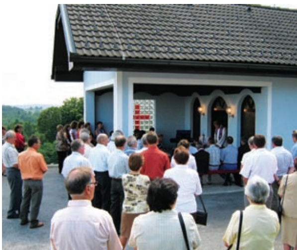
Blagoslovitev vežice