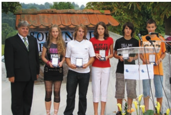
Župan z odličnjaki