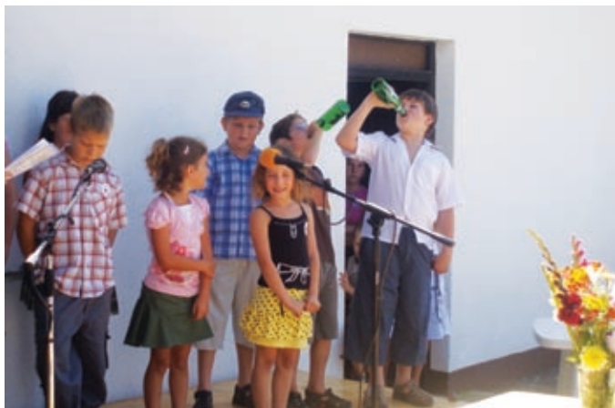
Mladi nadobudneži