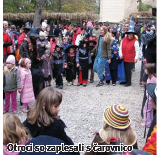
Otroci so zaplesali s čarovnico