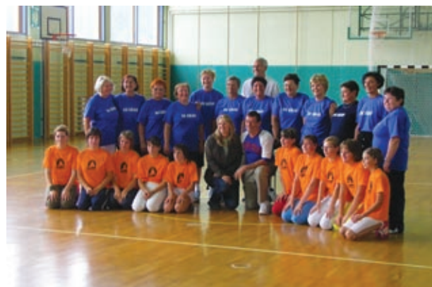
Ekipa slavljenk v modrem