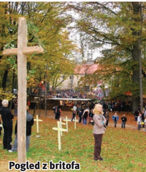
Pogled z britofa