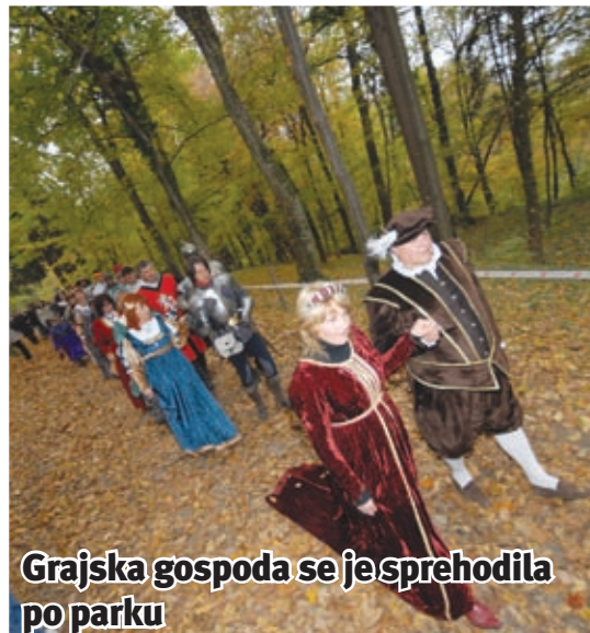
Grajska gospoda se je sprehodila po parku