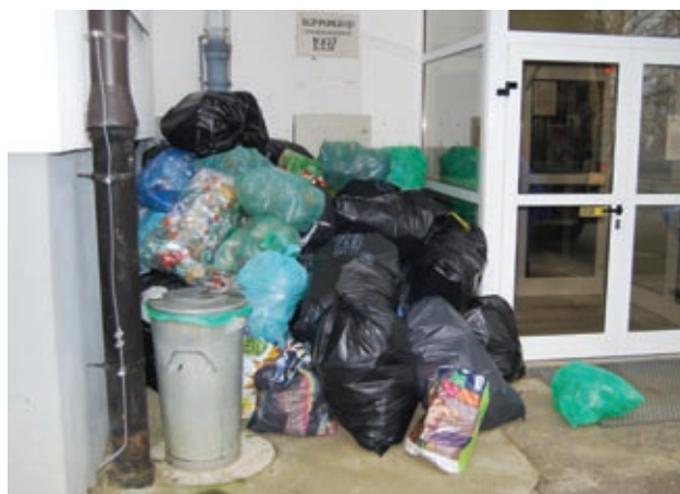
Nabrali smo veliko plastenk, žal jih je še veliko ostalo doma

Na šoli zdaj že drugo leto poteka ločeno zbiranje odpadkov, in sicer plastenk, baterij, mobilnih telefonov, tonerjev, kartuš, trakov. Zaključili smo z jesensko akcijo zbiranja papirja. Zbrali smo 2060 kg papirja. Pri ločenem zbiranju odpadkov nam pomagajo tudi starši in številni občani. S temi akcijami dajemo tudi mi svoj prispevek k ohranjanju narave.