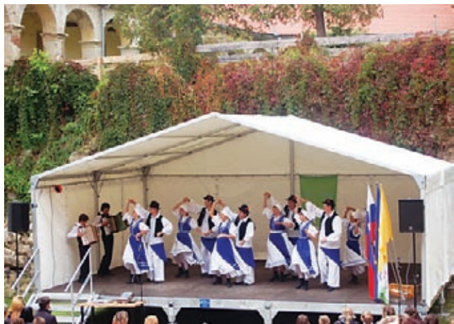
Folklorna skupina iz Porabja