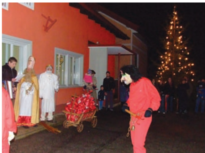
Miklavž z darili v Motovilcih