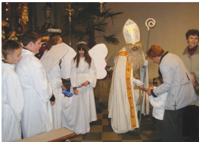
Sv. Miklavž je delil čokoladice