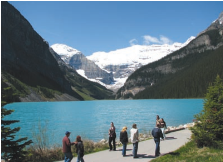
Jezero - Lake Louise