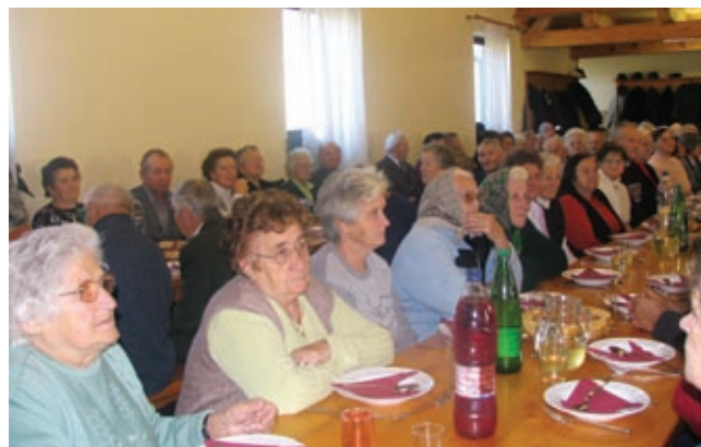
Zbrani starejši občani