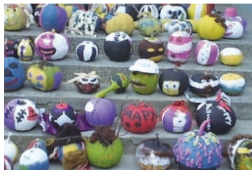
Vidite, da smo se zelo potrudili!

Vsako leto Občina Grad v sodelovanju z društvi prireja tradicionalno prireditve Noč čarovnic. Letos se je ta zvrstila že devetič zapored. Pri tej prireditvi pa pomaga tudi OŠ Grad, in sicer pri pripravi samega ozračja prireditve. Tudi letos smo, tako kot vsako leto, vsi razredi naše šole pomagali okrasiti buče na način, ki je značilen za ta čas. Te buče so nato razstavljene na prireditvi, nekatere pa sodelujejo tudi na izboru za naj bučo.