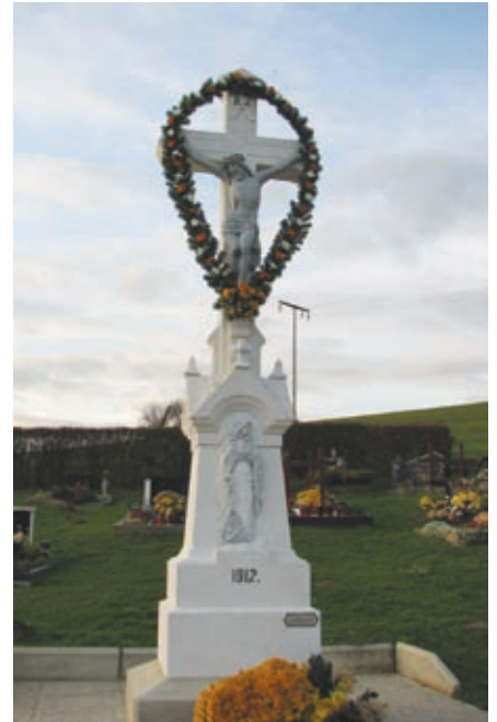
Križ na gračkem pokopališču