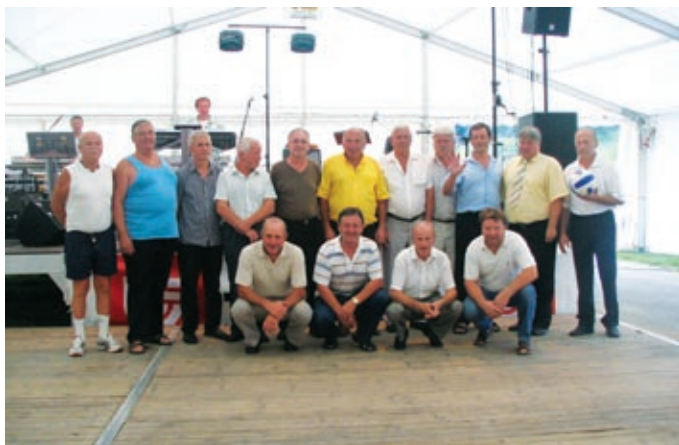
Nekdanji nogometaši NK Grad