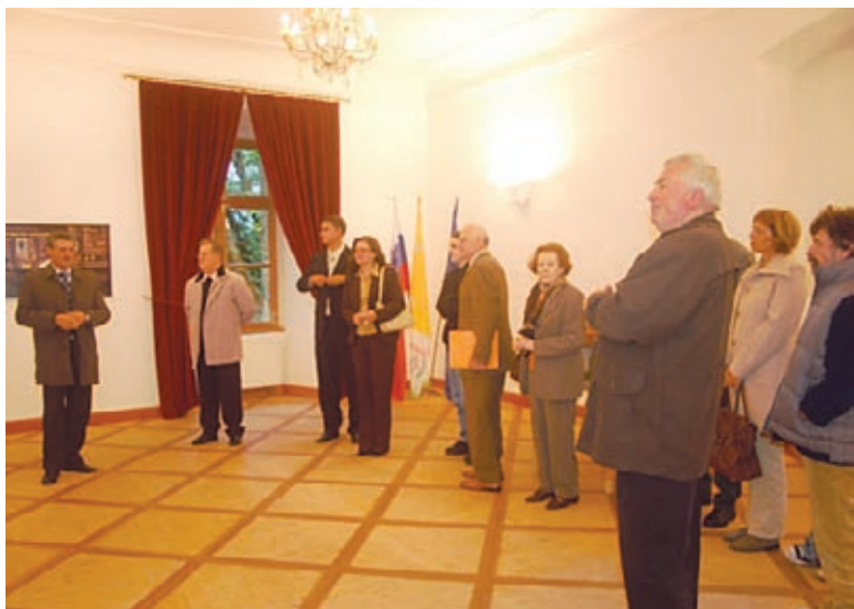
Otvoritev razstave Vsem Slovencem