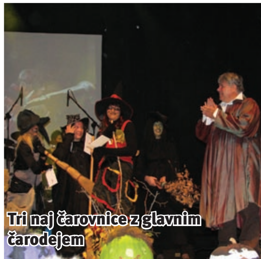
Tri naj čarovnice z glavnim čarodejem