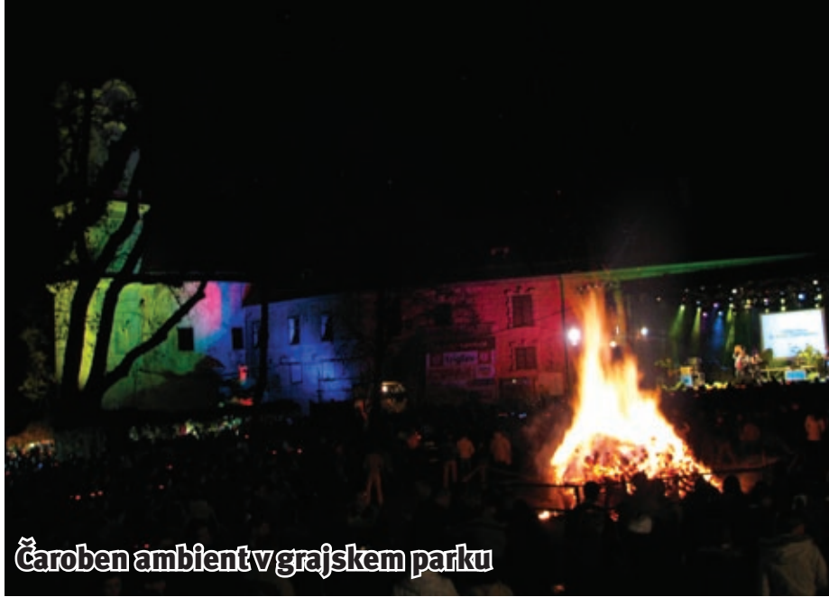
Čaroben ambient v grajskem parku