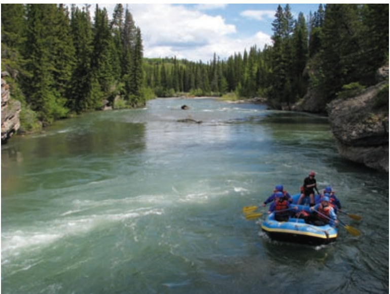
Rafting na reki Bow

se tudi mimo ledenika Athabasca Glacier, ki se je v zadnjih 125 letih zmanjšal za 1,5 km. Ledenik je dolg približno 6 km, ima površino 6 km 2 , debelina ledu pa je med 90 in 300 m. Turiste na ledenik vozijo posebna vozila in občutek, stati na takšni gmoti ledu, je res nepopisen. Tukaj se potem začne narodni park Banff, ki se razprostira na 6641 km 2 . Vožnja proti kraju Banffu postreže še s številnimi znamenitostmi, kot so soteska Mistaya Canyon, prelaz Bow Pass, ki je z 2088 m najvišje ležeči prelaz v teh narodnih parkih in ledenik Crowfoot Glacier, ki je ime dobil po sračji nogi.