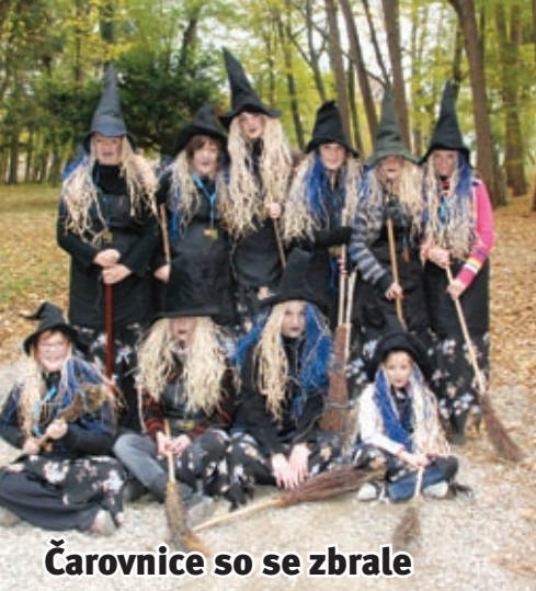
Čarovnice so se zbrale