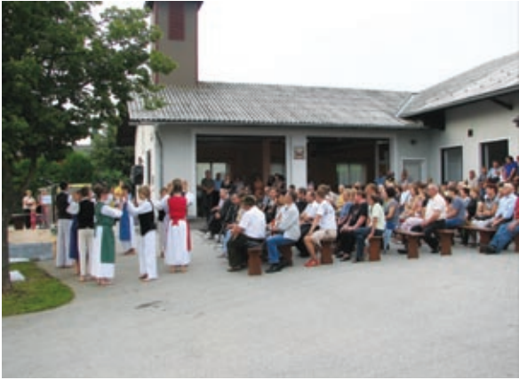
Folklor je popestrila program