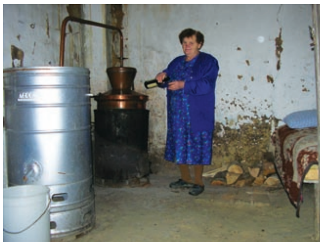
Frida Grah od Grada ob kotlih za žganjekuho

ob »malem riftaru«. Pelo se ni veliko, razen takrat, ko je kdo malo bolj pogledal v kozarec. Kar se tiče prehrane, so si nekateri prinesli kaj s sabo, drugi so šli domov na večerjo, na koncu pa so zmeraj dobili domače pogače. Veljalo je tudi, da je vsak osmi liter žganja bil gospodarjev. Poleg naše kmetije se je na veliko žgalo še pri lastniku Beli Dervariču, zagotovo pa tudi drugod v vasi, saj je vsaka hiša slovela po svoji palinki.«