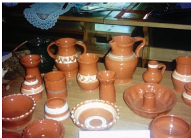
Klementina Lesic Lončeni izdelki

Manjša skupina vaščanov iz Kruplivnika je kasneje izkoristila lepo septembrsko nedeljo za druženje in pohod po gozdnici učni poti Fuks Grabi.