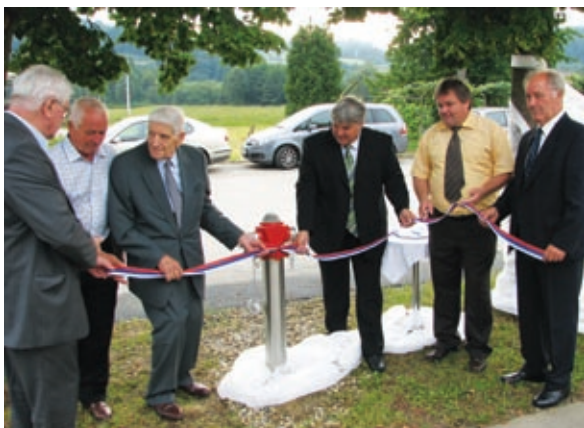
Otvoritev vodovoda