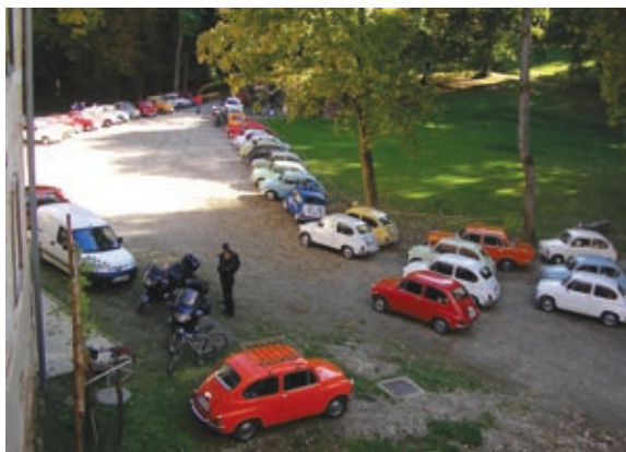
Zbrani fičeki ob gradu