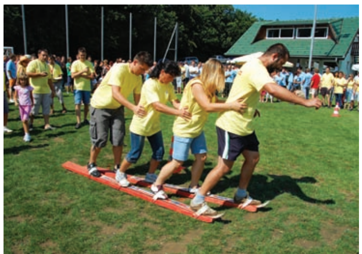
Smučanje na travi