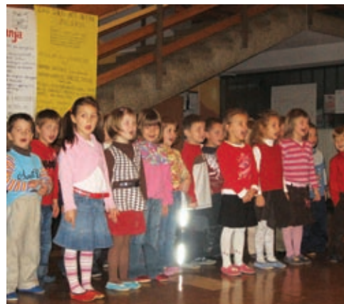
Otroci so nastopili pred babicami in dedki

Mesec november je mesec, ko se spominimo naših starejših občanov. V tem mesecu po vaseh potekajo razne prireditve, ki so namenjene prav njim. Otroci in vzgojno osebje iz vrtca pri OŠ Grad pa smo 25. novembra medse povabili naše dedke in babice. Odziv je bil zelo dober, saj so se proslave udeležili v zelo velikem številu. Na to prireditev smo se pripravljali že ves mesec, saj so otroci pridno vadili. Vse tri skupine so se predstavile s pestrim programom. Otroci so prepevali, deklamirali, plesali in nastopali z lutkami. Poželi so bučen aplavz, kar je bilo tudi njim v veliko zadovoljstvo. Po proslavi je sledilo družabno srečanje po skupinah. Da pa ne bi naši gostje odšli praznih rok, smo jih obdarovali s skromnimi darili, ki smo jih izdelali v vrtcu.