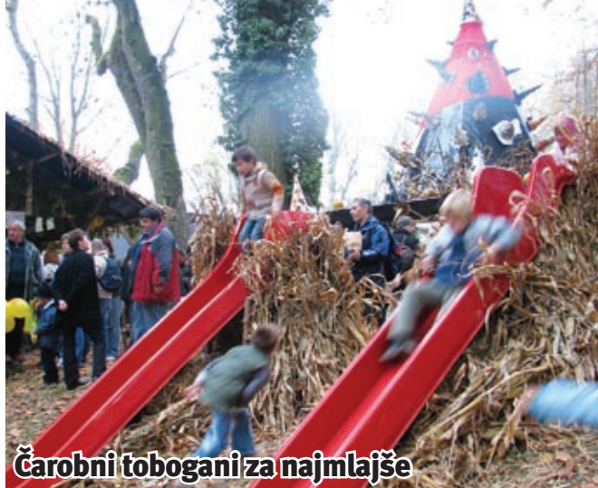
Čarobni tobogani za najmlajše