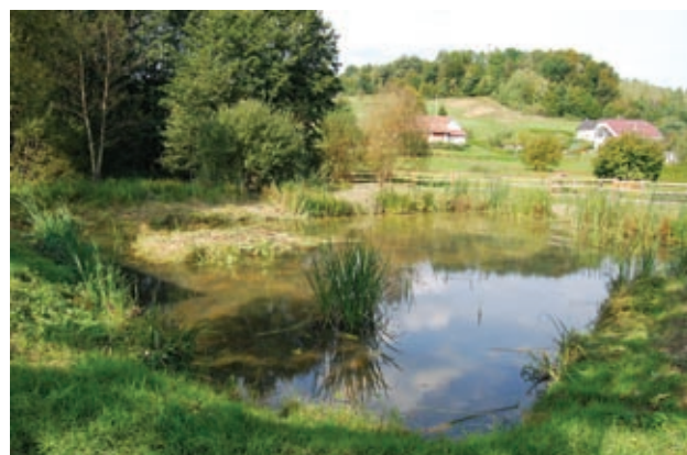
Deluje tako spokojno - varujmo jo!