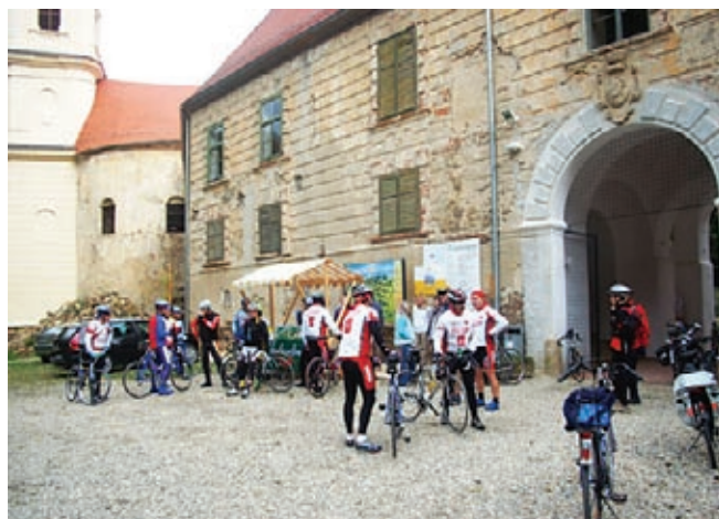
Počitek kolesarjev pred gradom