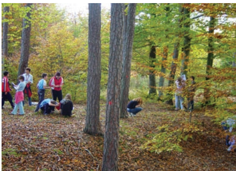
A ni lepo? Večkrat me obiščite