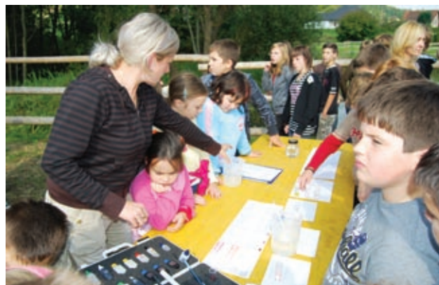
Kemijska analiza vode iz mlake

V okviru tega projekta sodelujemo s starši, občani, gospodom županom, ki nas pri delu podpira. Sodelujemo tudi z Javnim zavodom Krajinski park Goričko. Tako smo bili prisotni 24. septembra 2008 na drugi otvoritvi Kačove mlake, ki smo jo ob