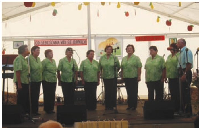
Ljudski pevci v Pečarovcih