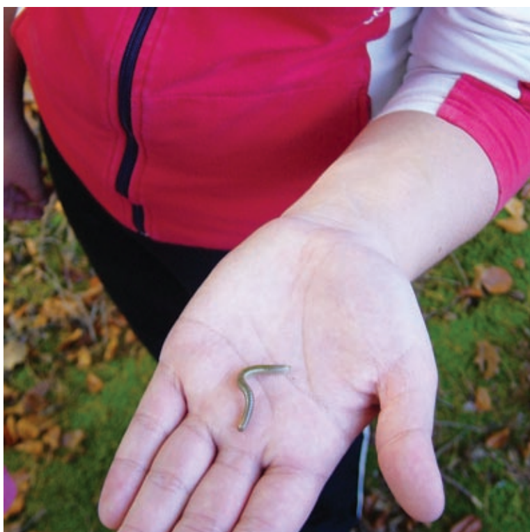
Oh, koliko nog ima.