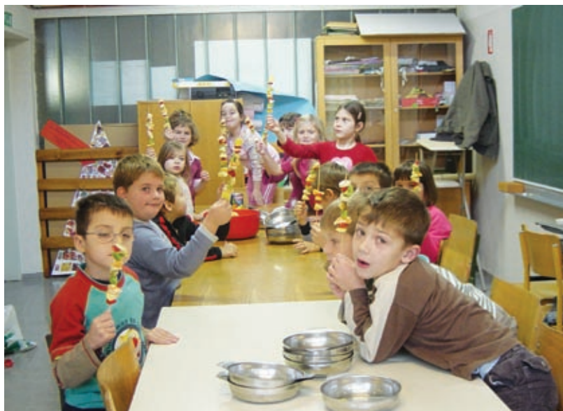
Zelo smo ponosni na svoje izdelke