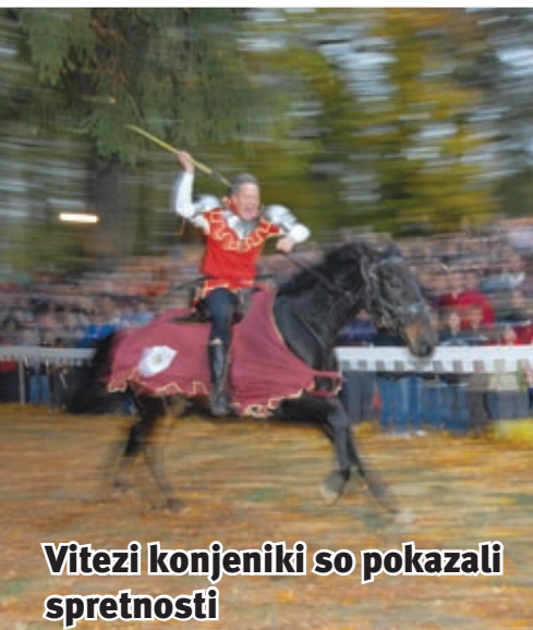
Vitezi konjeniki so pokazali spretnosti