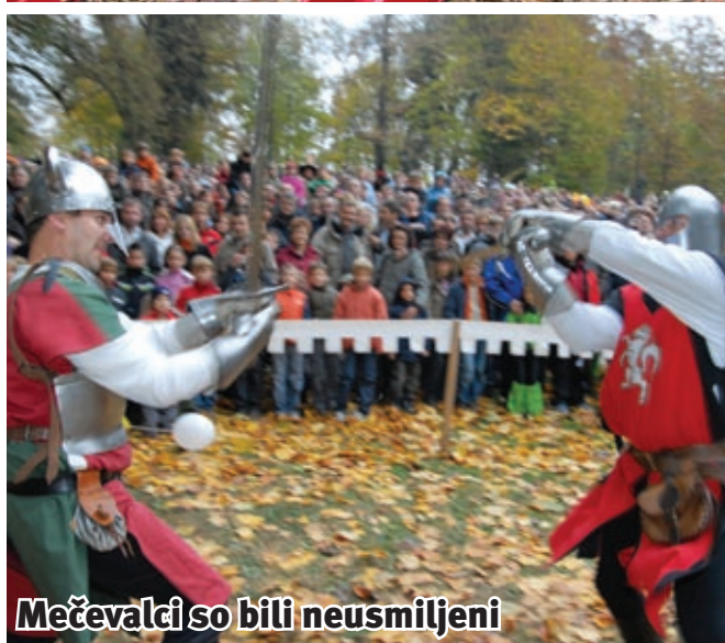
Mečevalci so bili neusmiljeni