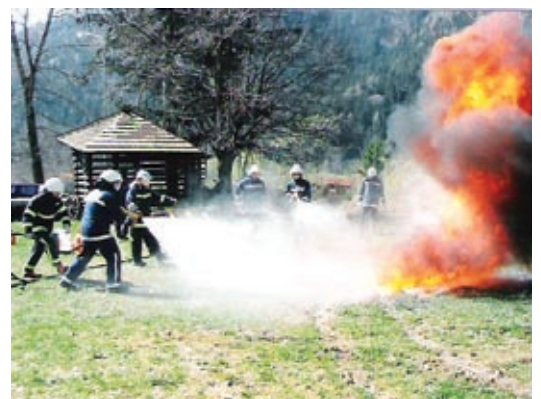
Prikaz gašenja razlitih tekočin