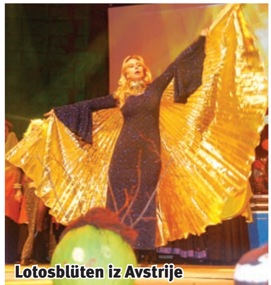
Lotosblüten iz Avstrije