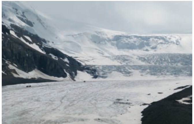
Ledenik Athabasca Glacier

11 km pred krajem Jasper je zelo ozka in 50 m globoka soteska Maligne Canyon. Od zgornjega do spodnjega parkirišča je 3,7 kilometra dolga pohodniška pot, ki vključuje šest mostov in z vsakega mostu se odpira čudovit razgled na dolino in reko Maligne River. Naprej proti jugu se peljete skozi Jasper in tudi v kraju samem divjad ni nobeno presenečenje. V nasprotju z »našo« divjadjo se živali v parku ne bojijo ljudi in lahko bi celo rekli, da se prav rade nastavijo fotografskim objektivom turistov. Naprej po cesti proti jugovzhodu v smeri Banffa se znamenitosti kar vrstijo. 30 km od Jasperja je 23-metrski slap Athabasca Falls, ki ima najmočnejši tok med planinskimi parki. V smeri proti Banffu se peljete mimo številnih manjših slapov ob cesti, eden večjih je še Sunwapta Falls. Peljete