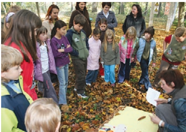
Doživljajska delavnica z otroki