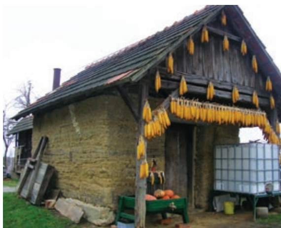
Žganjarska uta, kjer še danes kuhajo šnops

Kuhanje »šnopsa« (žganica, palinka) je še dandanes precej razširjena dejavnost kmečkega prebivalstva. Pridobivanje tega poteka v jeseni in pozimi, ko na poljih ni več večjega kmečkega