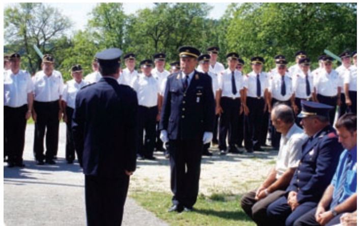
Pozdrav desetini

Leto 1978 je v analih Kovačevcev zapisano kot ustanovno leto Prostovoljnega gasilskega društva Kovačevci. In kot se za prave gasilce spodobi, se je ta okrogla obletnica v Kovačevcih slavnostno proslavila.