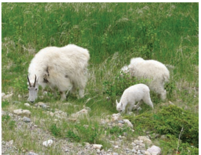
Bele gorske koze