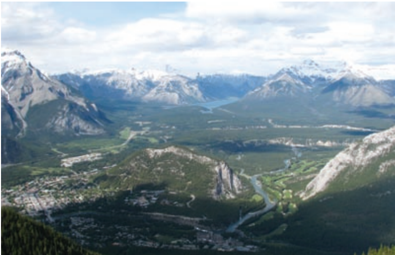
Pogled z gore Sulphur na mesto Banff