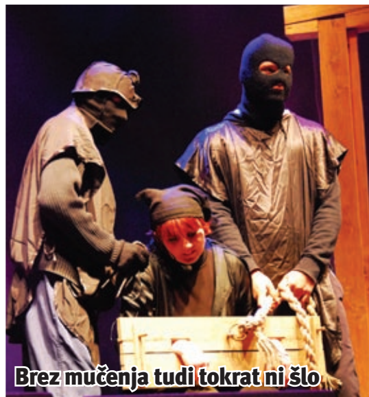
Brez mučenja tudi tokrat ni šlo