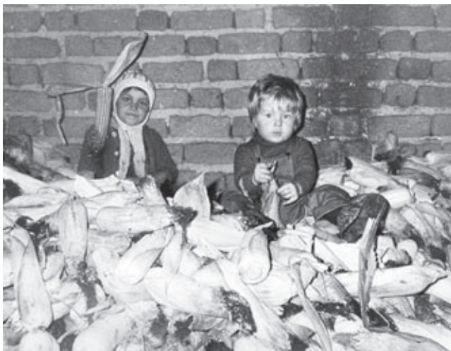
Že skoraj pozabljeno opravilo je »lūpanje kukrce« (Radovci, okrog 1980)

To so bili koristni in tudi zabavni običaji. Ob takih priložnostih se je pri hiši zbralo veliko ljudi, zato je bilo veselo. Zlasti ženske so do kosti obrale vsakega posebej in vse skupaj. Za dobro razpoloženje so ob delu peli, nekateri tudi igrali in zraven plesali, skratka se zabavali dolgo v noč. Med marsikom so se skalile tudi nove simpatije in hitro je znala poskočiti iskrica ljubezni. Lačni in žejni niso bili, saj je kuhinja nudila vse, kar je bilo pri hiši. Najboljše so bile seveda potice, makove in orehove.