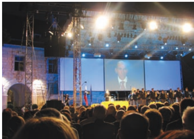
Govor Janeza Janše

Pa še nekaj besed o preteklosti. Do leta 1919 je bilo Prekmurje vključeno v mogočno Ogrsko. Bilo je majhna pokrajina na obrobju mogočne dežele, zapostavljena tako gospodarsko, socialno kot politično. In Prekmurci? Majhen narod, ki so se ga Madžari tako ali tako odločili iztrebiti. Razni verski, politični in kulturni centri, kar jih je pač bilo, so bili zunaj meja malega Prekmurja. Mlad prekmurski človek je moral, če se je želel izobraževati, v madžarske šole in se učiti tujega jezika. V gospodarsko močno zaostalem Prekmurju,