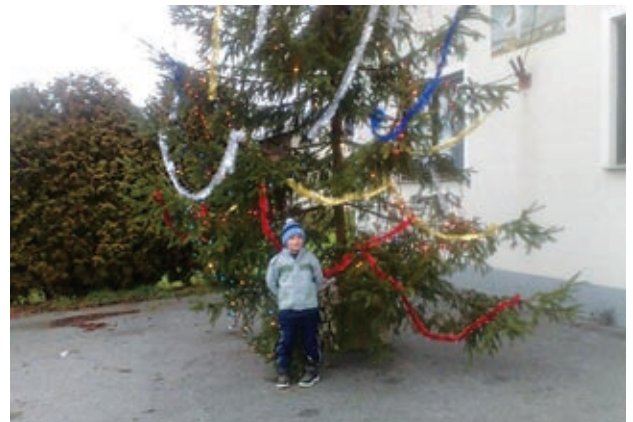
Mark nas je navdušil s pesmico o jelki