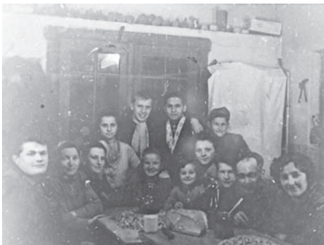
Zbrani ob lupanju semena (Grad, 1961/62)

Za razliko od danes, ko gojimo buče golice, ki nimajo lupine, ampak le luske kot tanko ovojnico, je bilo seme pridelano iz posebne vrste buč, ki jih je bilo potrebno lupiti. Sušili so ga predvsem na soncu, podstrešju in v krušnih pečeh. Dan pred lupljenjem so seme namočili v vodi, da je postala lupina mehka in se seme ni lomilo. Med večdnevni delom so si čas krajšali s petjem in pripovedovanjem zgodb. Prepevali so slovenske narodne pesmi in se pogovarjali o vsem po malem. Gospodar je poskrbel za pijačo, gospodinja pa je postregla z domačimi dobrotami (potico, kruhom). Pijača je bila prav tako doma pridelana (mošt, vino, šnops oz. domače žganje). Glede na to, da je dejavnost običajno trajala do poznih večernih ur, so se znali, če je bilo le možno, tudi zavrteti ob glasbi.