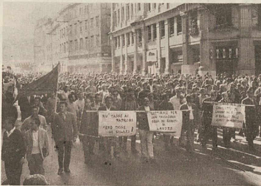
Splošna stavka v Trstu dne 9. oktobra je v celoti uspela. Pokazala je, da je delavski razred združen v bojih za svoje pravice

Vendar pa je treba imeti pred očmi dejstvo, da se v največjih kapitalističnih grupacijah pojavlja reakcija na najnovejši razvoj sklepanja pogodb, ki skuša v zameno za priznanje enotne nasprotne sindikalne organizacije v tovarnah obnoviti oblast podjetnikov. To je poskus, ki zanj seveda ne moremo trditi, da je že premagan. Prav gotovo pa je v krizi kot dokazuje tako reagiranje delavcev in sindikatov s sedanjimi boji na »ponudbe« Pirellija kot junijski poskus v Fiatu,