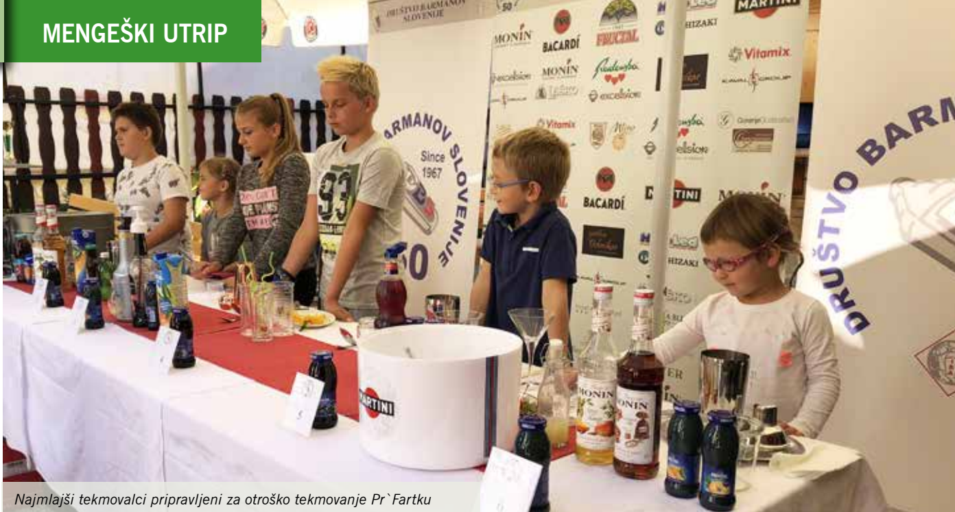
Najmlajši tekmovalci pripravljeni za otroško tekmovanje Pr`Fartku