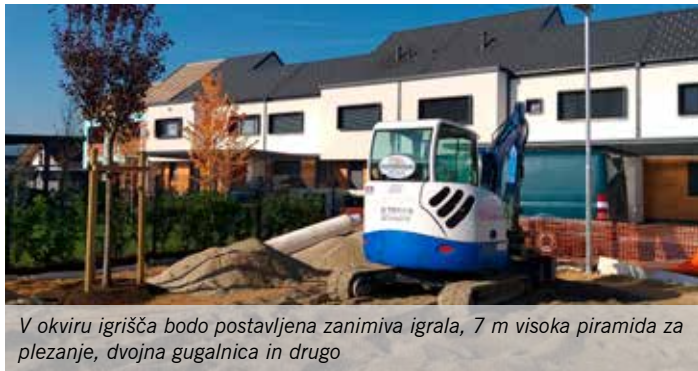
V okviru igrišča bodo postavljena zanimiva igrala, 7 m visoka piramida za plezanje, dvojna gugalnica in drugo

V petek, 22. septembra, je ob jutranji vadbi skupine Šole zdravja potekala uradna otvoritev orodij za fitness na prostem. Orodja so bila v času šolskih počitnic postavljena na dveh lokacijah, in sicer sedem orodij v Športnem parku Mengeš, ob orodjih za ulično vadbo, in pet ob igrišču za odbojko na mivki v okviru Športne ploščadi Loka. Orodja so dobro obiskana, v dopoldanskih urah jih uporabljajo vadeči v skupini Šola zdravja, sprehajalci in drugi rekreativci, popoldan pa predvsem šolarji in njihovi starši.