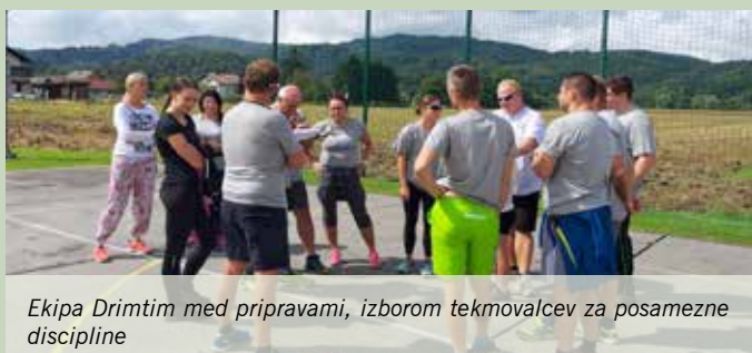
Ekipa Drimtim med pripravami, izborom tekmovalcev za posamezne discipline

V nedeljo, 2. septembra, so na Športni ploščadi v Loki potekale že tradicionalne 3. vaške igre. Z domačega terena, Loke pri Mengšu, so bile tri ekipe, Umetniki, ki so jih sestavljali člani Kulturnega društva Antona Lobode, Kaskaderji, ki so jih sestavljali člani Športnega društva Loka, in Piromani, ki so jih sestavljali člani PGD Loka pri Mengšu. Tradicionalno so se jim pridružili Mengšani, v ekipi Drimtim, ki jo je sestavil župan. Nova je bila ekipa Hribovcev iz Dobena. 3. vaške igre, ki so potekale v osmih disciplinah, so se začele ob 12. uri in zaključile malo po 17. uri. Zmagala je ekipa Drimtim, drugi so bili Kaskaderji in tretji Umetniki. Ekipa novicev, Hribovci, je napovedala, da bodo prihodnje leto z okrepitevami izboljšali položaj.