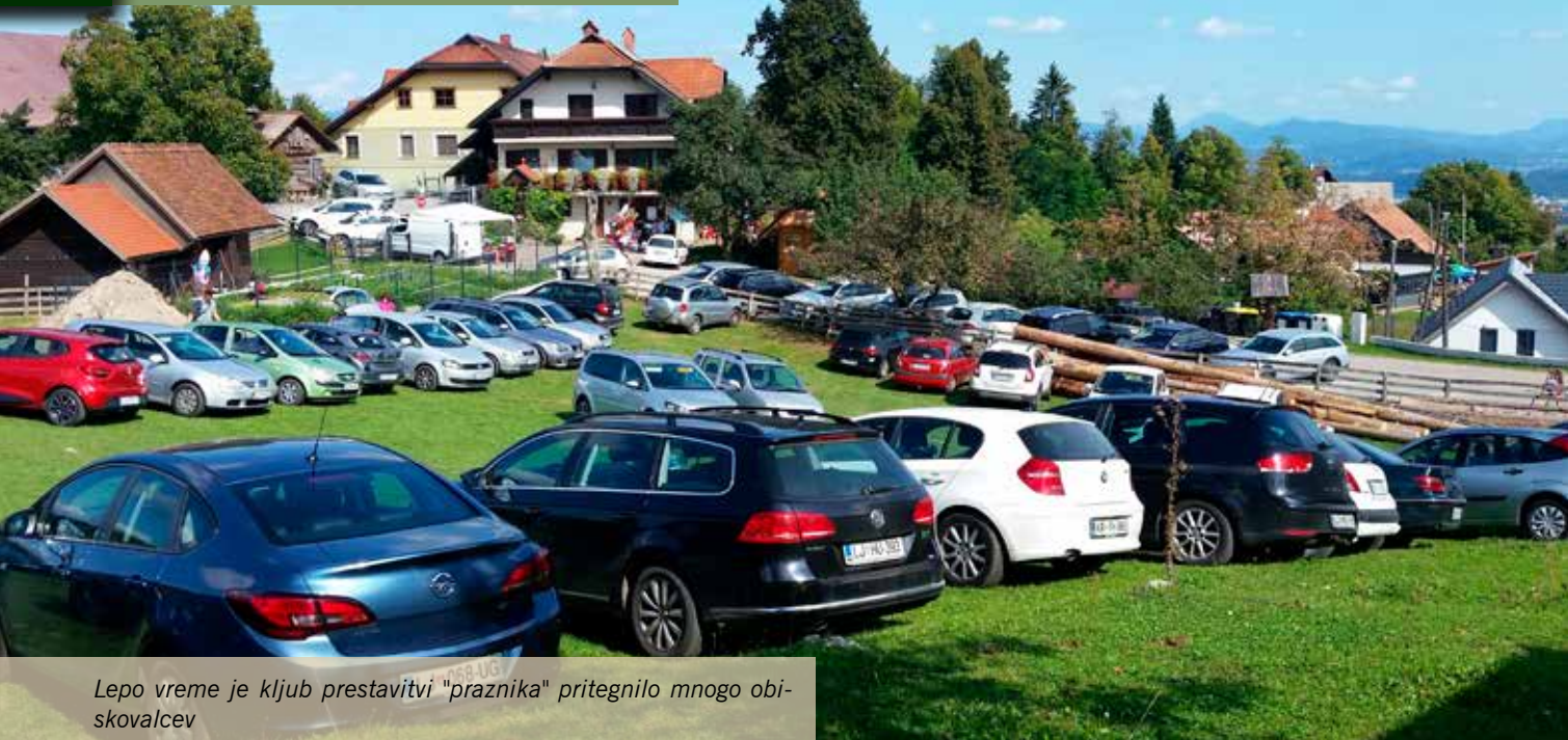
Lepo vreme je kljub prestavitvi "praznika" pritegnilo mnogo obiskovalcev