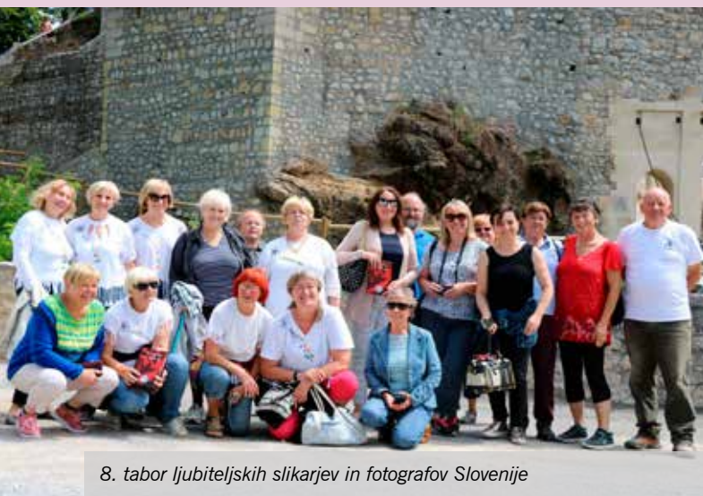
8. tabor ljubiteljskih slikarjev in fotografov Slovenije

Julija in avgusta večina uživa na počitnicah, v Likovnem društvu Mengeš pa niso vsi počivali, saj je bilo mnogo dogodkov, ki so se jih nekateri udeležili. V začetku julija je bil 8. tabor ljubiteljskih slikarjev in fotografov Slovenije ZLDS na gradu Komenda na Polzeli. Na Polzeli je bila prav tako delavnica akvarela.