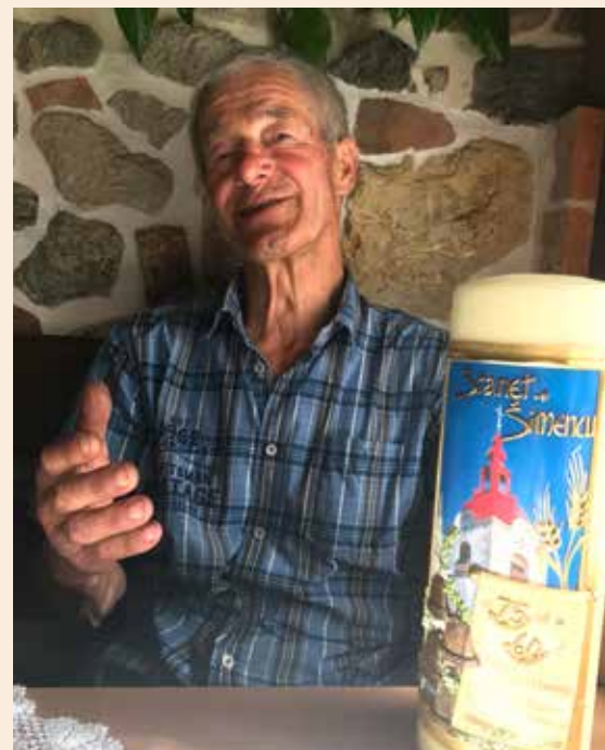
Svečo mu je za 60-letno aktivno delo pritrkovalca podelilo Kulturno društvo Mihaelov sejem

Še vedno aktivno sodelujem v ekipi veteranov, pomagam pri postavljanju stojnic, postavljanju smrek pred gasilskim domom in cerkvijo. Sodelujem pri očiščevalnih akcijah. S strokov-