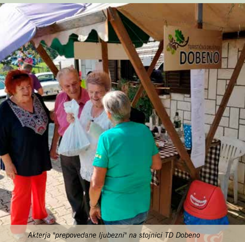
Akterja "prepovedane ljubezni" na stojnici TD Dobeno