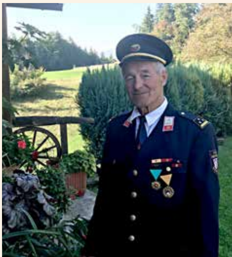
Častno in odgovorno funkcijo poveljnika je opravljal 18 let

Po navadi sem pokonci pred sedmo uro. Grem v hlev in pomolzem kravo. Za tem zajtrkujem.