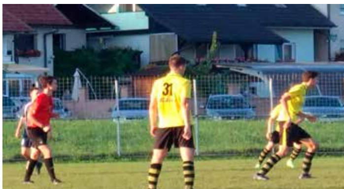
Z novimi šestimi točkami so mladinci še vedno brez oddane točke