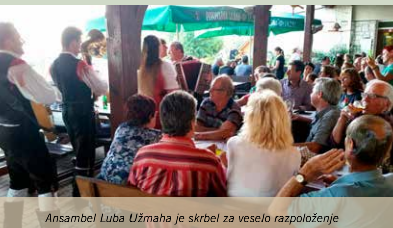
Ansambel Luba Užmaha je skrbel za veselo razpoloženje