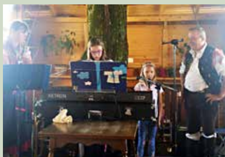
Zara in Naja sta poželi bučen aplavz