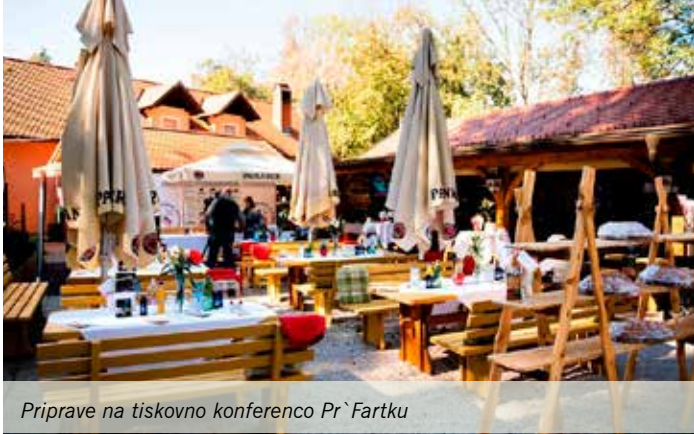
Priloge na tiskovno konferenco Pr`Fartku

voljo 7 minut. Ocenjuje pa se tako časovna omejitev, strokovno delo, mešanje koktajla ter predvsem tudi končni izdelek, tu se ocenjujejo videz, aroma in okus koktajla. Tomažev koktajl je pripravljen in postrežen v posebnem kozarcu z veliko sadja. Koktajl je videti čudovit, lep na pogled, in naj poudarimo, da je koktajl pripravljen z zdrobljenim ledom in da se ta led tudi hitreje topi in je še bolj pomembno, da koktajl čimprej prispe do ocenjevalne komisije.