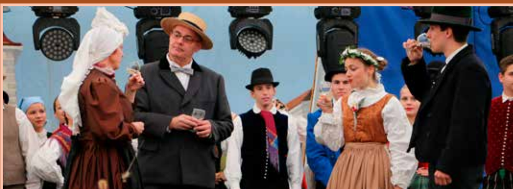
Na odru so s plesnimi točkami, igro in petjem obudili ohcet po starem