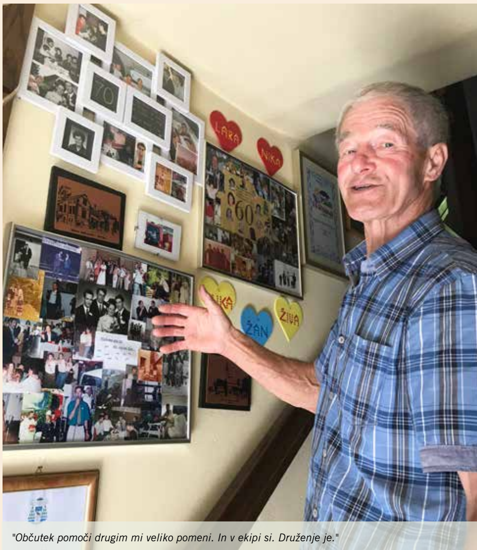
"Občutek pomoči drugim mi veliko pomeni. In v ekipi si. Druženje je."

kako je nekega dne »majster« Vahtar dobil večji posel pri podjetju v Ljubljani. Podjetje je izdelovalo kolesa za žičnice. Vajenci smo se s tem delom izurili struženja. Zaradi te pridobljene veščine sem dobil delo v Domžalah v vajeniški šoli. Po odsluženi vojaščini sem šel za strugarja v SCT Ljubljana. Spomnim se, kakšne kolone so bile že takrat na cestah. To me je tudi odvrnilo od dela v Ljubljani, zaradi te dolge in časovno naporne poti. Za kratek čas sem dobil delo v Melodiji Mengeš, nato pa v Eta Kamnik. Po štiriletni delavski šoli v Ljubljani so me zaposlili v Opekarni v Mengšu. Tu pa sem imel nesrečo. Težak stroj je padel name. Dolgo časa sem bil v bolniški in se kasneje invalidsko upokojil.