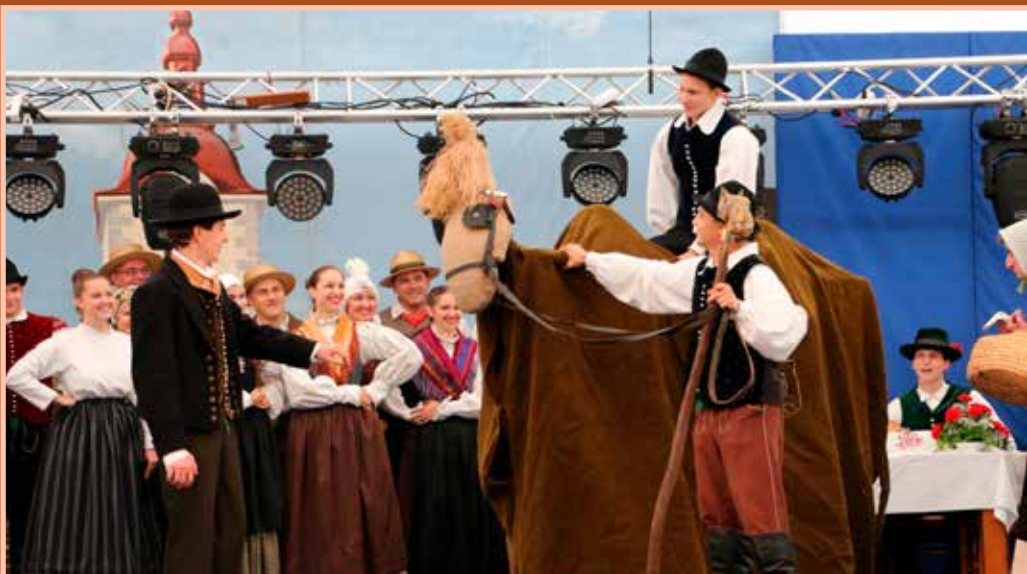
Nastopajoči so obudi star običaj prodajanja kamele