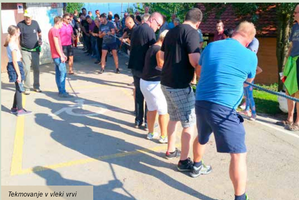
Tekmovanje v vleki vrvi