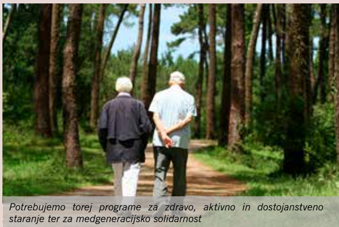
Potrebujemo torej programe za zdravo, aktivno in dostojanstveno staranje ter za medgeneracijsko solidarnost