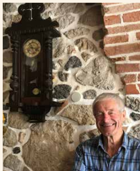
Prehobil je uspešno gasilsko pot od desetarja, mentorja, podpoveljnika do poveljnika društva