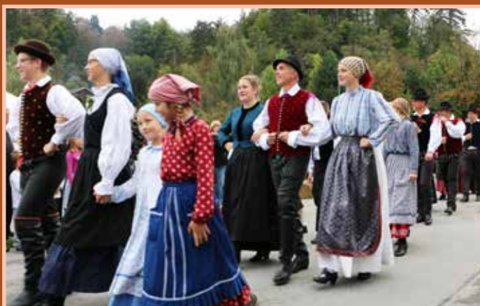
V povorki so bili svatje oblečeni v različne narodne noše