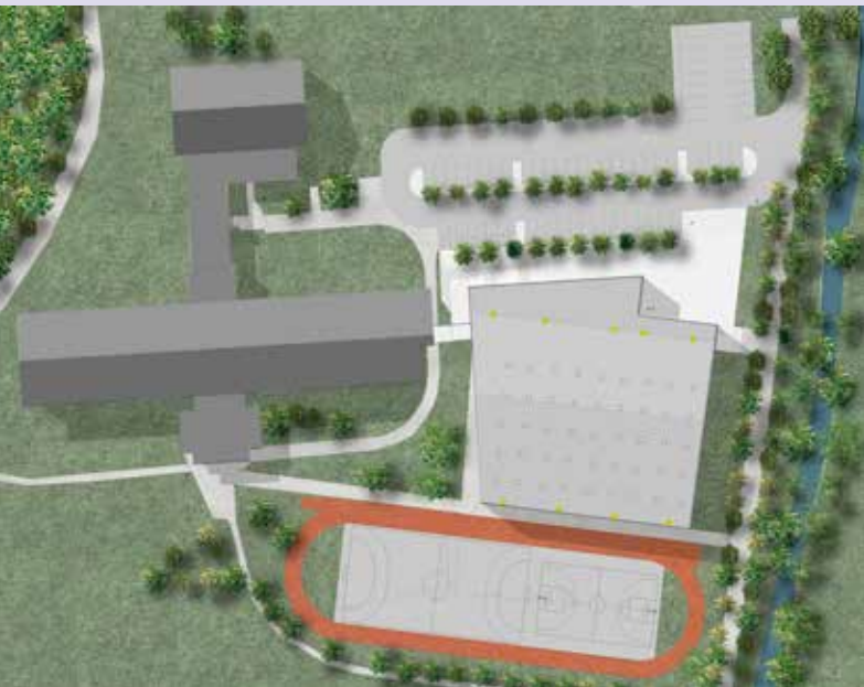
Predstavitve lokacije nizkoenergijske večnamenske Športne dvorane Mengeš in povezovalne pešpoti, do šole, telovadnice in drugih objektov. Ostala bo tudi povezovalna pot z mostom v smeri Kulturnega doma Mengeš.

Konec avgusta 2018, ko je občina pridobila gradbeno dovoljenje za izgradnjo nizkoenergijske večnamenske Športne dvorane Mengeš, so se na območju povezovalnega hodnika začela predhodna arheološka izkopavanja. Konec leta 2018 bosta sledili objavi javnega razpisa za izbiro najugodnejšega izvajalca za gradnjo in razpis za izbiro najugodnejšega izvajalca za gradbeni nadzor. Gradnja športne dvorane naj bi se začela poleti 2019, v času šolskih počitnic, zaključila pa se bo v letu 2020.