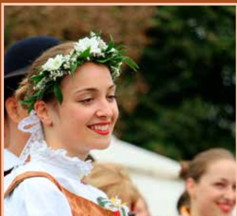
Nevesta je pred poroko na glavi nosila venček rož