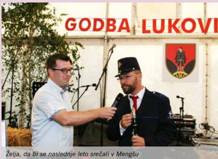
Želja, da bi se naslednje leto srečali v Mengšu