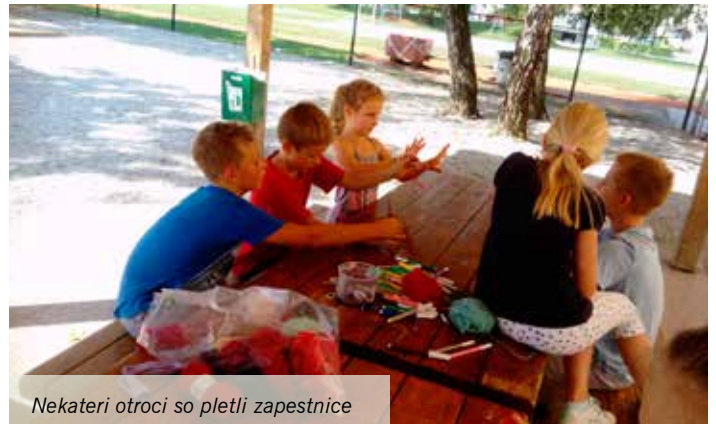
Nekateri otroci so pletli zapestnice

ustvarjali, in sicer kolaž iz črk izrezanih iz časopisa, prav tako pa smo se igrali na igrišču. Zadnji dan pa nam je malo zagodlo vreme, tako da smo se odločili in pogledali slovenski film Pozabljeni zaklad. Vse popoldneve smo se igrali na igrišču ali pa v telovadnici. Kuhar in kuharice so nas vedno razveselili z dobrim kosilom.