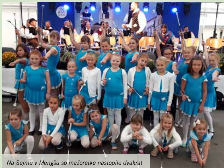
Na Sejmu v Mengšu so mažoretke nastopile dvakrat

Besedilo in foto: Anita Omerzu Tome, trenerka Mengeških mažoretk