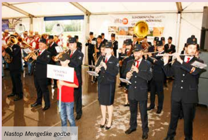
Nastop Mengeške godbe

Dvajseti rojstni dan res ni veliko v primerjavi s 134, kolikor jih praznujejo druge godbe iz okolice, a je priložnost, da se srečajo godbe in da zaigrajo najprej vsaka posebej in nato še skupaj. Godba Lukovica je v dvajsetih letih zrastle iz nič v številčno močno godbo in lahko se pohvali tudi s tem, da so vsi ustanovni člani še živi. Svoje praznovanje 20-letnice Godbe Lukovica so združili z Območnim srečanjem pihalnih orkestrrov, ki ga vsako leto pripravi območna izpostava JSKD Domžale. Tako so se na srečanju predstavile poleg slavljence še godbe iz Domžal, Mengša in Moravč.