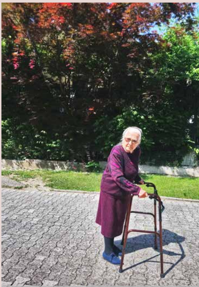
Danes pribl. 4 odstotke prebivalstva potrebuje stalno oskrbo starostno onemoglih, kronično bolnih ali invalidnih oseb, to število se bo povečalo za trikrat