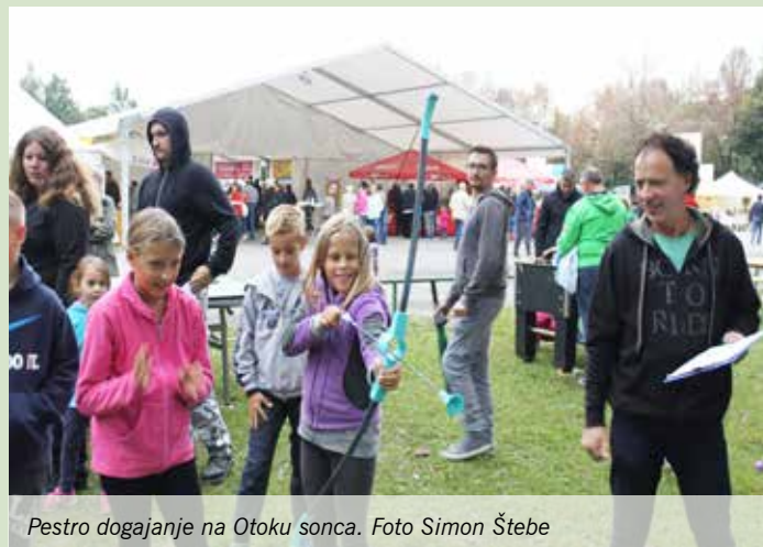
Pestro dogajanje na Otoku sonca.