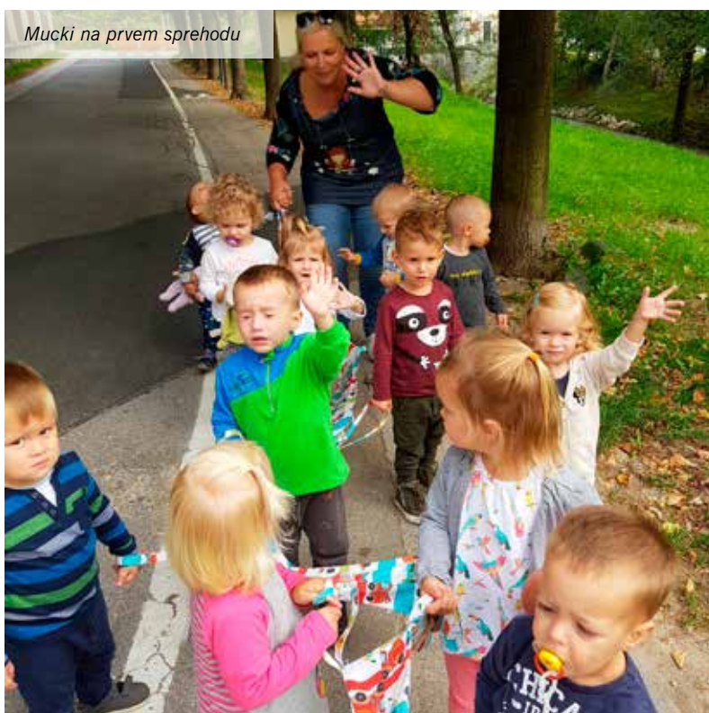
Mucki na prvem sprehodu