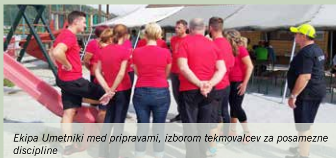
Ekipa Umetniki med pripravami, izborom tekmovalcev za posamezne discipline

V Športnem parku Loka je bilo v nedeljo, 2. septembra, zelo živahno že pred 12. uro, ko so se začele zbirati ekipe in so potekale priprave, izbor tekmovalcev za posamezne discipline. Ekipe so tekmovalce v osmih disciplinah, prva je bila »žakelj«, druga »pink-ponk«, tretja »lov balonov«, četrta »3 v vrsto«, peta »jerbas«, šesta »hodulje«, sedma »pikado«, vseskozi pa je potekalo tudi vlečenje vrvi. Ekipe so imele na voljo tudi jokerja, ki je podvojil pridobljene točke in so ga morale vložiti pred začetkom discipline. Z jokerjem so največ točk dobili Umetniki.