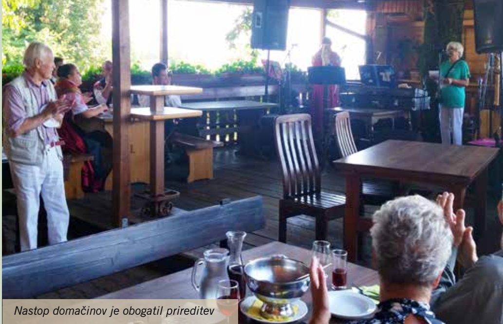
Nastop domačinov je obogatil prireditev