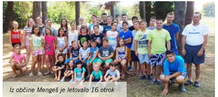
Iz občine Mengeš je letovalo 16 otrok

Na počitnicah so bili z njimi mladi mentorji, ki so z veliko mero občutka