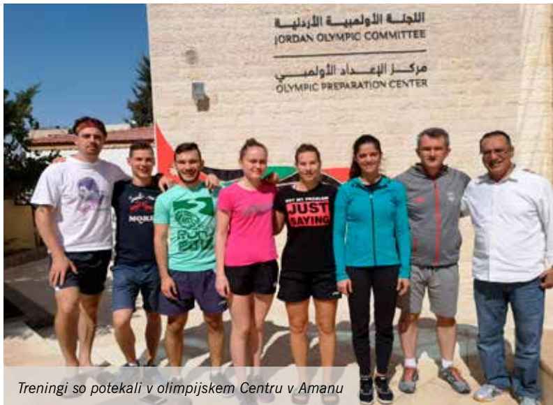
Treningi so potekali v olimpijskem Centru v Amanu