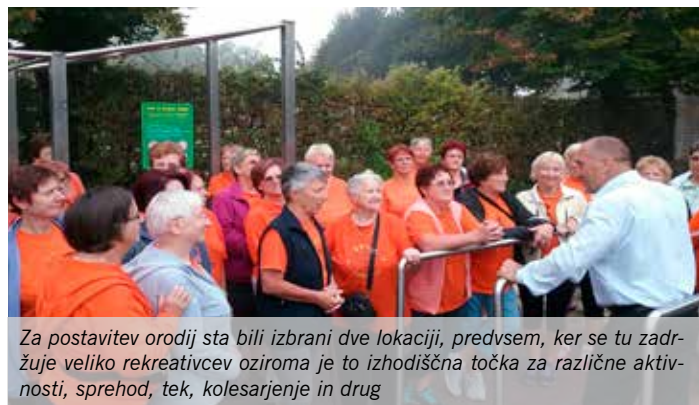
Za postavitev orodij sta bili izbrani dve lokaciji, predvsem, ker se tu zadržuje veliko rekreativcev oziroma je to izhodiščna točka za različne aktivnosti, sprehod, tek, kolesarjenje in drug