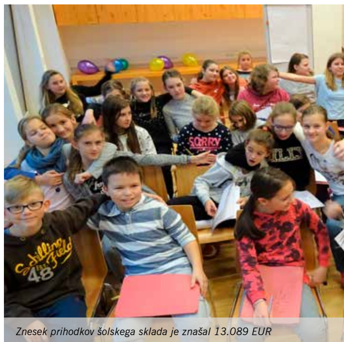
Znesek prihodkov šolskega sklada je znašal 13.089 EUR