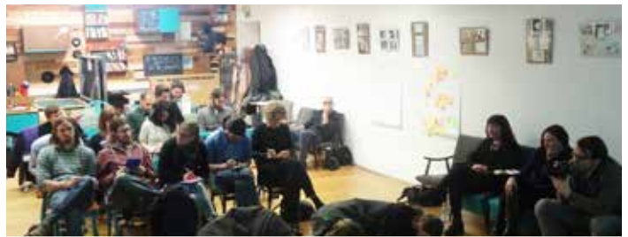
V projektu RAY zaposlitvenega portala bodo aktivno sodelovali mladi

Ideja o lokalni zaposlitveni mreži je tako prerasla v mednarodni projekt. Pričakujeta se dva intelektualna outputa: