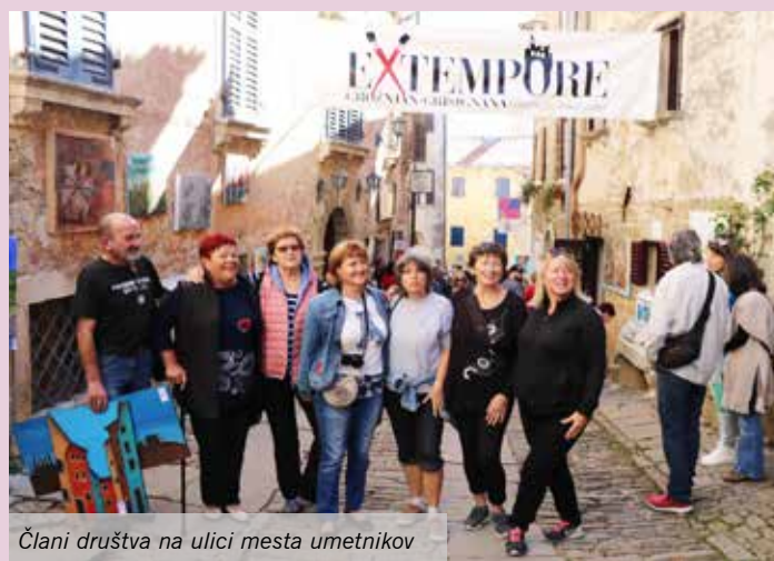
Člani društva na ulici mesta umetnikov