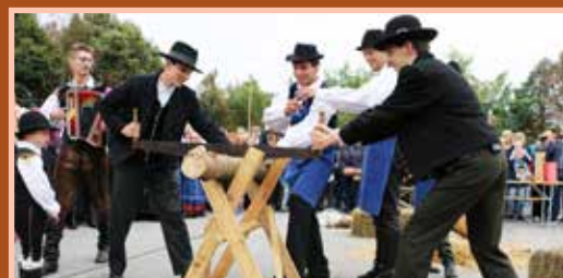
Ko je ženin prežagal hloed, je bilo šrange konec