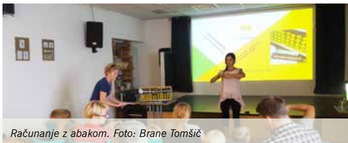
Računanje z abakom.

V sveže prenovljenih prostorih AIA – Mladinskega centra Mengeš je bilo 12. septembra prvo predavanje v letošnjem šolskem letu; predstavitev programa Brainobrain, ki ga je izvedel Brainobrain center Domžale.