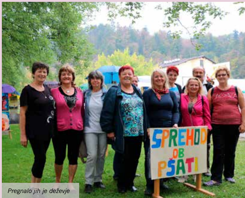
Pregnalo jih je deževje