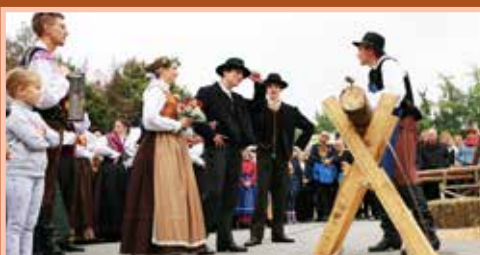
Šrango so vodili mladci iz vasi neveste in se pogajali za odškodnino