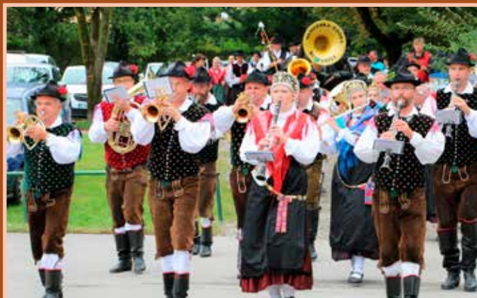
Mengeška godba je glasbeno spremljala povorko neveste in ženina