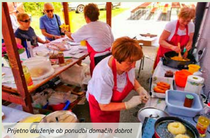
Prijetno druženje ob ponudbi domačih dobrot

Pred letom dni je bila mengeška kulinarična zgodba, z melodijami okusov in glasbe, prvič izvedena ter se v letošnjem letu ponovila aprila in junija.