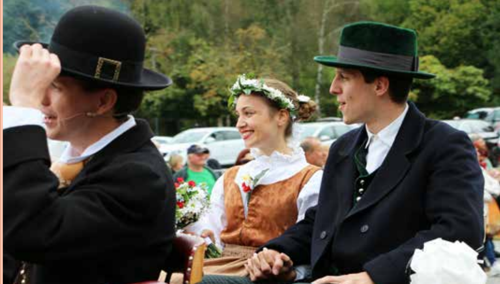
Nevesta in ženin sta se pripeljala v zapravlživčku in pozdravljala zbrane