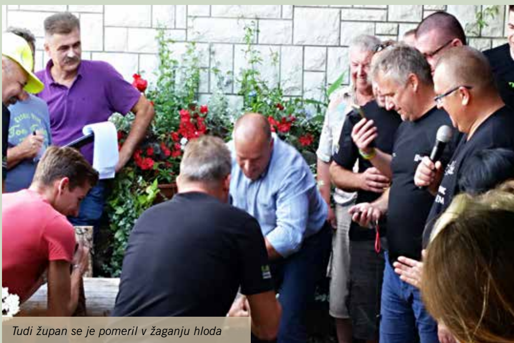
Tudi župan se je pomeril v žaganju hloda