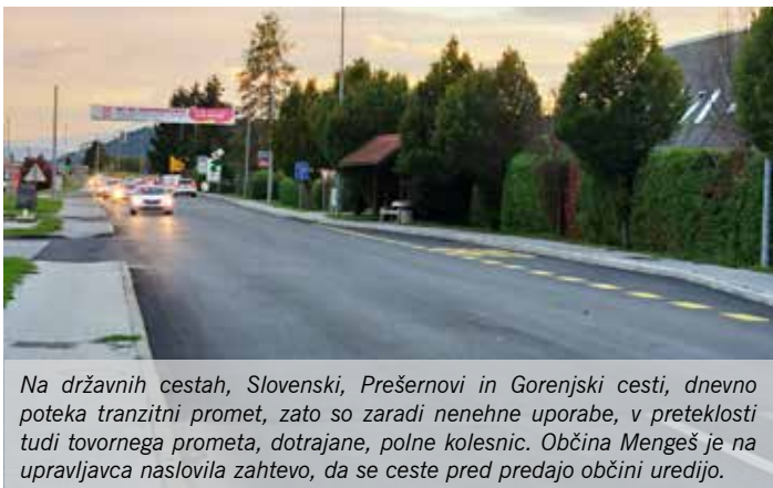
Na državnih cestah, Slovenski, Prešernovi in Gorenjski cesti, dnevno poteka tranzitni promet, zato so zaradi nenehne uporabe, v preteklosti tudi tovornega prometa, dotrajane, polne kolesnic. Občina Mengeš je na upravljavca naslovila zahtevo, da se ceste pred predajo občini uredijo.

Po zaključeni gradnji manjkajočega dela obvoznice v občini Mengeš bodo sedaj državne ceste, cestišče na Slovenski, Prešernovi in Gorenjski cesti, postale lokalne ceste, torej prešle bodo v upravljanje občine. Občina Mengeš je na družbo DRI za upravljanje investicij, Družba za razvoj infrastrukture, d. o. o., ki sedaj upravlja omenjene ceste, že naslovila zahtevo, da se ceste pred predajo obnovijo.