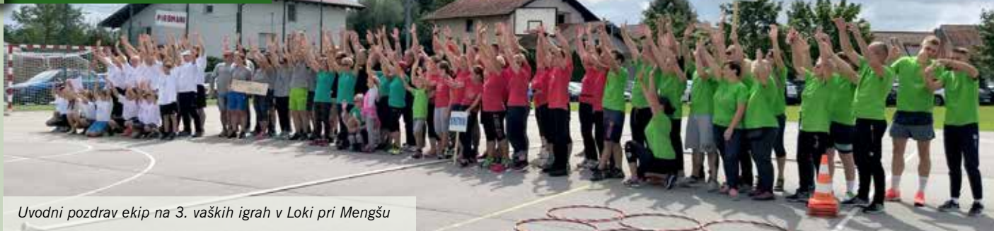
Uvodni pozdrav ekip na 3. vaških igrah v Loki pri Mengšu