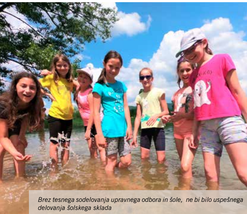
Brez tesnega sodelovanja upravnega odbora in šole, ne bi bilo uspešnega delovanja šolskega sklada