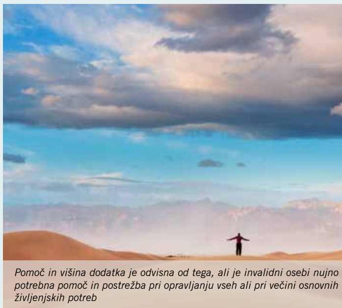
Pomoč in višina dodatka je odvisna od tega, ali je invalidni osebi nujno potrebna pomoč in postrežba pri opravljanju vseh ali pri večini osnovnih življenjskih potreb

Področje varstva odraslih v okviru Centra za socialno delo Domžale (CSD) vključuje različne ukrepe in storitve posameznikom, skupinam odraslih in starejših uporabnikov, ki so se znašli v stiski in potrebujejo pomoč, bodisi zaradi osebnih težav, starosti, bolezni ali invalidnosti, ker nimajo sredstev za preživetje, zaradi slabih medosebnih odnosov, ker so žrtve nasilja, ker jim neformalna mreža ne nudi toliko pomoči, kot je potrebujejo, zaradi odvisnosti od alkohola, drog, idr. substanc in dejavnosti, ker živijo kot brezdomci, bodisi zaradi številnih situacij, v katerih se težje znajdejo.