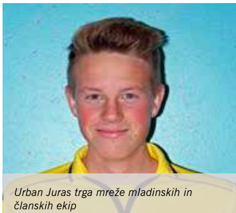
Urban Juras trga mreže mladinskih in članskih ekip

Po zmagah v prvih dveh kolih MNZ lige so domači navijači z nestrpnostjo dočakali novo tekmo na igrišču Pod Gobavico. V deževnem in nič kaj prijaznem vremenu je v goste prišla ekipa Jezera iz Medvod. Gostje, ki se po nekajletnem mrku članske ekipe vračajo na sceno, so v predhodnem krogu zmagali, kar jim je dvignilo pričakovanja in samozavest.