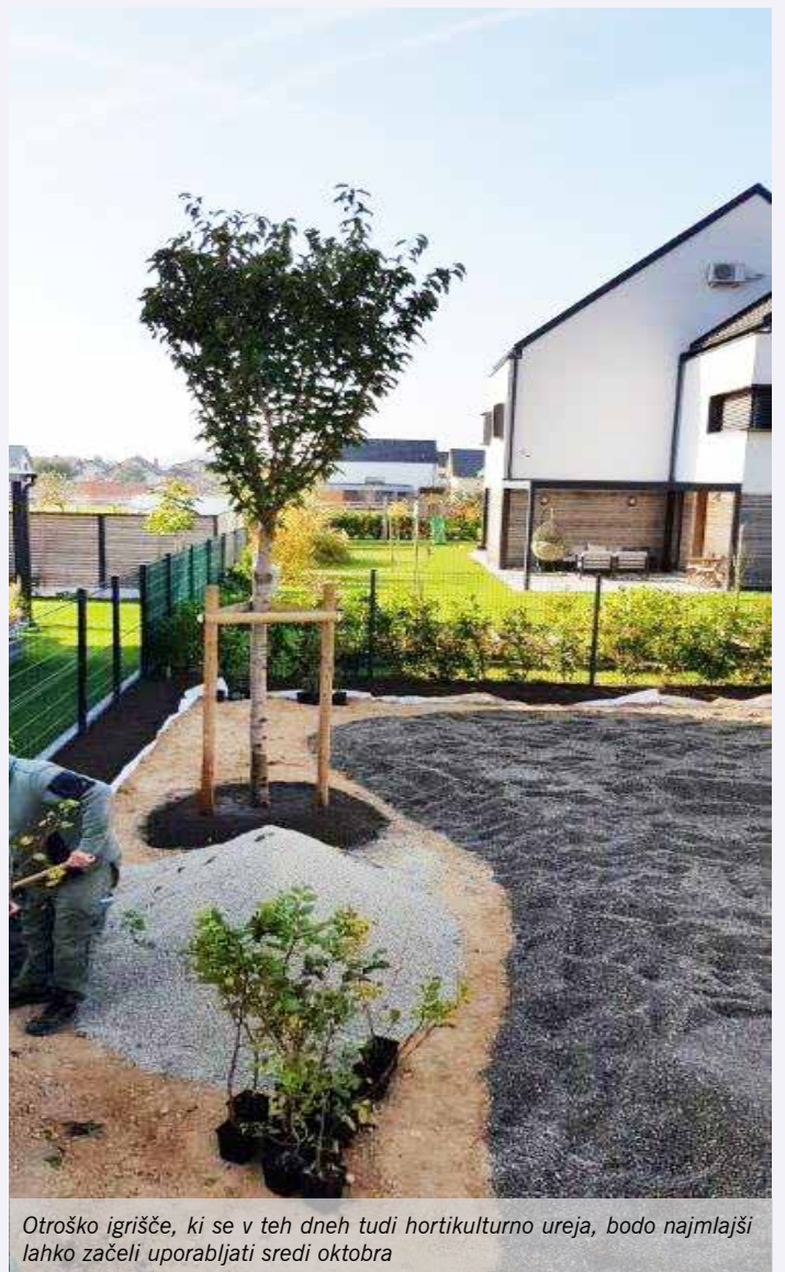
Otroško igrišče, ki se v teh dneh tudi hortikulturno ureja, bodo najmlajši lahko začeli uporabljati sredi oktobra