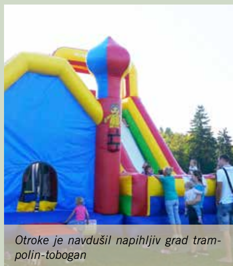
Otroke je navdušil napihljivi grad trampolin-tobogan