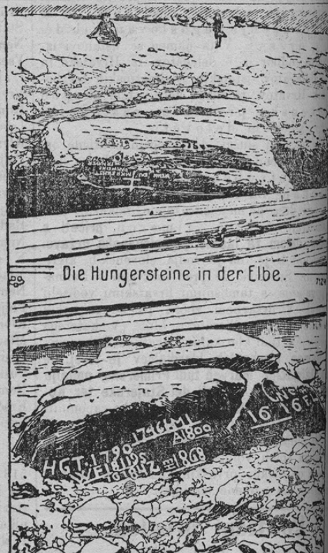
Die Hungersteine in der Elbe.

„Wen du mich siehst, dann weine“ („kadar me vidiš, jokaj“). Mnogo pripovedk je vezanih na to kamenje. Tako se poroča, da so l. 1477 skozi tri mesece tamošnji velikanski gozdovi goreli. L. 1472 ni deževalo od binškošni naprej skozi 12 tednov; ure daleč so morali vbogi ljudje po