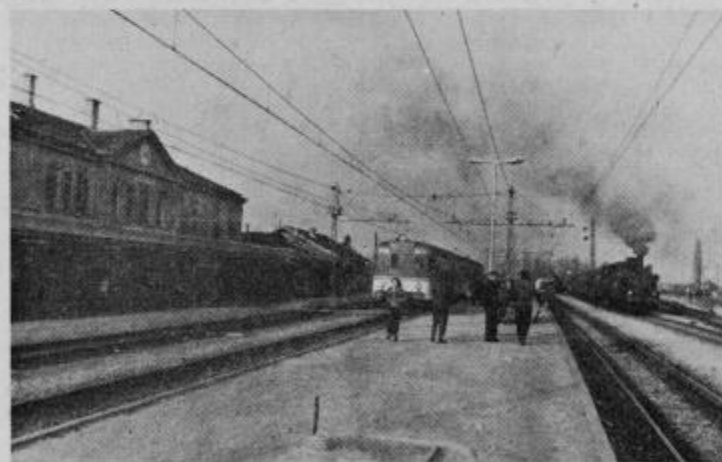
Dvema generacijama, motornemu vlaku in parni lokomotivi se bo v kratkem pridružila še električna lokomotiva. Dim parnih lokomotiv pa bo vedno redkejši gost Pragerskega.

temveč bodo v veliki meri rešeni vsakdanjega gostega dima parnih lokomotiv. Vsak dan pripelje na žel. postajo Pragersko okoli 160 različnih kompozicij potniških in tovor-