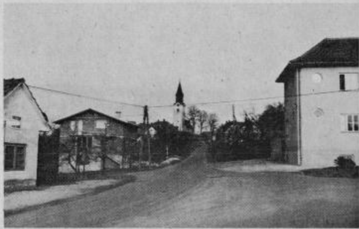
Črešnjevce s kulturnim domom.

V zvezi s tem krajem je pomembna ugotovitev, ki jo je verjetno spregledal tudi kakšen domačin. Ze nekaj časa v vasi ni kmetije, kjer bi imeli konja za kmečka opravila. To je prav gotovo vredno pozornosti. Posebej zato, ker je okoli vasi mnogo kmetijskih obdelovalnih površin, ki so večinoma dobro obdelane. Res je tudi, da postaja Črešnjevce z vsakim dnevom močnejše delavsko naselje, saj je blizu Slov. Bistrica in se v bistriški industriji zaposluje vedno več vaščanov.