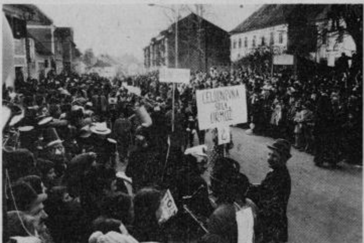
Množica ljudi je napolnila Mestni trg, Ptujsko cesto do stare tovarne „Jože Kerenčič“, Vrazovo ulico in ulico proti gradu vse do Petrola. Vsekakor rekorden obisk.