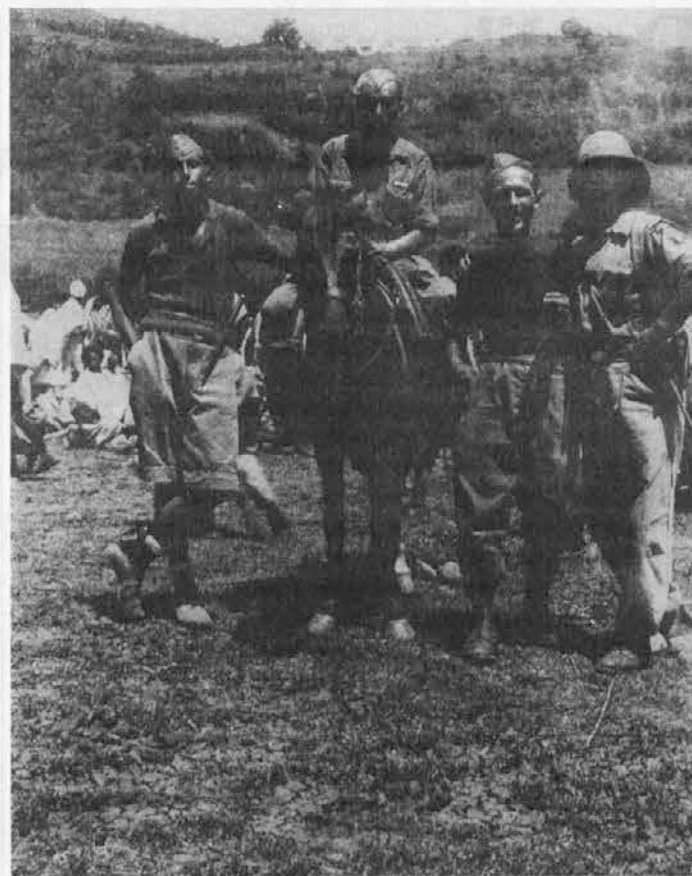
Il comandante Giorgio Venuti a cavallo con i suoi legionari in Africa. In secondo piano la folla di etiopici con le ampie vesti di cotone bianco. Sullo sfondo il paesaggio del luogo (1935)

punto del monsignor vicario Giovanni Petricig, da tutti considerato, come si è detto, un santo. I comportamenti equivoci, le sborne con i buontemponi del fascio, i discorsi sguaiati e la frequentazione di donne