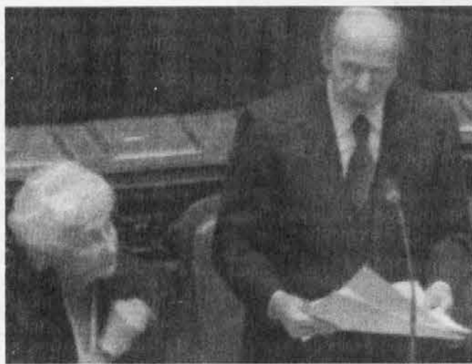
Lamberto Dini in zunanja ministrica Susanna Agnelli

V programskem govoru je omenil tudi nerešeno vprašanje zaščite jezikovnih manjšin