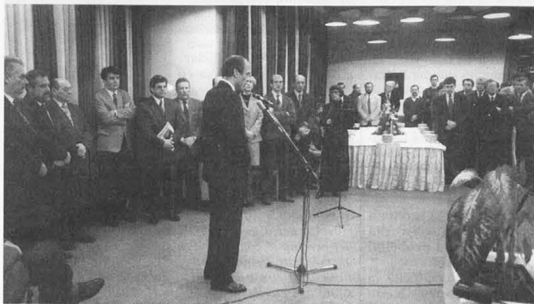
Predsednik Drnovšek na tradicionalnem novoletnem srečanju Slovencev v Kobaridu