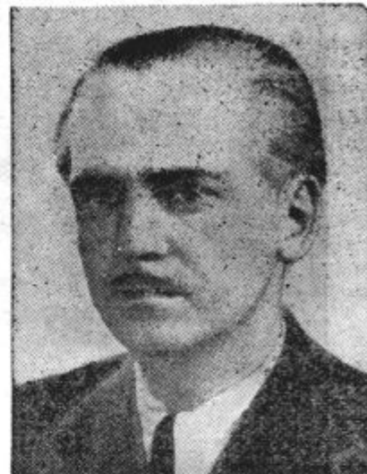
Španski notranji minister in Frankov svak Srano Suner, ki je strl odpor generalov in privedel Španijo v totalitarizem ter na os Rim-Berlin.

napovedujejo spremembo vlade, ki naj bi jo sestavil sedanji notranji minister Suner, predsednik španske falange. General Franco prevzame osebno vodstvo falange.