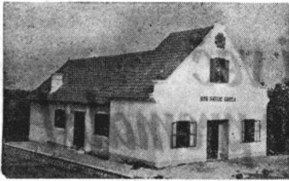
V nedeljo 30. julija t. l. je bil z velikimi svečanostmi otvorjen »Dom Matije Gubca« pri Sv. Juriju ob Ščavnici. — Pogled na dom iz daljave