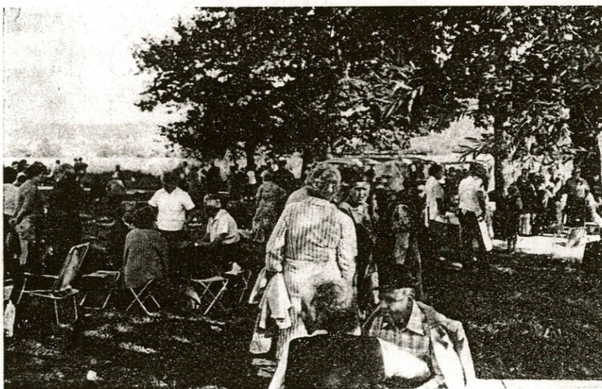
Povsod nasmejani obrazi in dobra volja — le prehitro je minilo