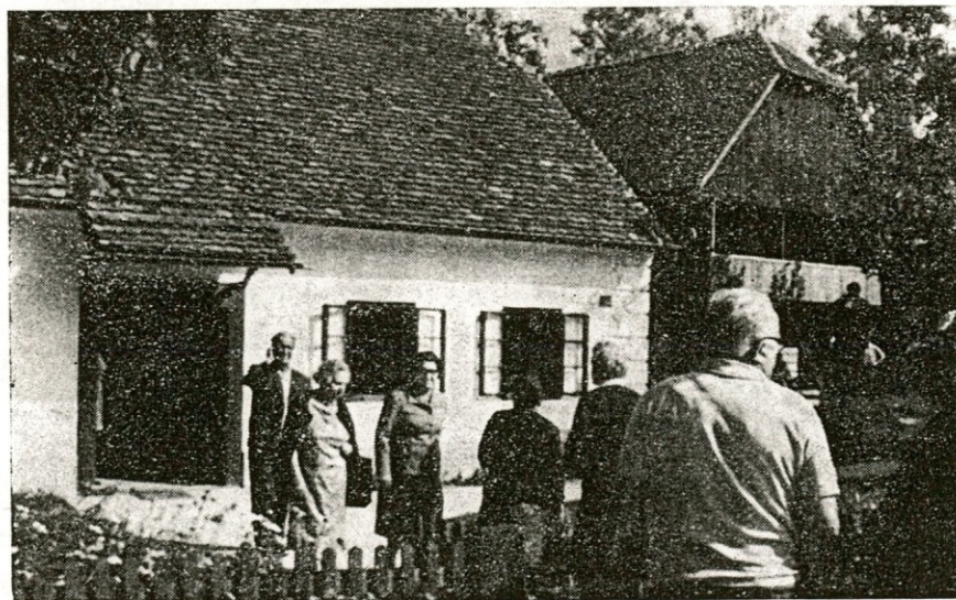
Naši upokojenci na izletu v Kumrovcu