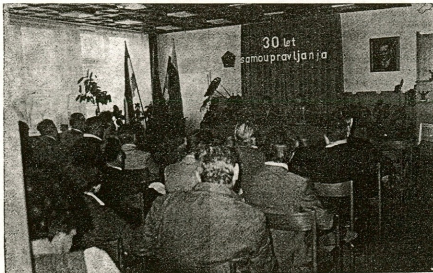
Udeleženci slavnostne seje delavskega sveta

Med takšne pridobitve spada na primer naše tovarniško glasilo Konoplan, ki bo čez dve leti prav tako slavilo svojo 30-letnico obstoja. Dalje sodi med takšne pridobitve naša »tovarniška samopomoč«, ki je v številnih letih svojega dosedanjega delovanja solidarno pomagala vsakemu sodelavcu, ki se je znašel v stiski. V tem obdobju so bili zgrajeni objekti našega družbenega standarda in pričele so se tudi že prve modernizacije strojnih kapacitet. Zlasti pa je v letu 1963 kolektiv bistveno preokrenil svojo pot gospodarskega razvoja: s samoupravno odločitvijo za preusmeritev proizvodnje, ki je takrat še temeljila na lanu in konoplji ter bombažu, na (Nadaljevanje na 2. strani)