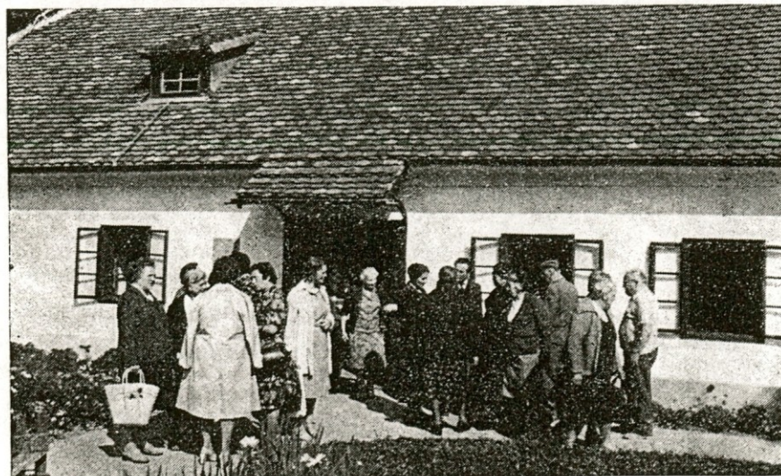
Pred rojstno hišo Josipa Broza Tita