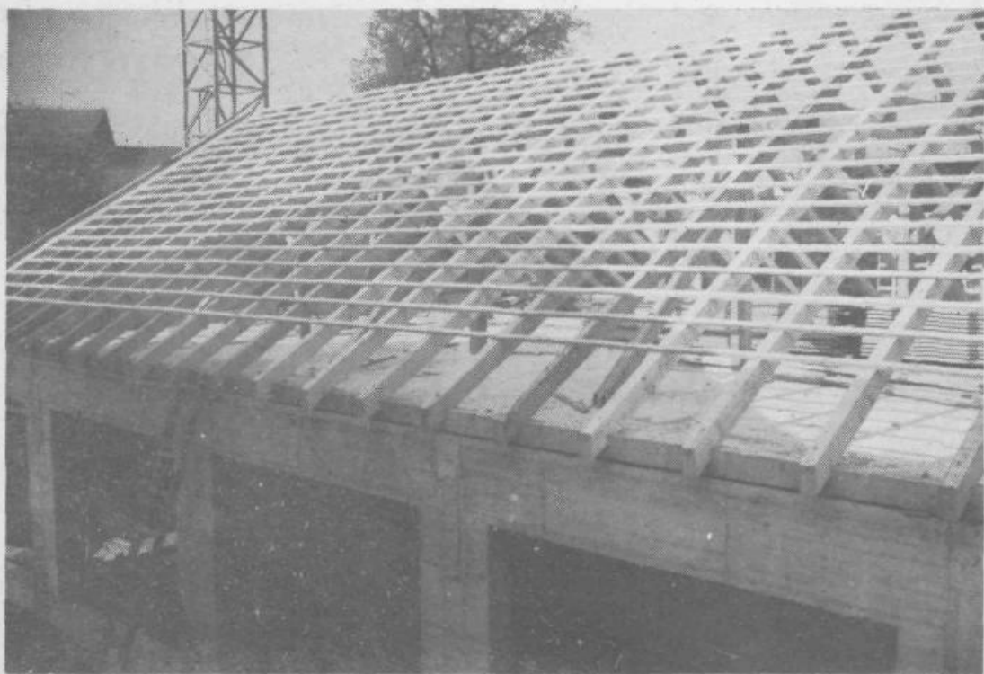
Dela pri novi telovadnici lepo napredujejo, otvoritev pa bo predvidoma ob 29. oktobru — prazniku občine Grosuplje.