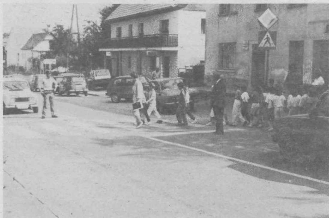
Prve šolske dni skrbijo za varen in pravilen prehod cicibanov čez cesto delavci postaje milice in člani ZŠAM