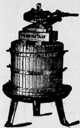
Stiskalnica za vino.

in za MASLINE so stiskalnice „ERCOLE“ najnovjše in izvrstnega sestava s pristojem za dvostruki in trajni pritisek; zajamčena največa izraba, veča od vseh drugih stiskalnic; najbolj avtomatične škropilnice za trte patent.