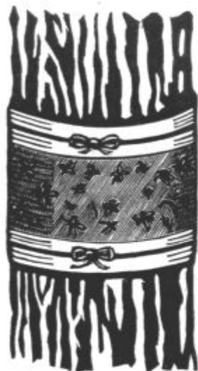
Sl. 6. Drevesni lepljivi pas.

trgovine nam dovolj jasno pove, kaj nam sadje lahko donša. Sadje je uvaževanja vreden eksportni artikel v narodnem gospodarstvu. Zato je dolžnost producenta, da pridela mnogo zdravega sadja. V ta namen je potrebno uporabljati primerna sredstva za pokončevanje škodljivcev. K najmodernejšim sredstvom za lovljenje živalskih škodljivcev prištevamo v zadnjem času že izgotovljene drevesne lepljive pasove „Rekord“.* Zanimiva je statistika, ki jo navaja svetovno znano podjetje I. G. Farbenindustrie, ki je razpečala v preteklem letu v Nemčiji 1 in pol milijona, v Češkoslovaški 350.000 in v Avstriji 50.000 že izgotovljenih lepljivih pasov. V naši državi se pasovi še uvajajo. Uporaba lepljivih pasov je že dolgo