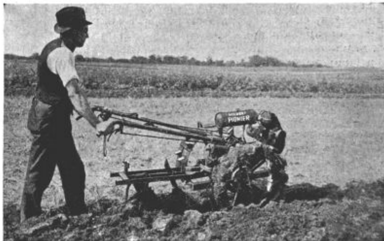
Slika 5. Traktor „Pionier“ tvrdke Holder.

Kakor povsod, tako tudi pri kmetijstvu izpodriva ročno in vprežno delo motorna sila. Vprašanje obdelovanja velikih zemljišč je že rešeno, traktor nadomestuje tam konje in opravlja vsa mogoča poljska dela. Za male in srednje kmetije pa te vrste traktorji ne pridejo v poštev, ker so predragi v ceni in pri malih zemljiščih naravnost nemogoči. Zato gre sodobna tehnika za tem, da ustvari uporaben mali traktor, ki bi svojega velikega vrstnika zamogel povsod nadomestovati in ki bi v ceni ne bil pre-