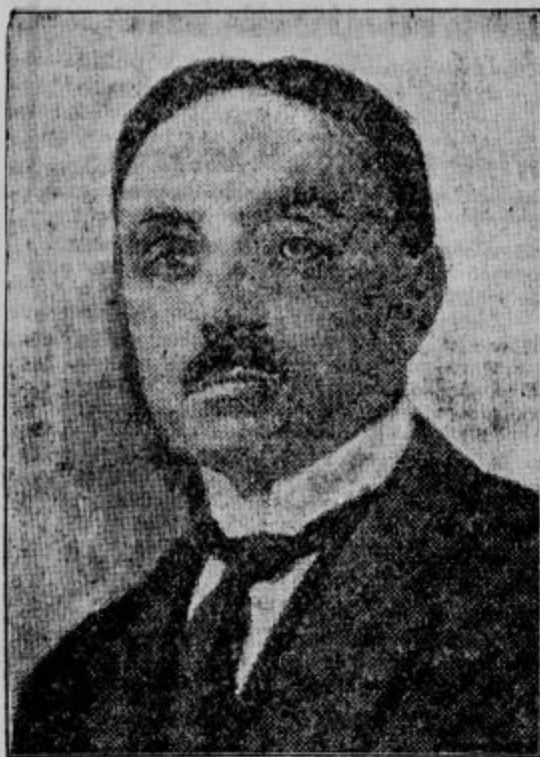
Gabriel Richard, konzul francoske republike v Ljubljani,

ki je bil na to mesto, katero je zasedal de Flache, imenovan 1. marca 1927. Novi konzul je bil rojen v Lyonu 8. februarja 1889. Dovršil je v Parizu Šolo političnih ved in Šolo višjih socialnih znanosti. Od leta 1917 do 1918 je bil član Srbskega tiskovnega urada v Zenevi. Prepotoval je potem velik del Jugoslavije, koje prilike so mu izvrstno znane. Govori popolnoma srbsko-hrvatski jezik. Od leta 1920 do 1925 je služboval v francoskem poslaništvu v Beogradu. Opravljal je mejtem tudi posle francoskega konzulata v Dubrovniku. Od 1925 dalje je bil ataše francoskega poslaništva v Budimpešti, odkoder je bil naznačen v Ljubljano, kjer je prisrčno sprejet kot velik prijatelj našega naroda in države.