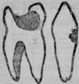
Slika votlih odir. razjedanih zob.