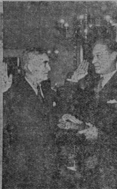
Karel Edison, sin velikega ameri- škoga izumitelja, pri zaprisegi kot novi mornariški minister Zedinje- nih držav