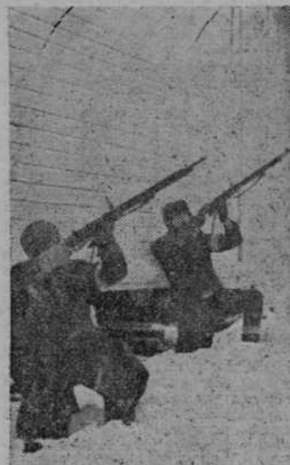
Sovjetska letala zelo pogosto le- tajo nad Finsko. Slika nam pred- stavlja dva posebno izurjena fins- ska strelca »pri delu«