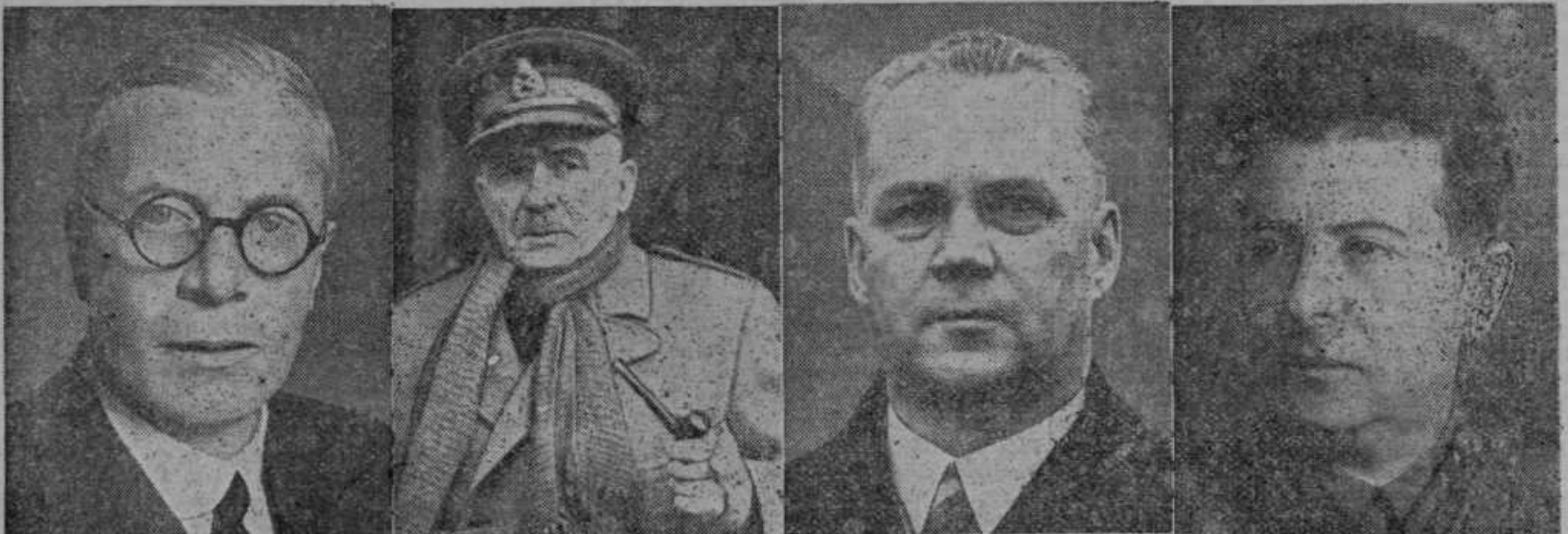
Oliver Stanley, novi angleški vojni minister