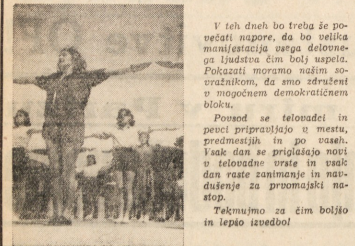
V teh dneh do treba še povečati napore, da bo velika manifestacija vsega delovnega ljudstva čim bolj uspešna. Pokazati moramo našim sovražnikom, da smo združeni v močnem demokratičnem bloku.