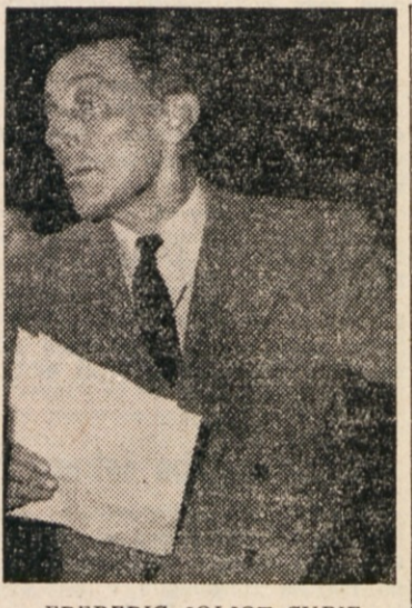
FREDERIC JOLIOT CURIE

PARIZ, 20. — Svetovni kongres pristašev miru se je začel ob 10.40 pod predsedstvom Joliot Curie. V veliki dvorani so napisali v francoski, ruski, angleški, španjščini in italijanski: »Enotnost v borbi za mir je najsvetjetejša dolžnost.«