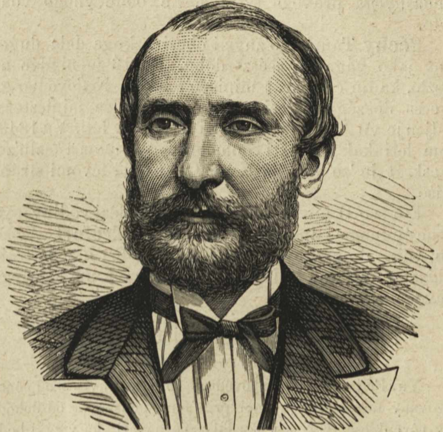
Simonyi Lajos baron.