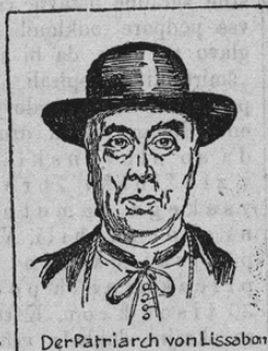
Der Patriarch von Lissabon

Kakor znano, bil je glavni vzrok revolucije zapravljivo in protiljudsko gospodarstvo kralja, ki je stal popolnoma pod klerikalnim vplivom. Že od časa, ko so prejšnjega kralja umorili, širila se je nezadovoljnost bednega ljudstva. Naša prva slika kaže na desni strani odslovljenega kralja Manuela II., v sredi njegovo mati kraljico-vdovo Amalijo, ki je zagrižena klerikalka in je jako slabo vplivala na mladega kralja, na levi strani pa kraljevega strica doma Alfonso de Braganza, ki se je junaško proti upornikom boril in je kralja varoval, pri temu pa baje lastno življenje izgubil. Druga