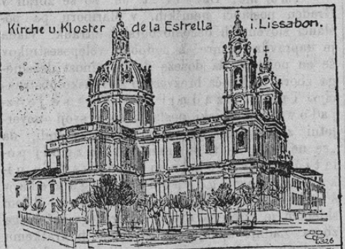
Kirche u. Kloster de la Estrella in Lissabon.