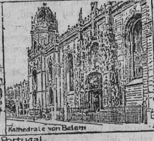
Kathedrale von Belem