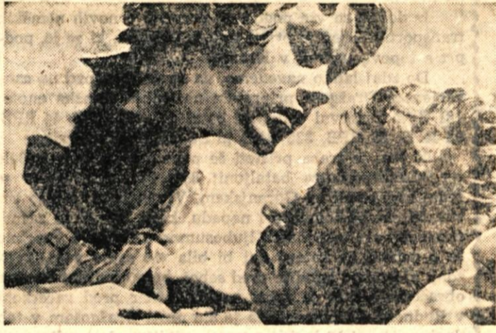
V Kranju bomo videli film sovjetskega režiserja Grigorija Cuhaja, ki ga pri nas poznamo po njegovih odličnih filmih Enainštirideseti in Balada o vojaku. Film «Čisto nebo», ki je posnet v barvah, je dobil prvo nagrado na letošnjem filmskem festivalu v Moskvi.

Drugo kolo, ki ga je obdolženec vzel, je skril v grmovju v bližini doma in se nato vrnil v gostilno. Tudi v tem primeru je popolnoma jasno, da si je obdolženec hotel prilastiti tudi to kolo. Sodišče ga je ob upoštevanju njegove predkaznovanosti obsodilo na 10 mesecev strogega zapore.