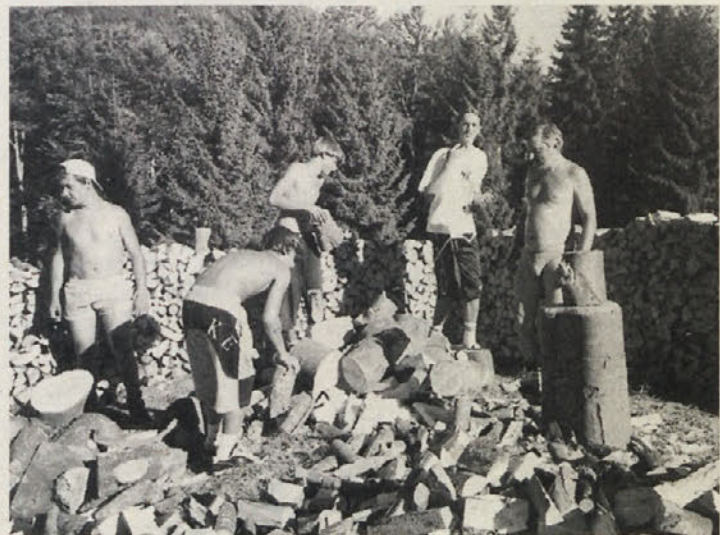
Pridne roke so pripravile drva za zimo