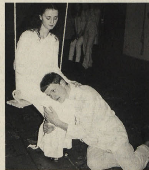
Kresna noč razvema srca ...