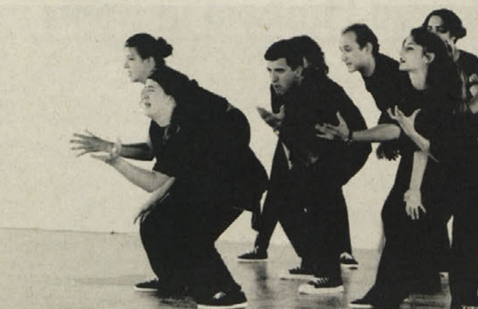
Mladi Romi v gledališki delavnici