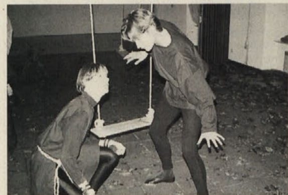
Dinamična igra Oberona in Spaka