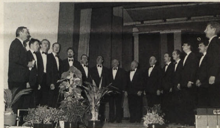
Moški zbor »Trta« se odlikuje z ubranim petjem