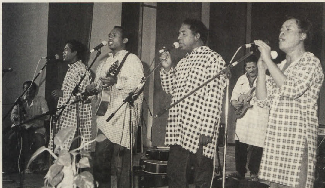
Obiskovalce je navdušil nastop vokalno-instrumentalne skupine Mahaleo z Madagaskarja