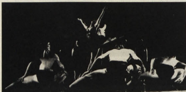
Kaleidoskop modernega baleta

Predstave bodo še 20. 11., 3., 6., 12. in 13. 12. ob 19. 30.