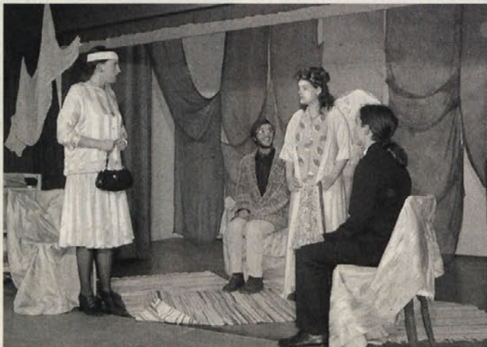
Vse pretirano resno, zato tembolj smešno

Če je bila potrebna tolika mera občasne agresije v pogovoru, je seveda stvar zornega kota: res je, da poznamo tudi v vsakdanjem življenju obilico iracionalnih izbruhov sovra-