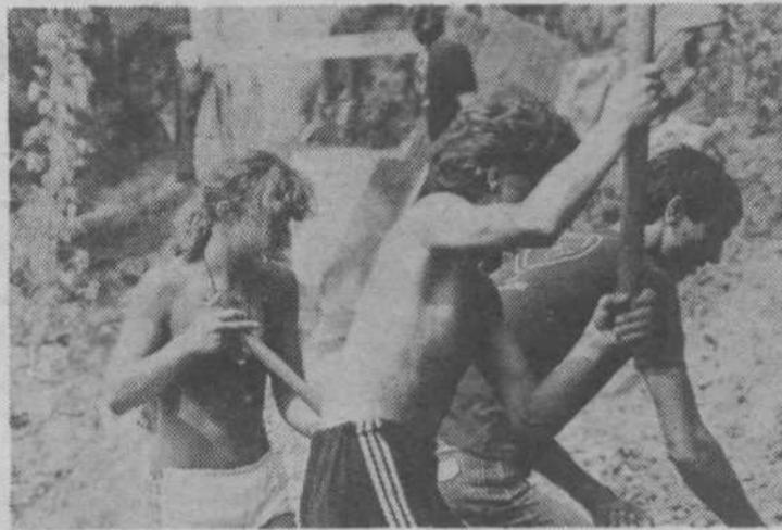
Komandant brigade (na desni z lopato) je bil vse dni tudi pri delu v prvih vrstah

Zvočnik objavlja sestanke komisij v Mojčini sobi ali pa kar za šotorom, kjer lahko kasneje pri »kantinku« kupiš coca colo, pivo, čokolado. Potem se športniki bojujejo za točke v namiznem tenisu, odbojki in nogometu, udarniki kinkajo, »zaljubljenici« pa si po zvočnikih podarjajo pesmice.