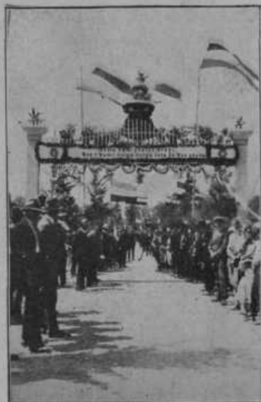
Slavolok ob otvoritvi dupleškega mosta. Otvoritvi so prisotvovala velike množice ljudstva.