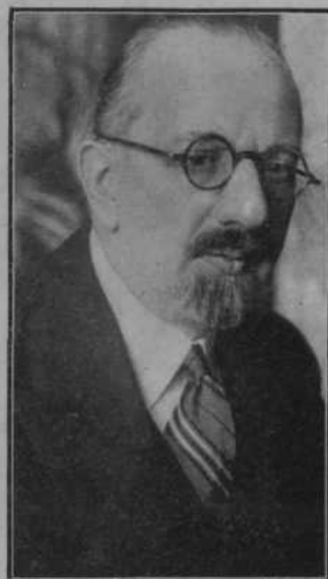
Dr. Šverljuga, jugoslovanski finančni minister.