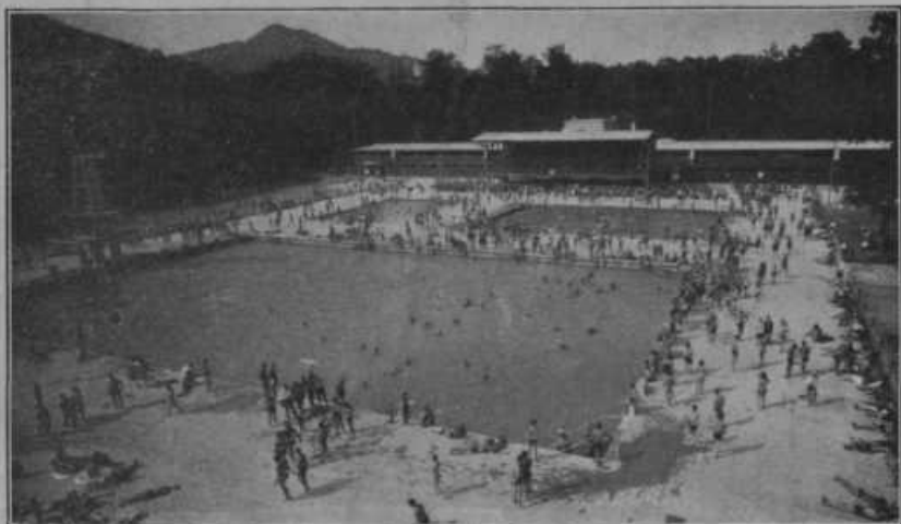
Kopališče na Mariborskem otoku, ki ga je zgradila mestna občina mariborska z velikimi denarnimi žrtvami. To kopališče je eno najlepših in najmodernejše urejenih v državi. Posebno ob nedeljah je vedno polno. Sem se prihajajo kopat celo iz Avstrije.