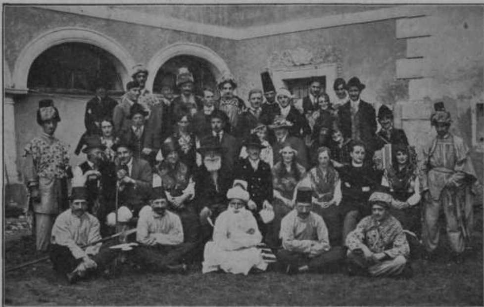
»Miklova Zala«, narodna igra s petjem je ena najlepših slovenskih ljudskih gledaliških iger. Pred kratkim so jo igrali člani prosv. društva iz St. Jakoba v Rožu na Koroškem tudi pri nas v Ljubljani in v Mariboru z velikanskim uspehom.