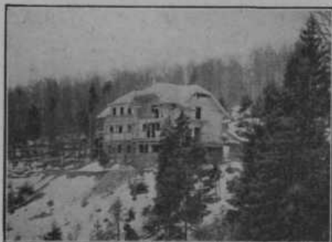
Pohorski dom, ki so ga zgradili mestni uslužbenci mariborski na Pohorju in ki je bil otvorjen 14. junija. Ta dom je eden najlepših in najboljše urejenih v Dravski banovini. Služi predvsem mestnim uslužbenecem mariborskim za letovišče, pristopen je pa vsakemu, ki hoče nekoliko časa biti na oddihu v čistem gorskem zraku. V domu je 26 sob z 48 posteljami.