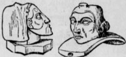
Dve glavi indijanskih pip iz ruševin indijanskih žrtvenikov v dolini reke Ohio.

Skitih, da so vdihavali dim listja neke rastline tako, da so njeno listje metali na goreče oglje. Pomponius Mela pa ve povedati isto o Tračanin. Stari Kelti pa so menda poznali že njuhanje. Vse te razvade so seveda prišle z nastopom novih narodov v Evropi v pozabo, ki je bila varna pred tem zlom, dokler ni začel tobak svojega zmagovitnega pohoda po Evropi. Evropeci so se naučili ka-