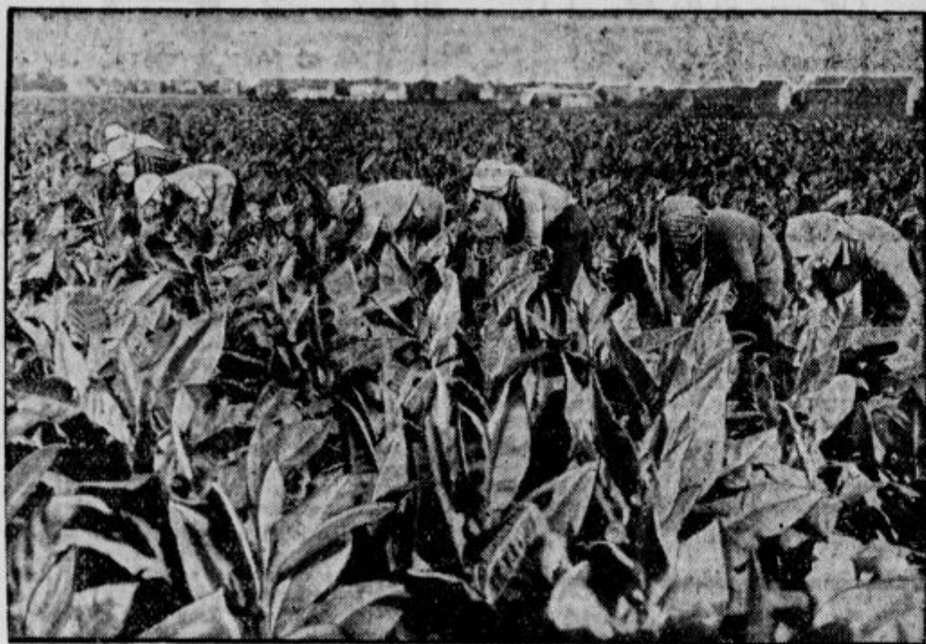
Zelov tobaka v Bolgariji

Ko so se Španci, ki jih je pripeljal Kolumb leta 1492 do otoka Kube, tam izkrcali, so opazili, da tamošnji domačini drže v ustih zvitek tlečih posušenih listov. Tamošnji Indijanci so kadili nekakšne cigare in z velikim užitkom vlekli svoje žike. Te cigare so domačini imenovali tabako. Odtod je dobila tudi rastlina ime. Če je tedaj to ime nastalo iz imena otoka Tobago ali pa iz imena meksikanske province Tobasco ali pa če sta tako otok in provinca dobila svoje ime po tobaku, se pa seveda ne da več ugotoviti.