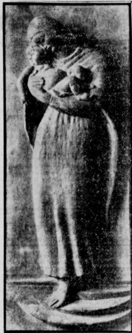
»Marija z Det-tom«, delo akad. kip. Fr. Gorseta, ki pripravlja večjo razstavo svojih del.

Precej ptic ima razklane jezike. Jezik neke vrste ameriških senic je razklan celo na štiri dele. Vse te delce omenjena senica pri uživanju hrane združi in jih uporablja kot žličko, s katero krade jajčka in ličinke raznemu mrčesju.