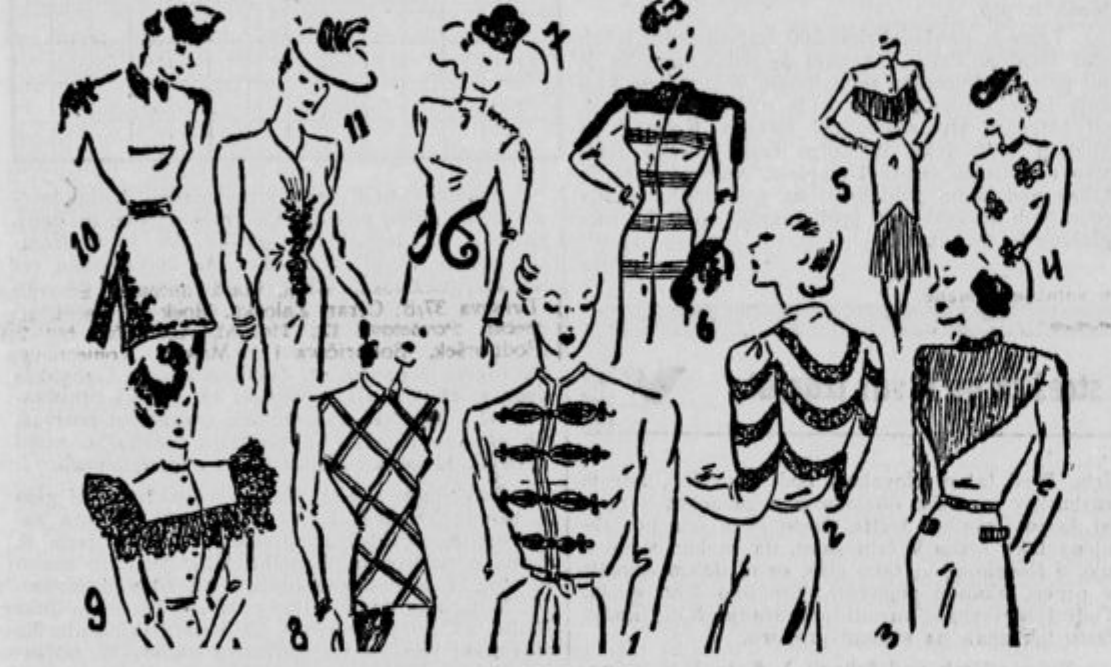
Novi okraski — spremenjena obleka

Stare obleke utegnesh z novimi okraski lepo spremeniti. Na sliki vidiš tele spremembe: 1. Pisana volnena vezena utegne tudi ponošeno obleko poživiti. Na sliki je črna obleka z zelenimi in rdečimi volnenimi okraski. 2. Svilena obleka pridobi z vdelanimi čipkami nov videz. 3. Na roko spleteni volneni deli na športnih oblekah so zmeraj lepi. 4. Biserna vezena je na črni volneni obleki. 5. Rese dobiš v vsakem gospodinjstvu. Letos jih uporabiš za okras obleke, kar obleko jako polepša. 6. Robčki, šivanj z roko, so na oblekah in plaščih zmeraj lepo videti.