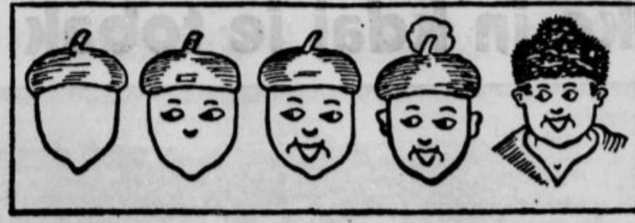
Iz želoda nastane deček.

Ben je dobro minuto stal kot okamenel. Nato je divje zavpil: »Vrag te vzemi! Kaj bom pa zdaj? Saj sem uničen! Ta stvar me je stala vse moje premoženje!« »Kaj pa mene to briga?« se je branil oni. »Poskusi drugod svojo srečo! Saj si tudi ti posegel v moj posel. Torej sva — bot!« Ves iz sebe od jeze je Ben odšel iz sobe. Slišati so bile stopinje, klci, loputanje z vrati — nato je bilo vse tiho. »Je že minilo, Ali,« je dejal maharadža svemu slugi, ki je ves trd od groze ždel v kotu. »Kakšna sreča, da sem si tako lepo izmislil!«