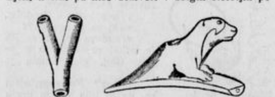
Na levi: Dvojna cevka pipe, kakršno so zatikali Indijanci v nosnici. — Na desni: Stara indijanska lončena kratka pipa. Našli so jo v grobu na obali Floride.

Če pogledamo današnjo industrijo tobaka, vidimo, da se je poraba tobaka sicer silno povečala, njeni načini pa niso doživeli v dolgih stoletjih posebnih sprememb. Če hočete, smo celo nazadovani. Takih pip, kakršne so si privoščili Indijanci, ne poznamo več. Poleg običajnih pip, ki so imele kratke ustnike in glave izdelane navadno res v obliki glav, so imeli še posebne pipe, ki so imele dvojen ustnik. Pravzaprav to ni bil več ustnik, ampak cevka, ki se je razcepila v votle vilice. To dvojno cevko, ki je podaljšana vodila kot ena sama cev do pipe, so zatikali Indijanci v obe nosnici in vlekli krepko skozi nos.