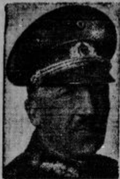
Vojni minister von Schleicher.