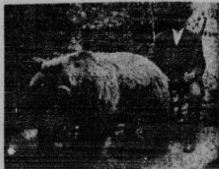
Lovska sreča: 140 kg težko medvedko je ustrelil v Podgrajskih gozdovih g. Lenarčič. Meso medvedke so pojedli in pravijo, da je bilo dobro.