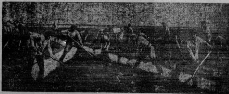
Na levi: Brezposelni pri osuševanju zemlje. - Mesto Hamburg je pridobilo več brezposelnih delavcev, da ob obali Severnega morja delajo jezove ter tako pridobe velike dele zemlje za obdelovanje.