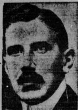
Kanceler von Papen. Novi člani nemške vlade.