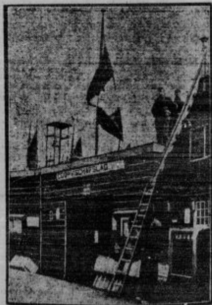
Zuiderski ribiči, ki jim bo novi nasip vzel kruh, ker bodo poginile ribe, so na dan blagoslovitve nasipa razobesili zastave na pol droga, kar pomeni žalovanje. Vlada jih tolaži, da jim bo dala zemljo za obdelovanje, da postanejo kmetje. Oni pa pravijo: Naši očetje so bili ribiči, mi smo ribiči — kmetje pa nismo in ne bomo!