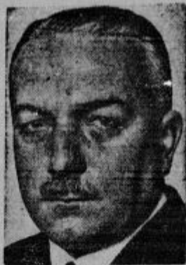
Zunanji minister von Neurath.