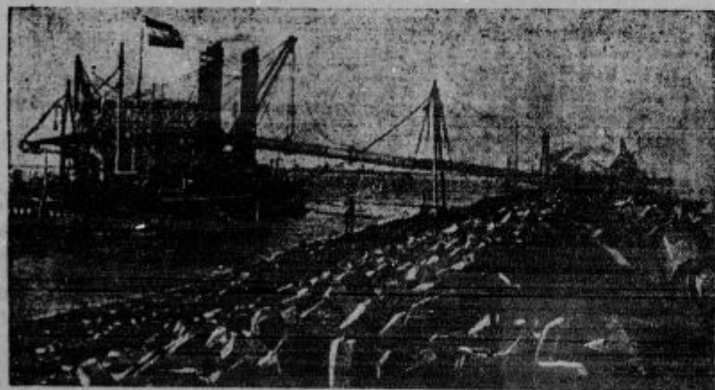
Osuševanje Zuiderskega jezera na Nizozemskem. Z velikanskimi stroški so Nizozemci s pomočjo velikih nasipov izsušili veliko ozemlje, ki je bilo poplavljeno od morja in s tem pridobili sveta, kjer bo lahko živelo 2 milijona ljudi.