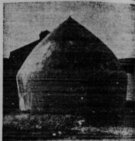
Plinsko zavetišče. Na velesejnu so razstavili tole železobetonsko zgradbo, v kateri se je mogoče skriti pred bombami in strupenimi plini, ki jih bodo v bodočih vojnah metali sovražni letalci.