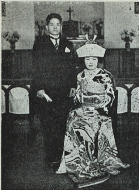
Slika tu kaže srečen novoporočeni par na Japonskem.