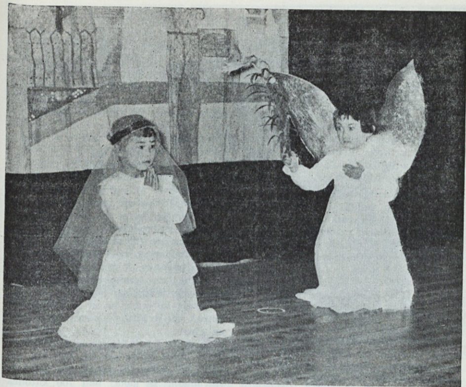
Marijino oznanjenje, kot so ga predstavili japonski pogančki v misijonu o. Vladimirja Kosa S.J.

sem mogel verjeti, da me je doletela čast, biti izbran od Vašega podjetnega krožka kot cilj miroljubnega pisemskega napada. Veste, zakaj smatram vso zadevo za čast? Ker živim — nepoznan in nesluten — skoraj na koncu civiliziranega velemesta in torej normalno ne misli name ne časnikar ne bankir ne politik. Jaz sem enostavno eden izmed desetih milijonov — to se pravi, nisem milijon, le številka v vsoti desetih milijonov. Kako ste Vi prišli na idejo, da ste izbrali prav mojo prašnorumeno planjavo, se mi zdi skrivnost. Karkori bodi temu vzrok in pomota, vesel sem te časti in bom skušal odgovarjati na Vaša pisma, ako boste še kdaj kaj pisali. Pravim: skušal bom