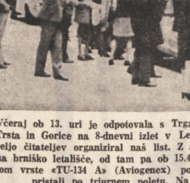
Včeraj ob 13. uri je odpotovala s Trga Ulpiano skupina 80 izletnikov iz Trsta in Gorice na 8-dnevni izlet v Leningrad in Moskvo, ki ga je na željo čitateljev organiziral naš list. Z avtobusom so se izletniki odpeljali na brniško letališče, od tam pa ob 15.30 po jugoslovanskem času z letalom vrste TU-134 A (Avioindex) poleteli proti Leningradu, kjer so pristali ob triurnem poletu. Na sliki ob odhodu avtobusov