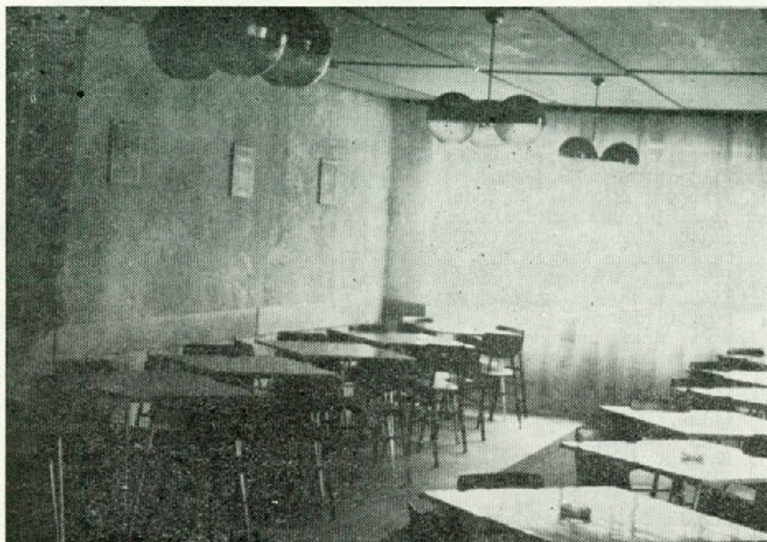
Okusno opremljena jedilnica