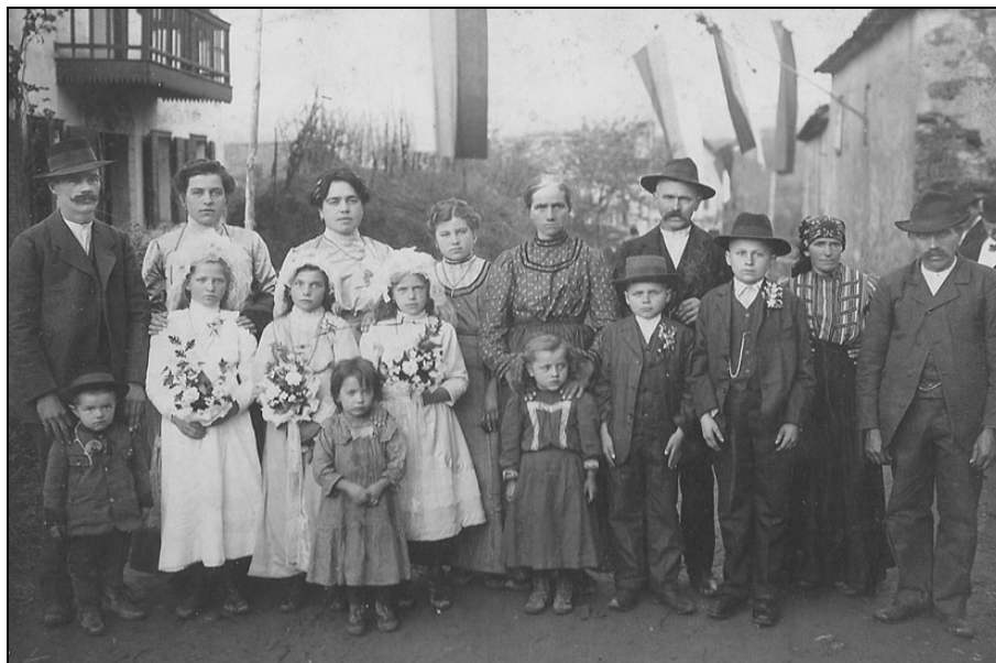
Družinska slika pred hišo Terkučevih v Gornjem Cerovem na dan prvega obhajila leta 1910. Fantje so takrat ponavadi dobili svoj prvi klobuk. Le premožnejše družine so ga kupile mlajšim otrokom, na kar so bili ti ponosni.

osvetliti nekatere segmente iz življenja otrok v 19. stoletju. Gradivo, ki ponuja sicer bogat vpogled v materialno kulturo kmečkega prebivalstva, je s svojimi podatki o umrlem, njegovih otrocih, zakoncu in drugih sorodnikih zanesljiv vir za preučevanje socialne in družbene zgodovine. Za zgodovino otroštva so poleg zapuščinskih razprav uporabni sklepi skrbniškega urada, ki jim je določal skrbnike, poročila o stanju dediščine, vzgoji in reji otrok, obračuni stroškov njihovega vzdrževanja ter dovoljenja za spregled starosti. 4 Ob izbiri načina obdelave in interpretacije podatkov sem si izbrala tako kvantitativno metodo kot kvalitativni način obdelave, kar mi omogoča razmeroma majhno preučevano območje. Kot sekundarne vire sem uporabila pričevanja, zapisana v Terenskih zvezkih Slovenskega etnografskega muzeja, t. i. Orlove ekipe iz leta 1953, ki je od 1. do 31. avgusta obdelovala Brda, 5 ter pričevanja, ki jih je na terenu zapisal etnolog Karel Plestenjak in jih hrani Goriški muzej. Z vidika Braudelovega dolgega trajanja, po katerem se mentaliteta z zamikom odziva na spremenjene gospodarske in družbene okoliščine, pa sem v pomoč pri interpretaciji pritegnila tudi omembe, ki se nanašajo na materialno in duhovno kulturo, povezano z vzgojo in nego otrok in so nastale v času po prvi svetovni vojni. Preučevano nekoč 6 enotno območje Goriških brd vključuje vasi Brestje, Hum, Dolnje in Gornje Cero-