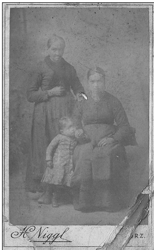
Tri generacije družine Terkuč iz Gornjega Cerovega. Mala deklica nosi obleko, podobno odrasli noši.

svojo praznično obleko v starosti 4 let, iz česar se da sklepati, da so takrat začeli obiskovati vaško cerkev. 68 To pa ne velja za družine zakupnikov, saj Keršičeva zapiše, da zaradi preslabe obleke niso