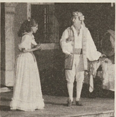
Prizor iz Linhartove veseloigre, ki so jo odigrali v Bajti

Z ozirom na visoke kazni, ki so stopile v veljavo z novimi predpisi in ob njih številni odprti problemi ne bodo prav nič omilili, pri Slovenskem deželnem gospodarskem združenju svetujejo trgovcem, naj se za vsa pojasnila obrnejo na njegove urade v Trstu in Gorici.