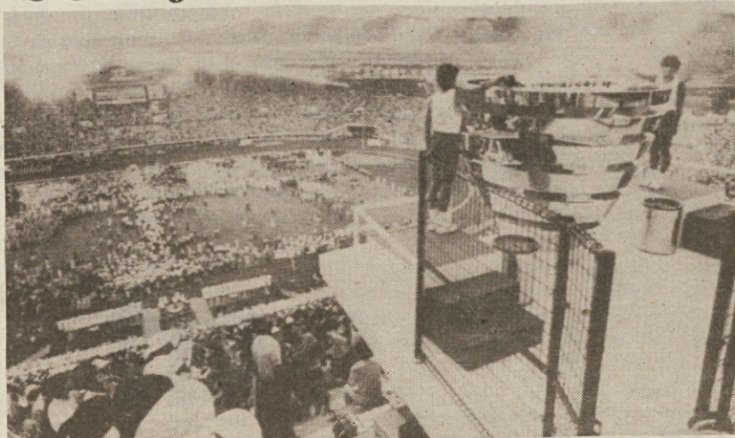
Na stadionu v japonskem Kobju so pred 60 tisoč ljudmi svečano odprli letošnjo univerziado. Ogenj sta prižgala japonska atleta