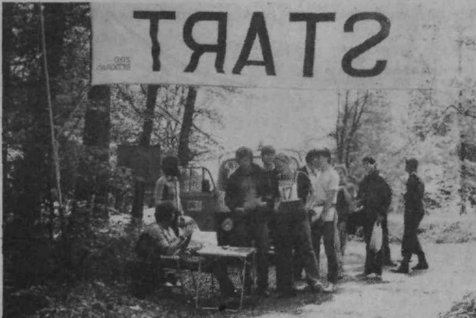
Start je bil v tako imenovani Sračji dolini, na začetku trimske steze. Petčlanske mešane ekipe so od tam hitro krenile proti kontrolni točki, kjer jih je čakala prva naloga, prva preizkušnja znanja (zgoraj). V primeru splošnega ljudskega odpora ali elementarnih nevarnosti mora praktično vsako obvladati osnove prve pomoči, zato so morali člani ekip praktično oskrbeti poškodovanca ter odgovoriti na nekaj teoretičnih vprašanj. Pri tem člani komisij niso bili samo izpraševalci, ampak so tekmovalcem tudi pojasnjevali napake in jim razlajali znanje. (spodaj levo)

Pot od črnuške gmajne do vrha Rašice je bila pretekli ponedeljek prizorišče občinskega tekmovanja »Vzgoja mladine za naloge splošnega ljudskega odpora in družbene samozaščite«, nad katerim je v času jubileja Osvobodilne fronte prevzela pokroviteljstvo občinska konferenca SZDL. Mladi z osnovnih in srednjih šol so morali v petčlanskih ekipah pokazati veliko znanja in telesnih sposobnosti. Osnovni smoter tekmovanja je krepitev obrambne zavesti in pripravljenosti mladih, zato rezultati tokrat niso bili v ospredju. Največ znanja je med osnovnimi šolami pokazala ekipa OŠ Borisa Kidriča pred Miranom Jarcem in Borisom Zihlerom, med srednjimi šolami pa je še bila najboljša Gradbena tehniška šola pred Poklicno gradbeno šolo Ivana Kavčiča in Centrom strokovnih šol.