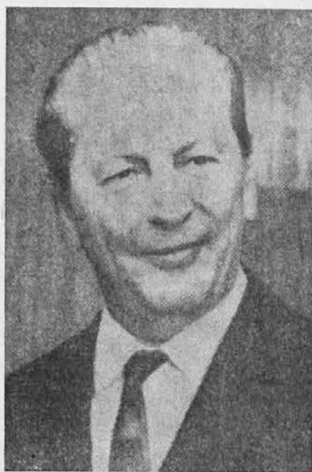
Sedanji predsednik zahodnonemške vlade kancler Kurt Kiesinger

V beograjski škofiji so Slovenci druga najmočnejša skupina katoličanov. V nadškofiji je med 29 duhovniki 12 Slovencev. Slovenci so po vseh župnijah častno zastopani v cerkvenih odborih. Veliko je v Srbiji tudi slovenskih redovnic. Doma niso mogle delovati in so odšle na jug, kjer so jih radi sprejeli.