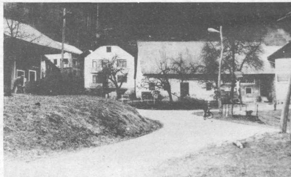
Podolnška panorama: staro se meša z novim