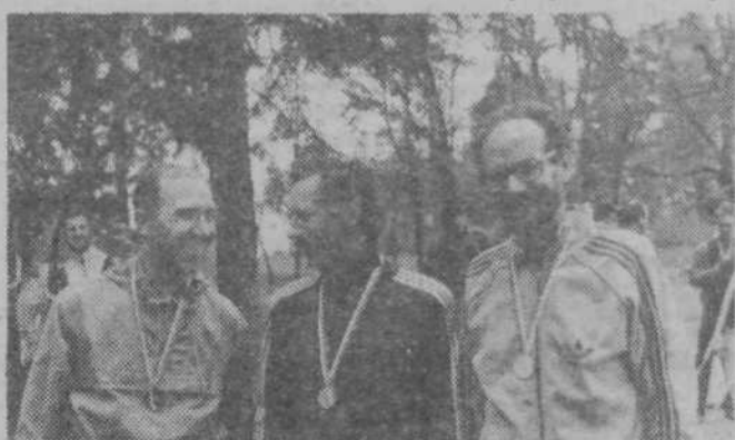
Najboljši med veterani