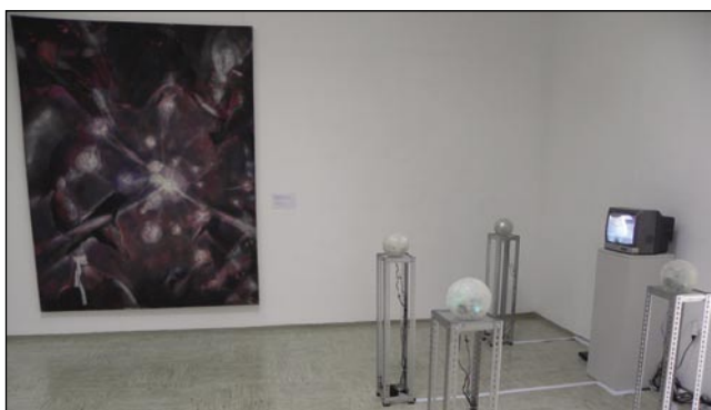
Tudi táka je sodobna likovna umetnost.

Tudi za nestrokovnjaka, zgolj ljubitelja likovne umetnosti, je razstava tolikšnega števila ustvarjalcev zanimiva, kajti na neki način nakazuje, kam se usmerjajo bodoči slikarji in kiparji, koliko so navezani na aktualno pomursko likovno ustvarjalnost, ki sodi prav v slovenski vrh, in še kaj se najde v vseh prostorih