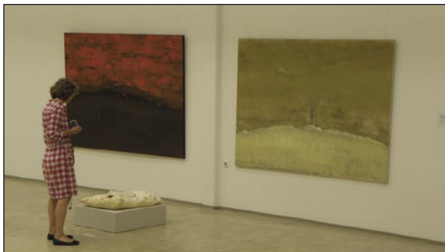
Pogled na nekaj del že uveljavljenih in bodočih pomurskih likovnih ustvarjalcev

Na razstavi sodeluje 26 avtorjev, med katerimi so tudi že priznani pomurski akademsko izobraženi likovni ustvarjalci, ki so že imeli samostojne razstave ali so sodelovali na skupinskih,