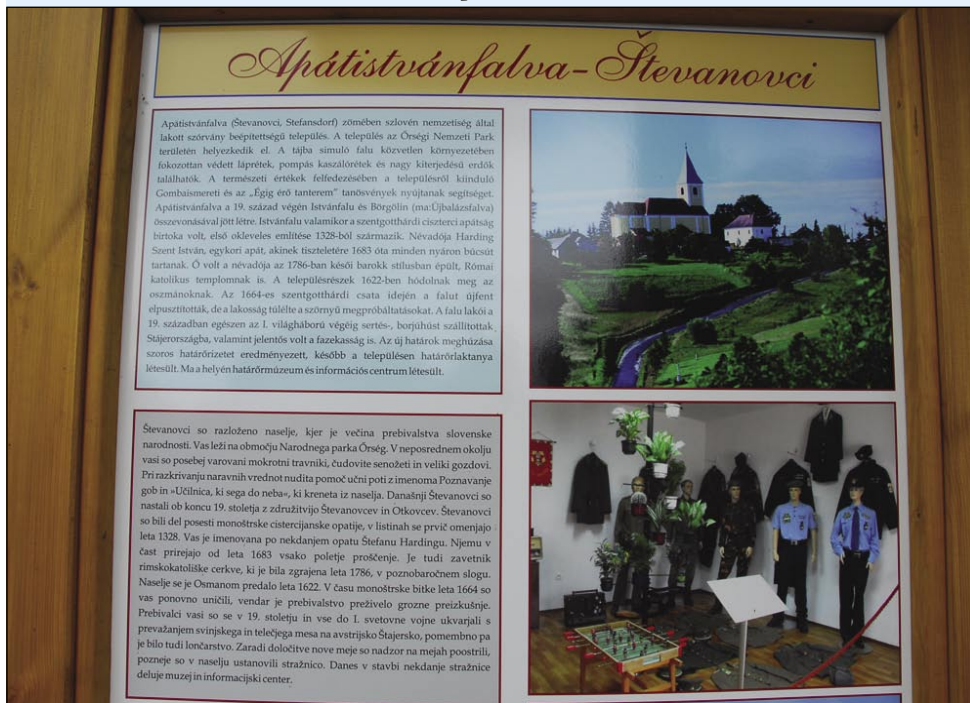
Na informacijski tabljaj se leko preštē o zgodovinski pa naravni vrednotaj vesi

jona forintov, se 85-procentov finansira iz sredstev Regionalnega operativnega programa (ROP), 15-procentov pa morajo vcujdati vesnice. Projekt se je začno marciūša 2010, končati se mora augustūša 2012.