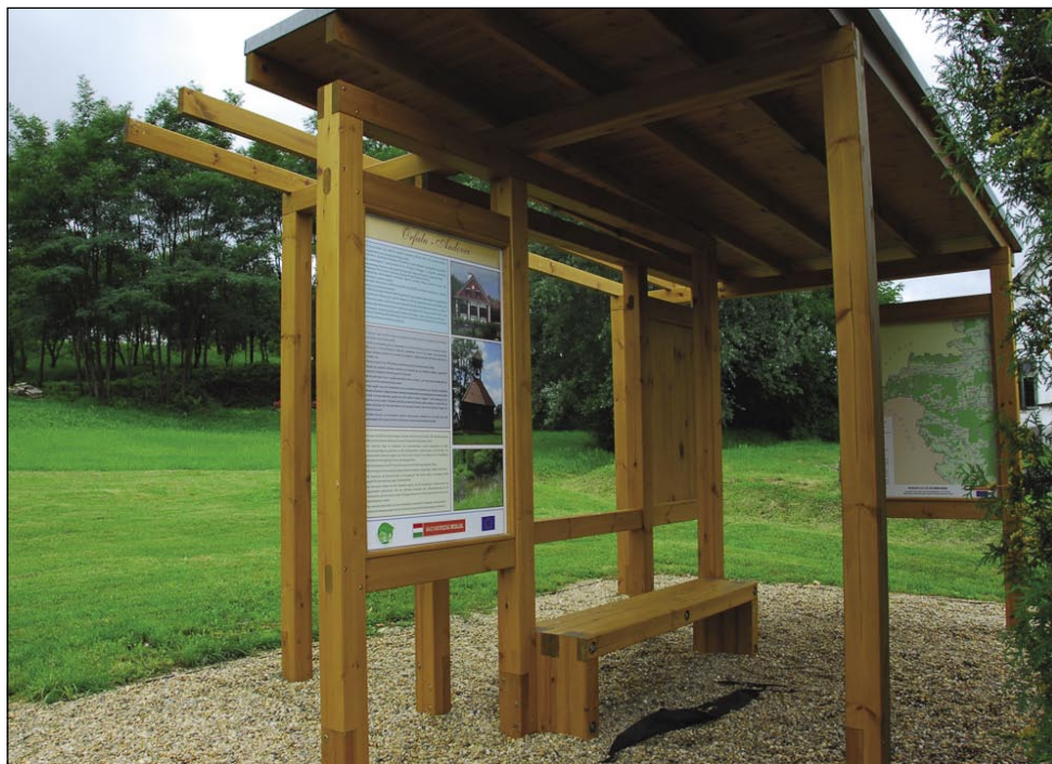
Lepau napravlene informacijske točke, gde se turist leko skrije pred dežjom tō pa se malo spočine

Zatok je pa razveseljivo, ka ma Nacionalni park Őrség en projekt, steri de leko pomago individualnim (egyčni) turistom, steri radi odkrivajo sami pokrajino, vrejdnosti krajine. Projekt Od Őrséga do Porabja vodi uprava Nacionalnoga parka Őrség, v njem so partnerji vse porabske vasi, porabske občine (Gorenji Senik, Dolenji Senik, Sakalovci, Števanovci, Verica-Ritkarovci, Andovci), zvūn nji eške ništerne vasi Őrséga pa RA Natúrpark. Projekt, steri de košto 291,5 mili-