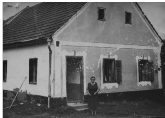
Čafardjina iža v Števanovci, pred izov Anina mati

»Dja sem večkrat prajla, ka dja bi že zdaj tam nej vōzdr-