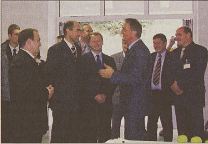
Predsednika vlade je sprejel sevnški župan.

sluhili strokovnim predavanjem o tem, kako delati očem dopadljiv ter bralcem razumljiv in všečen lokalni časopis, na okrogli mizi o pluralizaciji medijev pa so se kresala mnenja poslanke Majde Širca , kulturnega ministra Vaska Simonitija , predsednika