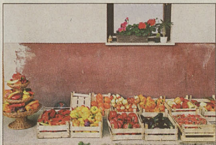
Ekološko pridelana zelenjava in jagode, ki so jih pridelali Černeličevi.