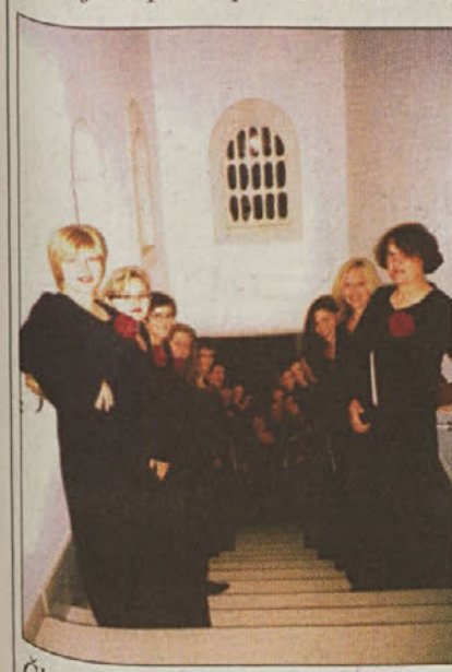
Članice Solzic pred dvorano v Pučišču

Brač - Vokalna skupina Solzice je prejšnji vikend gostovala na Braču, s čimer je vrnila obisk klapi Volat, ki je lani navdušila Brežičane. Po koncertu v Pučišču, kjer so doma spretni klesarji grško-rimskega sloga in kjer vsako leto organizirajo uspešne poletne šole za mlade glasbene talente -