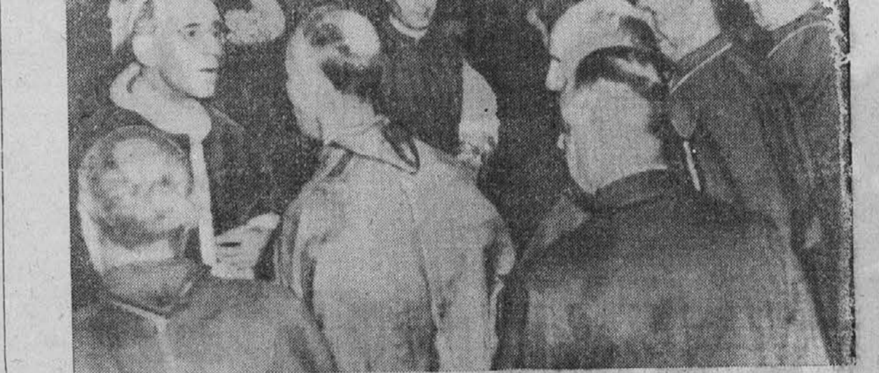
Po svečanostih, ki so se vršile ob priliki jsovjetitve novih kardinalov v Rimu je pa- pež Pij XII. nagovoril nove kardinale. Sv. Oče je na levi na sliki, na skrajni desni pa je Francis kardinal Spellman in levo od njega pa je Norman kardinal Gilroy iz Sydney-a, Avstralia.

Poceni hiše Naprodaj je hiša za 1 družino, poceni. Dalje hiša na Cherokee, 10 sob, za 2 družini. Zidana hiša na Nottingham Rd. med St. Clair in Euclid Ave. Za nadaljna pojasnila pokličite IV 1514 (51)