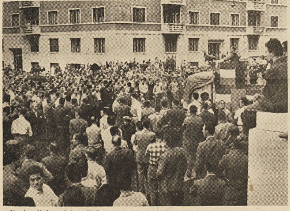
Kovinarji kompleksa CRDA in Arzenala vodijo še vedno z isto odločnostjo trdo borbo za doseg svojih skromnih zahtev...