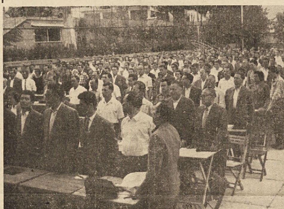
Po starem običaju so se tržaški kongresisti na otvoritvenem zasedanju spomnili vseh umrlih voditeljev in članov, kakor tudi vseh padlih za svobodo, katere so počastili z enominutnim molkom. Šele na to so kongresisti prišli z rednim delom.

partije in, za člane CK z vrnitvijo polnopravnega člana v stalez kandidata ter kot skrajni ukrep za izključitvijo iz partije. Za sprejem takšnega skrajnega ukrepa proti članom in kandidatom CK ter proti vsem članom kontrolne komisije, je treba sklicati plenarno zasedanje CK z udeležbo vseh kandidatov CK in vseh članov kontrolne komisije. Če plenarno zasedanje najvišjih voditeljev partije z večino dveh tretjin glasov prizna potrebo, da se polnopravni člani CK vrne v stalez kandidata ali da se ga izključi, mora biti ta ukrep nemudoma izveden.